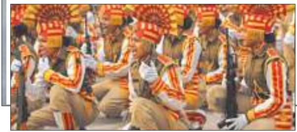
शनिवार को नई दिल्ली में सुबह के कोहरे के बीच गणतंत्र दिवस परेड 2024 के लिए रिहर्सल के दौरान सशस्त्र सीमा बल (एसएसबी) की महिला कर्मीं.