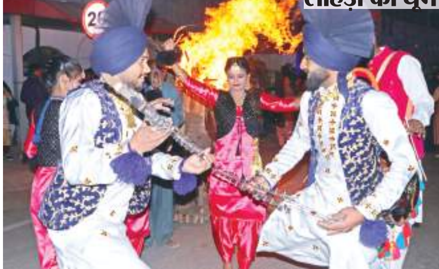
राजधानी रांची में धूमधाम से मनायी गयी लोहड़ी