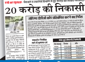
शुभम संदेश में प्रकाशित खबर