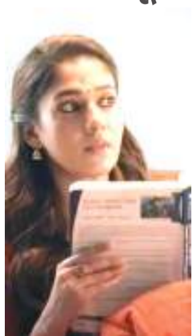
काटने के बाद यह फिल्म दोबारा रिलीज होती है या नहीं।

नयनतारा की फिल्म 'अन्नपूर्णा' नेटफ्लिक्स से हटी ली गई है। हाल ही में यह विवादों में आ गई थी। दरअसल इस फिल्म में जॉन वेंज खाने से जुड़ा एक सीन विवाद का कारण बन गया था और इसे लेकर विश्व हिंदू परिषद ने कड़ा विरोध दर्ज कराया था। आरोप था कि इस फिल्म में लंबे विवाद को भी दिखाया गया है। अब फिल्म के प्रोड्यूसर्स ने भावनाओं को आहत करने के लिए माफी भी मांगी है। हिंदू सेवा परिषद ने जबलपुर के थाना अमोती में मेकर्स और एक्ट्रेस के खिलाफ एफआईआर दर्ज कराई थी। इन सभी के खिलाफ पुलिस ने धारा 153 और 34 आईपीसी के तहत केस दर्ज किया था। बहरहाल, देखा यह है कि कुछ सींस को