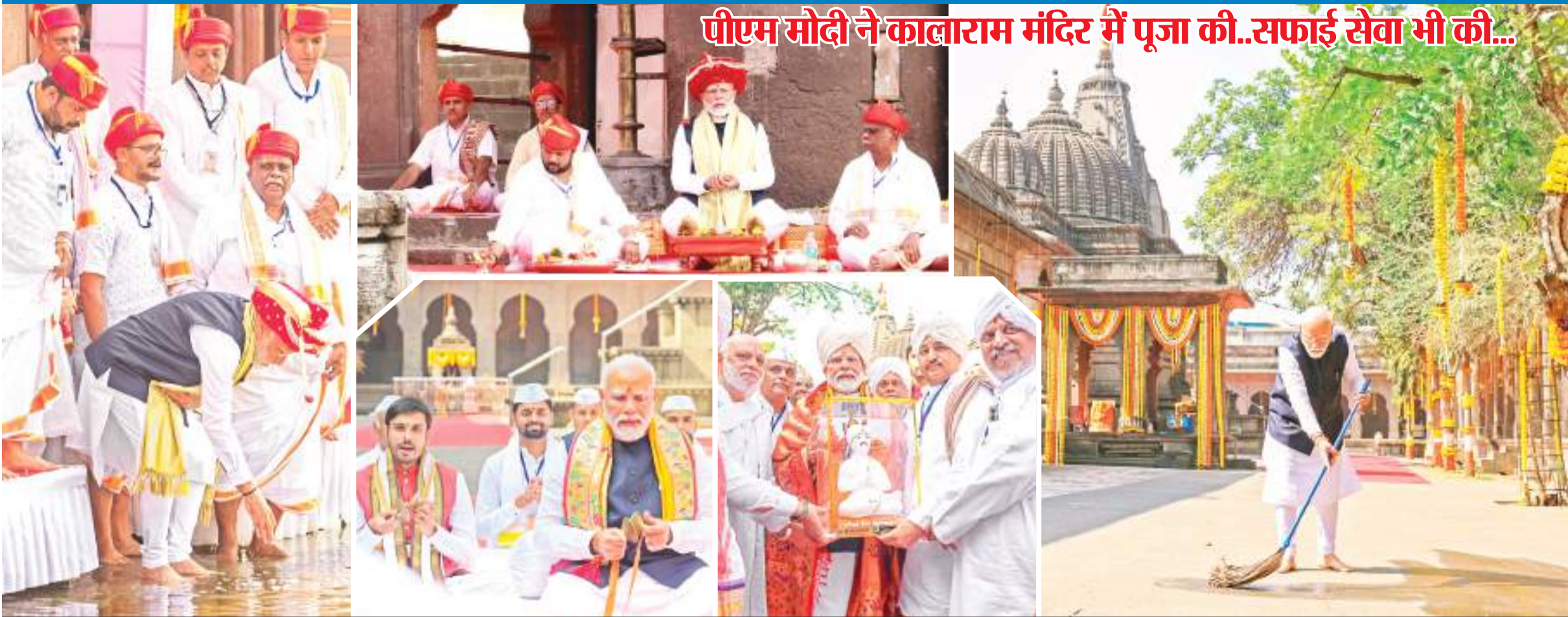
पीएम मोदी ने कालाराम मंदिर में पूजा की..सफाई सेवा भी की..