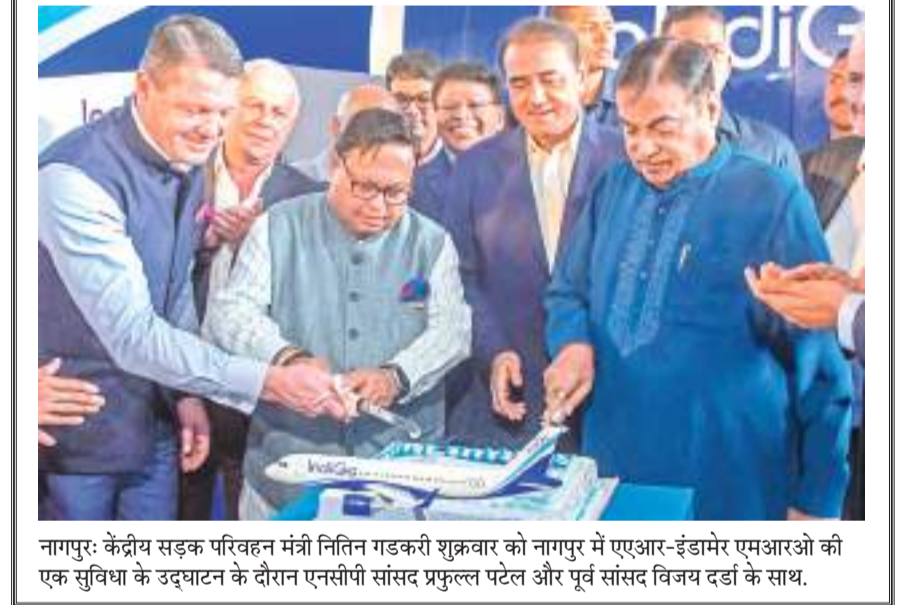
नागपुर: केंद्रीय सड़क परिवहन मंत्री नितिन गडकरी शुक्रवार को नागपुर में एएआर-इंडामेर एमआरओ की एक सुविधा के उद्घाटन के दौरान एनसीपी सांसद प्रफुल्ल पटेल और पूर्व सांसद विजय दर्डा के साथ.