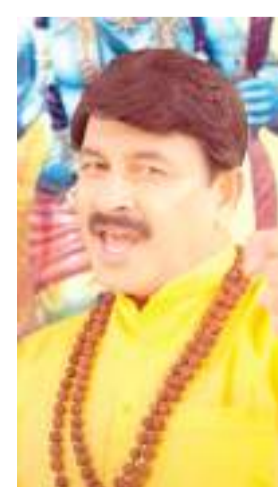
है कि 22 जनवरी को अयोध्या में राम लला मंदिर की प्राण-प्रतिष्ठा होनी है।