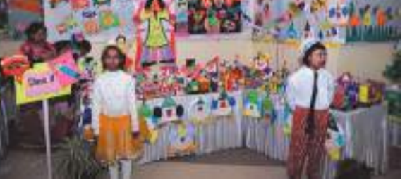
गुरु नानक स्कूल में आयोजित शिल्प प्रदर्शनी 'सृजन' शामिल बच्चे और उनके प्रदर्श।