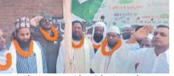
गणतंत्र दिवस के अवसर पर राजधानी के इमामों ने राष्ट्रीय ध्वज को सम्मान दिया