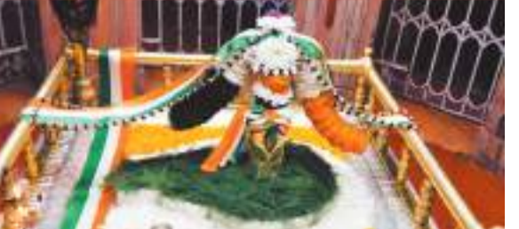
शिव भक्ति के साथ पहाड़ी मंदिर पर इस वर्ष भी देश भक्ति की ऐसी झलक मिली।