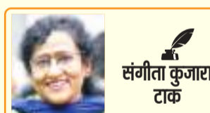
संगीता कुजारा टाक