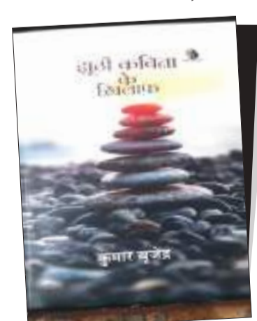
पुस्तक : शुद्धी कविता के खिलाफ मूल्य - 175 रूपए, पृष्ठ - 93 प्रकाशक : रश्मि प्रकाशन