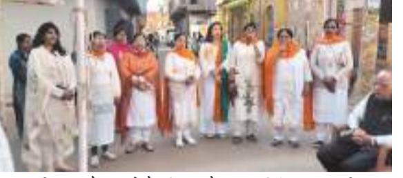
बहावलपुरी समाज के सदस्यों ने शनिवार को फहराया तिरंगा, गाया राष्ट्रीय गान