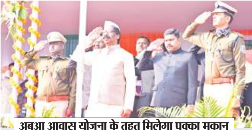
अबुआ आवास योजना के तहत मिलेगा पक्का मकान

मुख्यमंत्री हेमंत सोरेन ने कहा है कि जनभावना और जन-भागीदारी के साथ राज्य सरकार एक ऐसी व्यवस्था को आकार देने के लिए प्रयासरत है जहां गरीब, वंचित, मजदूर, किसान, आदिवासी, पिछड़े, दलित सबको उनका अधिकार मिल सके. मजबूत इरादे और बुलंद हौसले के साथ हमारी सरकार ने लाखों राज्यकर्मियों के लिए पुरानी पेंशन योजना शुरू की है. 35 लाख जरूरतमंद को पेंशन, 20 लाख अतिरिक्त लोगों को राशन और 57 लाख से अधिक लोगों को सरकार वर्ष में दो बार वस्त्र प्रदान कर रही है. झारखंड आंदोलनकारियों को पहचान कर उनके आश्रितों और परिवारों को पेंशन और सम्मान देने की मुहिम चलाई जा रही है. गरीब और वंचित वर्ग के युवा आज विदेशों में शिक्षा ले रहे हैं. योजनाओं की गठरी बना कर गांव-गांव और पंचायत-पंचायत लाखों जरूरतमंदों के द्वार तक सरकार पहुंची है. सीएम गणतंत्र दिवस के अवसर पर दुमका पुलिस लाइन में आयोजित समारोह में बोल रहे थे. इससे पहले उन्होंने ध्वजारोहण किया.