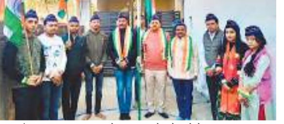
राष्ट्रीय सैनिक संस्था द्वारा इन्द्रपुरी रोड में 6 रातू रोड में झंडोत्तोलन किया गया।