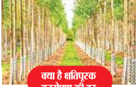
वया है क्षतिपूरक वनरोपण की दर

वन भूमि के अपयोजन का भी दर तय: वन विभाग ने वन भूमि के अपयोजन के लिए नेट प्रोजेक्ट वैल्यू भी तय कर दिया है. वगैरह कटेगरी में अतिघने जंगल को भूमि एक हेक्टेयर अपयोजन करने के लिए 1595790 रुपये देने होंगे. घना जंगल के लिए प्रति हेक्टेयर 1436670 रुपये देने होंगे. वहीं खुले जंगल में प्रति हेक्टेयर 1116900 रुपये देने होंगे. इसकी वगैरह कटेगरी में घना जंगल के लिए 1595790 रुपये प्रति हेक्टेयर के लिए देने होंगे. घने जंगल की भूमि के लिए 1456670 रुपये देने होंगे. वहीं खुले जंगल की जमीन के लिए 1116900 रुपये देने होंगे.