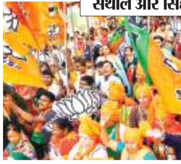
गंगा दिया. वहीं उसके बाद हुए विधानसभा चुनाव में कोल्हान को आदिवासी सुरक्षित 9 सीटों के साथ-साथ सभी 14 विधानसभा सीटों में

और सह संयोजक (42 पदाधिकारियों) के चयन में आदिवासी नेताओं को दरकिनार कर दिया गया. 14 में से एक भी प्रभारी और संयोजक आदिवासी नहीं हैं. वहीं 14 सह संयोजकों में से सिर्फ 3 ही आदिवासी चेहरे हैं. आदिवासी बहुल कोल्हान, संथाल प्रमंडल का प्रभार गैर आदिवासी नेताओं को 2019 के लोकसभा और विधानसभा चुनाव में भाजपा को मुख्य रूप से आदिवासी बहुल कोल्हान और संथाल परगना प्रमंडल में जोरदार झटका लगा था. 2019 में भाजपा ने कोल्हान के सिंहभूम लोकसभा (सिस्टिंग सीट) को