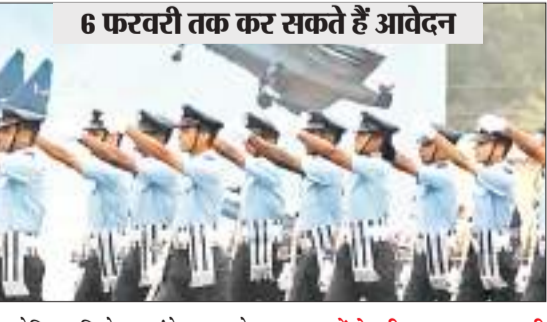
6 फरवरी तक कर सकते हैं आवेदन

ज्वॉइन इंडियन एयरफोर्स ने अग्निवीर एयर इटेक की विस्तृत अधिसूचना (नोटिफिकेशन) जारी कर दी है। इस वायु सेना भर्ती के लिए इच्छुक पुरुष व महिला उम्मीदवार 17 जनवरी को 11 बजे से रजिस्ट्रेशन करा सकते हैं। ऑनलाइन आवेदन भरने की अंतिम तिथि 6 फरवरी है। वहीं परीक्षा शुरू जमा करने की भी अंतिम तिथि 6 फरवरी है। परीक्षा 17 मार्च को आयोजित की जाएगी। इसकी जानकारी कमान अधिकारी विंग कमांडर ए प्रदीप रेड्डी ने दी है। 12 से 23 जनवरी तक जागरूकता और प्रेरणा सत्र का आयोजन : स्कूलों और कॉलेजों के लिए 12 से 23 जनवरी तक जागरूकता और प्रेरणा सत्र