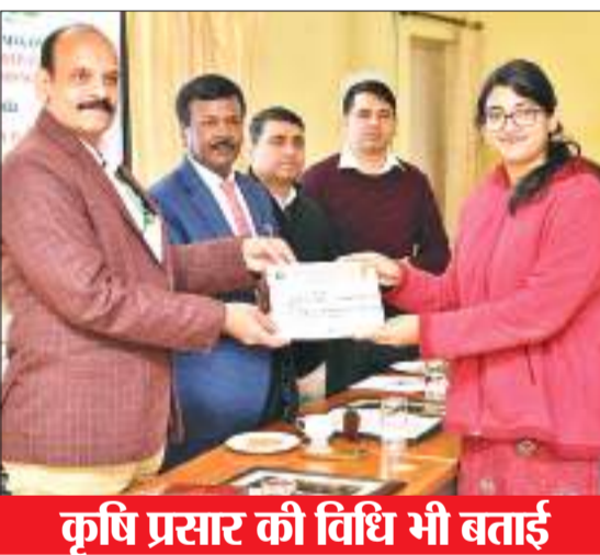
कृषि प्रसार की विधि भी बताई