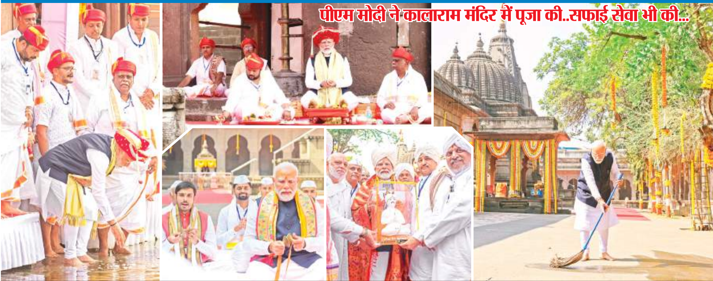
पीएम मोदी ने कालाराम मंदिर में पूजा की..सफाई सेवा भी की..