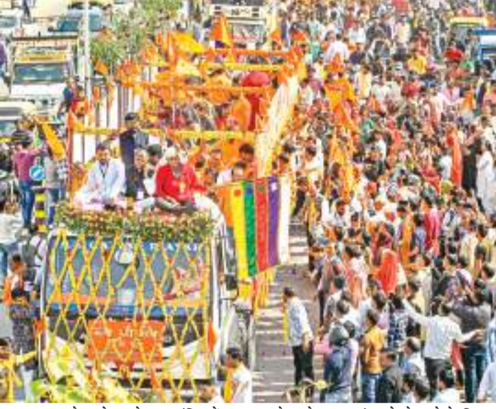
अहमदाबाद से अयोध्या के राम मंदिर में लाए जाने वाले ध्वज स्तंभ को ले जाने के लिए निकाले गए जुलूस में सैकड़ों श्रद्धालुओं ने लिया हिस्सा।