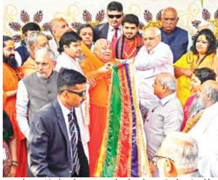
गुजरात के मुख्यमंत्री भूपेंद्र पटेल अहमदाबाद में अयोध्या के राम मंदिर में स्थापित होने वाले ध्वज स्तंभ को ले जाने के लिए निकाले गए जुलूस को हरी झंडी दिखायी।