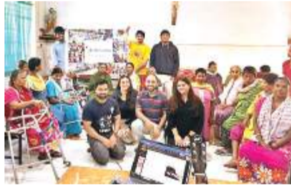
एक्सएलआरआई की सिग्मा-ओइकोस के पुरस्कृत छात्र-छात्राएं।

एक्सएलआरआई की सिग्मा-ओइकोस को अंतरराष्ट्रीय स्तर पर प्रतिष्ठित कम्यूनिटी इंपैक्ट अवार्ड से नवाजा गया है। ओइकोस इंटरनेशनल की ओर से आयोजित इस प्रतियोगिता में एक्सएलआरआई की सिग्मा-ओइकोस को एजुकेशन आउटरीज प्रोग्राम के लिए यह पुरस्कार दिया गया है। इसमें 20 देशों के 40 अलग-अलग प्रोजेक्ट को शामिल किया गया था। ओइकोस इंटरनेशनल द्वारा नाटिंगम, बार्सिलोना, लिस्बन, पेरिस और लंदन जैसे प्रमुख शहरों में वैश्विक नेटवर्क को बढ़ावा के लिए अंतरराष्ट्रीय परिषद प्रदान करता है। समाज में स्थायी सकारात्मक बदलाव लाने की दिशा में बेहतर कार्य करने के लिए यह पुरस्कार दिया गया है। उल्लेखनीय है कि एक्सएलआरआई की ओर से वर्ष