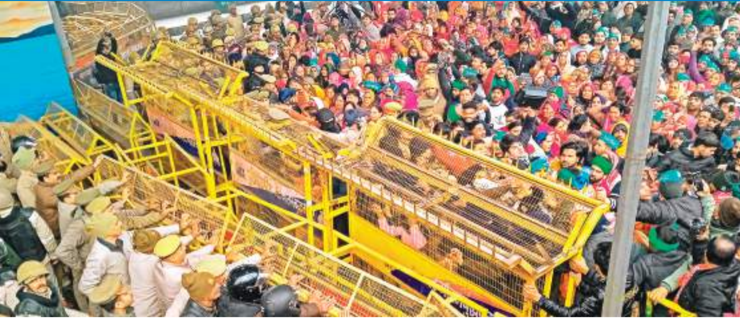
नोएडा : किसानों ने शुक्रवार को नोएडा में एनटीपीसी कार्यालय के पास अपने विरोध प्रदर्शन के दौरान पुलिस बैरिकेड्स को पार करने का प्रयास किया।