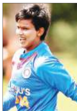
स्मृति मंधाना चौथे, जेमिमा रॉड्रिग्स 13वें, शेफाली वर्मा 16वें और हरमनप्रीत कौर 17वें स्थान पर है। ऑस्ट्रेलिया की बेथ मूनी शीर्ष पर हैं जबकि उनकी हमवतन ताहलिया मैकग्रा दूसरे स्थान पर हैं।

भारत की दीपति शर्मा एक पायदान चढ़कर आईसीसी महिला टी20 गेंदबाजी रैंकिंग में मंगलवार को संयुक्त दूसरे स्थान पर पहुंच गईं, जबकि उनकी हमवतन रेणुका सिंह भी दसवें स्थान पर पहुंच गई हैं। दक्षिण अफ्रीका की स्पिनर नोंकुलुलेको एमलाबा तीन पायदान गिरकर दूसरे से पांचवें स्थान पर खिसक गईं। दीपति के साथ पाकिस्तान की सादिया इकबाल दूसरे स्थान पर है जबकि इंग्लैंड की सारा रलेन चौथे स्थान पर है। इंग्लैंड की स्पिनर सोफी एक्सलेटन शीर्ष पर बनी हुई हैं। हरफनमौलाओं को सूची में शीर्ष दस में कोई बदलाव नहीं है। इसमें दीपति चौथे स्थान पर बनी हुई हैं। बल्लेबाजों में भारतीय उपकप्तान