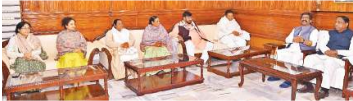
शुभम संदेश टीम। रांची

सियासी हलचल के बीच मंगलवार की रात कांके रोड स्थित सीएम आवास में हेमंत सोरेन की अध्यक्षता में सत्ता पक्ष के विधायकों की बैठक हुई। दो घंटे तक चली बैठक में वर्तमान राजनीतिक हालात पर चर्चा हुई और आगे की रणनीति पर मंथन किया गया। हालांकि बैठक में क्या निर्णय लिये गये यह स्पष्ट रूप से बाहर नहीं आ पाया है। दोपहर एक बजे ईडी की टीम के सीएम आवास पहुंचने से पहले पहले बुधवार को दिन के साढ़े 11 बजे से सत्ता पक्ष के विधायकों की फिर बैठक होगी। बैठक के बाद भी एकजुटता प्रदर्शित करने के लिए मंत्री व विधायक सीएम आवास में ही मौजूद रहेंगे। इससे पूर्व मंगलवार दोपहर सीएम ने सत्ता पक्ष के विधायकों के साथ बैठक की थी। बैठक के बाद सभी एकसाथ मोरहावादी स्थित बापू वाटिका में महात्मा गांधी को श्रद्धांजलि अर्पित करने पहुंचे थे। शाम को दोबारा हुई बैठक में सत्ता पक्ष के दो-तीन