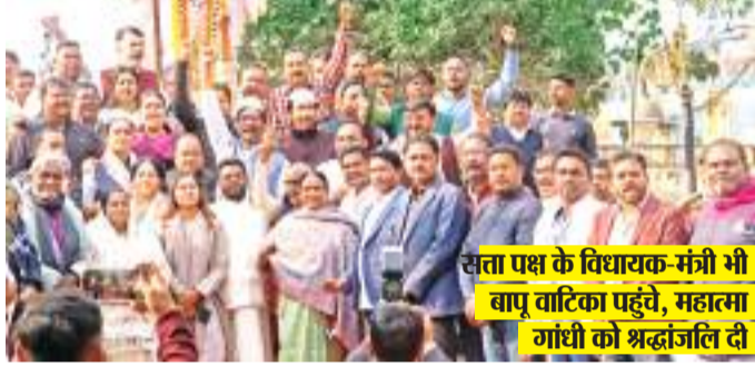
सत्ता पक्ष के विधायक-संगी भी बापू वाटिका पहुंचे, महात्मा गांधी को श्रद्धांजलि दी

रांची। सीएम हाउस में बैठक करने के बाद सीएम हेमंत सोरेन रांची के मोरहाबादी स्थित बापू वाटिका पहुंचे और महात्मा गांधी की 76वीं पुण्यतिथि पर नमन किया. इस दौरान झारखंड कांग्रेस के प्रभारी गुलाम अहमद मीर भी नजर आए. मीडिया की ओर से सीएम से सवाल पूछा गया कि आप कहाँ थे. इसके जवाब में सीएम ने कहा कि हम आ गये हैं तो इसमें क्या तकलीफ है. भाजपा की ओर से थाने में गुमशुदगी का मामला दर्ज कराया जाने के सवाल पर उन्होंने कहा कि यह क्या सवाल है.