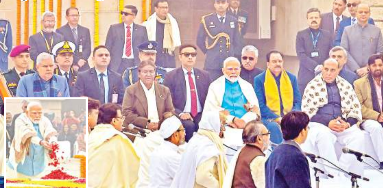
राष्ट्रपति द्रौपदी मुर्मू, उपराष्ट्रपति जगदीप धनखड़, पीएम नरेंद्र मोदी, केंद्रीय रक्षा मंत्री राजनाथ सिंह और अन्य लोगों ने नई दिल्ली के राजघाट में महात्मा गांधी को श्रद्धांजलि अर्पित की.