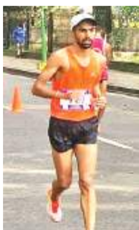
किया। उन्होंने एक घंटे 19 मिनट 43 सेकंड का समय निकाला। वह पेरिस

पेरिस ओलंपिक के लिए पहले ही क्वालीफाई कर चुके पंजाब के अक्षदीप सिंह ने राष्ट्रीय ओपन पैदल चाल स्पर्धा में मंगलवार को पुरुषों के 20 किलोमीटर वर्ग में अपना ही राष्ट्रीय रिकॉर्ड तोड़ा। रांची में राष्ट्रीय ओपन पैदल चाल स्पर्धा 2023 जीतकर ओलंपिक के लिए क्वालीफाई करने वाले अक्षदीप ने एक घंटे 19 मिनट 38 सेकंड का समय निकालकर एक घंटे 19 मिनट 55 सेकंड का अपना ही रिकॉर्ड तोड़ा। उत्तराखंड के सूरज पंवार दूसरे स्थान पर रहे, जिन्होंने पेरिस ओलंपिक का एक घंटे 20 मिनट 10 सेकंड का क्वालीफाईंग मार्क पार