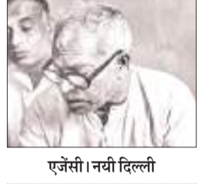
एजेंसी। नयी दिल्ली

बिहार के पूर्व सीएम और समाजवादी नेता कर्पूरी ठाकुर को मरणोपरांत भारत रत्न से नवाजा जाएगा. राष्ट्रपति भवन में मंगलवार को यह घोषणा की. 'जननायक' के रूप में मशहूर ठाकुर दिसंबर 1970 से जून 1971 तक और दिसंबर 1977 से अप्रैल 79 तक बिहार के सीएम रहे. उनका 17 फरवरी, 1988 को निधन हुआ था. केंद्र सरकार ने कर्पूरी ठाकुर की 100वीं जयंती से एक दिन पहले यह सम्मान देने का एलान किया है. कर्पूरी पिछड़े वर्गों के हितों की वकालत करने के लिए जाने जाते थे. आम तौर पर केंद्र सरकार गणतंत्र दिवस की पूर्व संंध्या पर पच पुरस्कारों और भारत रत्न का एलान