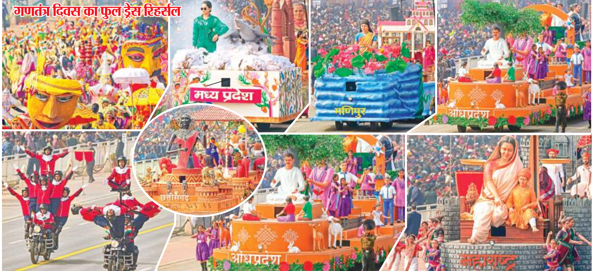
मंगलवार को गणतंत्र दिवस समारोह की तैयारी को लेकर फुल एंड फाइनल ड्रेस रिहर्सल किया गया. इसमें विभिन्न राज्यों व केंद्र शासित प्रदेशों की झांकियां भी निकलीं. समारोह में मुख्य अतिथि के रूप में फ्रांस के राष्ट्रपति मौजूद रहेंगे. इस बार महिला सशक्तीकरण पर विशेष जोर रहेगा.