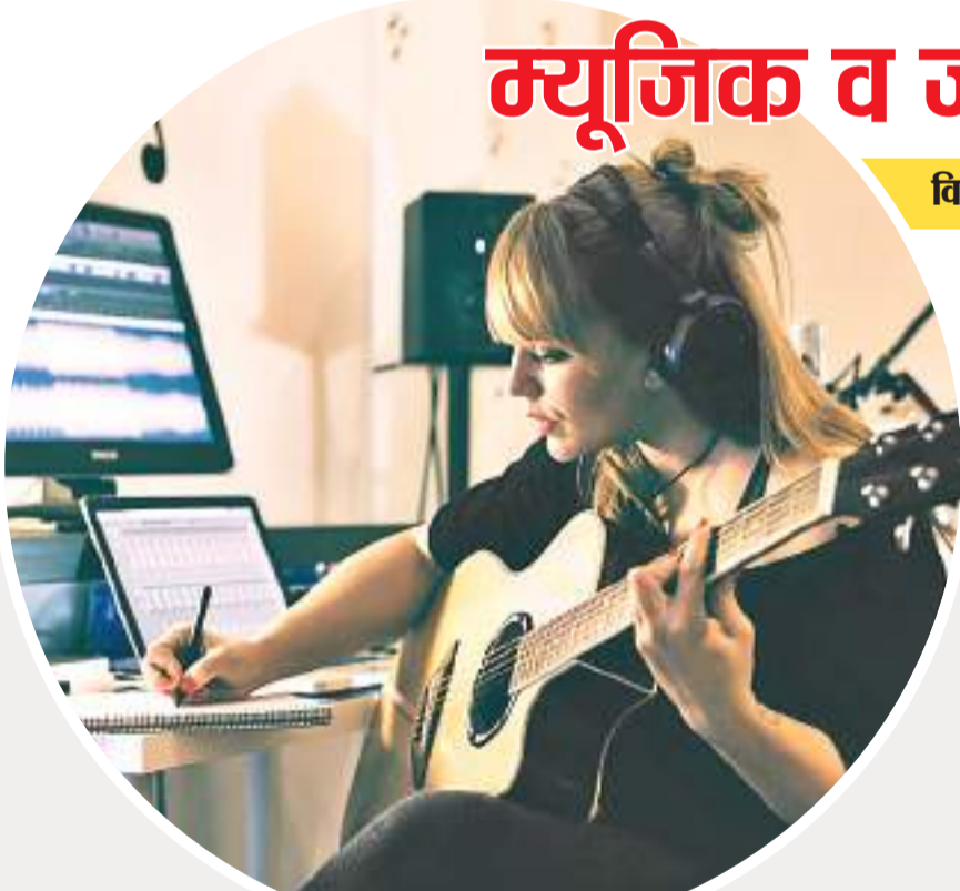
म्यूजिक में एमए

म्यूजिक में एमए दो साल की मास्टर डिग्री कोर्स है. जो संगीत की पढ़ाई से संबंधित है. यह कोर्स संगीत के थ्योरेटिकल और प्रैक्टिकल दोनों पहलुओं को प्रदान करता है. छात्र संगीत की जड़ों की खोज करना सीखते हैं और उन्हें संगीत अभ्यास के कई रूपों के अवसर प्रदान किए जाते हैं. छात्र वोकल और इंस्ट्रुमेंटल कोर्स के बीच चयन कर सकते हैं.