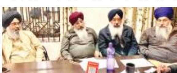
बैठक करते सेंट्रल गुजरात प्रबंधक कमेट्री के सदस्य.