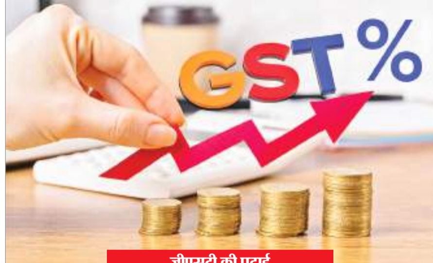
जीएसटी की पढ़ाई

जीएसटी एक प्रकार का इनडायरेक्ट टैक्स है, जिसे भारत में 1 जुलाई 2017 को लागू किया गया था. जीएसटी का फुल फॉर्म गुड्स एंड सर्विस टैक्स है. जिसका हिंदी में अर्थ 'वस्तु और सेवा कर' होता है. वस्तु और सेवा कर अधिनियम एक्ट द्वारा 29 मार्च 2017 को पारित किया गया, उसके बाद से अब तक जीएसटी ही भारत में चल रही है. यहां गुड्स एंड सर्विसेज (जीएसटी) के बारे में कुछ महत्वपूर्ण जानकारी को संक्षिप्त में बताया जा रहा है, जिन्हें आप नीचे दिए गए बिंदुओं में देख सकते हैं-