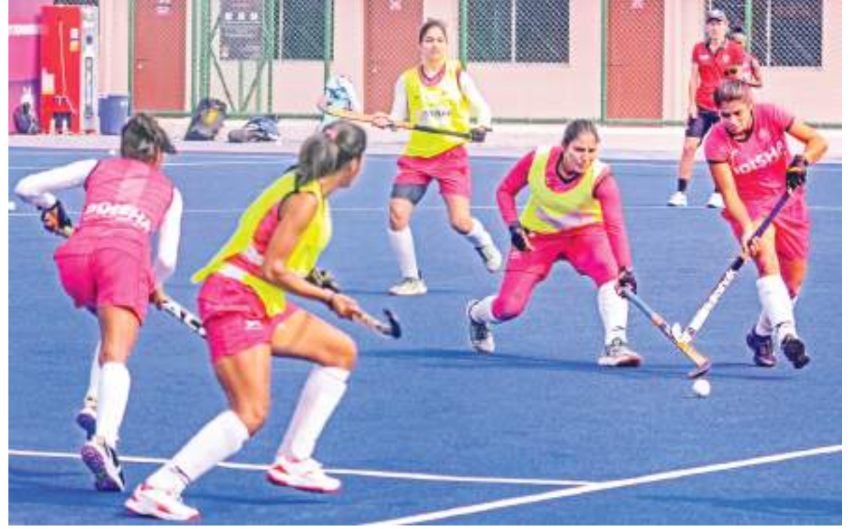
एफआईएच महिला हाँकी ओलंपिक क्वालीफायर टूर्नामेंट को लेकर रांची में गुरुवार को अभ्यास करती भारतीय टीम। गुरुवार को कई देशों की टीम रांची पहुंची।