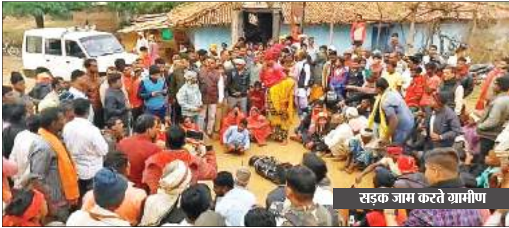
सड़क जाम करते ग्रामीण