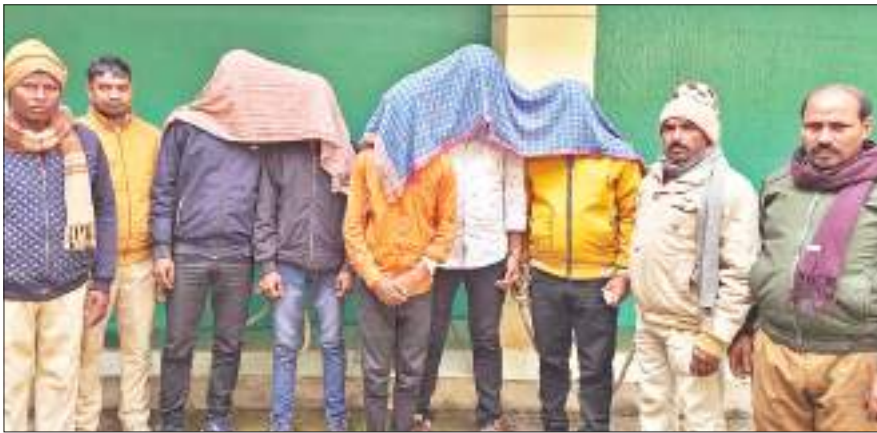
गिरफ्तार आरोपियों के साथ पुलिस जवान।

सैलानियों को सुरक्षित माहौल देने के लिए खंडोली पर्यटन स्थल पर पुलिस चौकी बनाई गई है। पर्यटन स्थल पर पहाड़ी की तरफ कुछ युवक हुड़दंग कर रहे थे। सभी नशे थे और उधर से आने-जाने वालों पर भेदी फन्कितियां कस रहे थे। सूचना मिलते