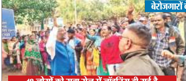
18 लोगों को गुवा सेल में जाँड़निंग दी गई है