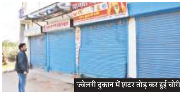
ज्वेलरी दुकान में शटर तोड़ कर हुई चोरी