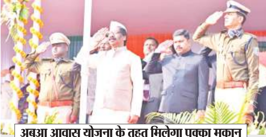
अबुआ आवास योजना के तहत मिलेगा पक्का मकान

मुख्यमंत्री हेमंत सोरेन ने कहा है कि जनभावना और जन-भागीदारी के साथ राज्य सरकार एक ऐसी व्यवस्था को आकार देने के लिए प्रयासरत है जहां गरीब, वंचित, मजदूर, किसान, आदिवासी, पिछड़े, दलित सबको उनका अधिकार मिल सके. मजबूत इरादे और बुलंद हौसले के साथ हमारी सरकार ने लाखों राज्यकर्मियों के लिए पुरानी पेंशन योजना शुरू की है. 35 लाख जरूरतमंद को पेंशन, 20 लाख अतिरिक्त लोगों को राशन और 57 लाख से अधिक लोगों को सरकार वर्ष में दो बार वस्त्र प्रदान कर रही है. झारखंड आंदोलनकारियों को पहचान कर उनके आश्रितों और परिवारों को पेंशन और सम्मान देने की मुहिम चलाई जा रही है. गरीब और वंचित वर्ग के युवा आज विदेशों में शिक्षा ले रहे हैं. योजनाओं की गठरी बना कर गांव-गांव और पंचायत-पंचायत लाखों जरूरतमंदों के द्वार तक सरकार पहुंची है. सीएम गणतंत्र दिवस के अवसर पर दुमका पुलिस लाइन में आयोजित समारोह में बोल रहे थे. इससे पहले उन्होंने ध्वजारोहण किया.