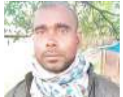
पकड़ा गया संदिग्ध युवक.