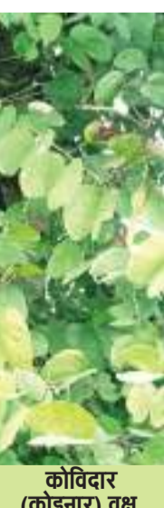
कोविदार (कोइनार) वृक्ष

के कारण ही इसे अयोध्या साम्राज्य के ध्वज पर स्थान दिया गया होगा। आज की संसार में आज तक इसका छाल का व्यापार चोर रास्ते से ही होता है और यह पौधा विलुप्त होने के कगार पर है। वन मंत्रालय कंचनार वृक्ष और कोविदार (कोइनार) वृक्ष के संरक्षण और संवर्धन पर काम ही नहीं किया है। वर्तमान में कंचनारगुगुल काफी लोकप्रिय औषधि है। 3. कोविदार (कोइनार) वृक्ष के संरक्षण और संवर्धन पर काम ही नहीं किया है। वर्तमान में कंचनारगुगुल काफी लोकप्रिय औषधि है। 4. कोविदार (कोइनार) वृक्ष के संरक्षण और संवर्धन पर काम ही नहीं किया है। वर्तमान में कंचनारगुगुल काफी लोकप्रिय औषधि है।