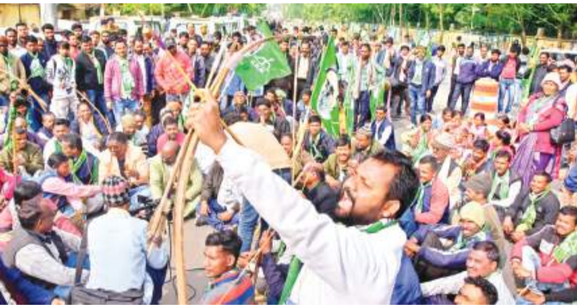
शनिवार को दिनभर सीएम आवास से थोड़ी दूरी पर झामुमो के सैकड़ों कार्यकर्ता अपने नेता के समर्थन में नारेबाजी करते रहे।

अंदर सीएम कर रहे थे ईडी का सामना, बाहर सड़क पर थे कार्यकर्ता