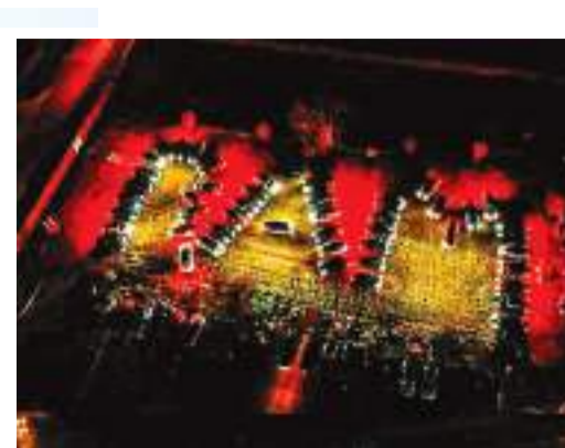
ह्यूस्टन । प्राण प्रतिष्ठा समारोह से पहले ह्यूस्टन में हिंदू भक्तों ने टेक्सा कार लाइट शो के जरिए श्री के प्रति आस्था दिखायी।