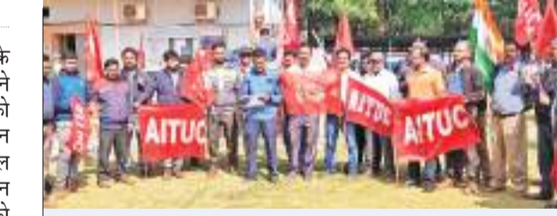
बकाया भुगतान संबंधी मामलों का निपटारा करें

सेल की किरीबुरु खदान के सेलकर्मियों का अलग यूनियन ने संयुक्त मोर्चा (बीएचएस को छोड़कर) के बैनर तले विभिन्न मांगों को लेकर किरीबुरु जेनरल आफिस प्रांगण में धरना-प्रदर्शन किया एवं 29 एवं 30 जनवरी को दो दिवसीय हड़ताल की नोटिस किरीबुरु के सीजीएम को दिया। संयुक्त मोर्चा के मजदूर नेताओं ने बताया की 29 और 30 जनवरी को सेल एवं आरआईएनएल में प्रस्तावित दो दिवसीय आम हड़ताल विभिन्न मांगों के लिये किया जायेगा।