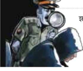
संवाददाता | रांची

झारखंड पुलिस की अपराध अनुसंधान विभाग (सीआईडी) ने साइबर फ्रॉड के खिलाफ कार्रवाई में नयी सफलता हासिल की है. सीआईडी ने राज्य के बैंकों में खुले करीब 8000 बैंक खातों का डाटा तैयार कर लिया है. जिसमें साइबर फ्रॉड के पैसे ट्रांसफर किये गये. इस डाटा के हासिल होने के बाद सीआईडी ने खाताधारकों की पहचान शुरू कर दी है. साथ ही 12 जनवरी को बैंकों के अधिकारियों के साथ हुई बैठक में डाटा उपलब्ध करा दिया गया है. ताकि खाताधारकों की पहचान में तेजी लायी जा सके. सीआईडी के पास जो डाटा है, उसके मुताबिक 8674 में से 2002 बैंक एकाउंट्स सिर्फ देवघर जिले में हैं. 20 प्रतिशत बैंक एकाउंट्स स्टेट बैंक ऑफ इंडिया के विभिन्न शाखाओं में हैं.