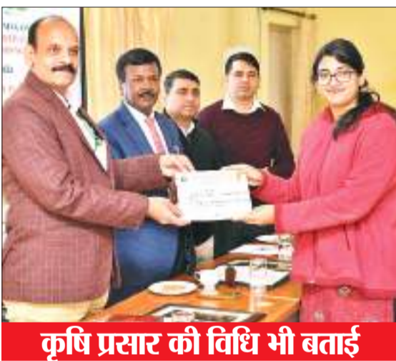
कृषि प्रसार की विधि भी बताई