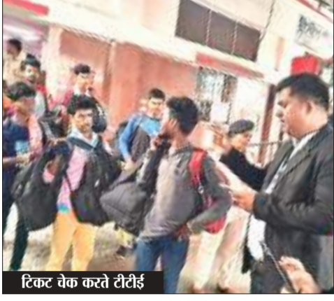
टिकट चेक करते टीटीई

यह नजारा सिर्फ धनबाद स्टेशन पर ही नहीं बल्कि गोमो, पारसनाथ, कोडरमा, चंद्रपुरा, बरकाकाना, पतरात व डालनगंज समेत अन्य स्टेशनों पर भी देखने को मिलता है। मध्यम व गरीब तबके के यात्रियों से जबरन वसूली करते कभी भी सुबह से दोपहर तक देखा जा सकता है।