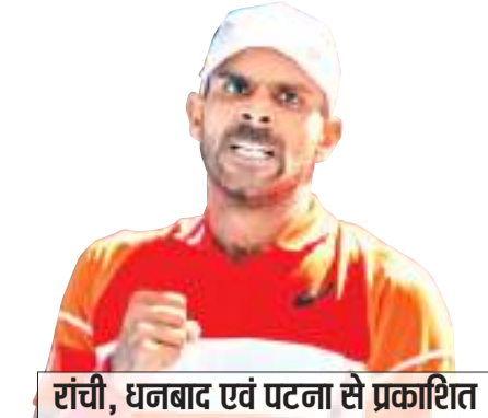
रांची, धनबाद एवं पटना से प्रकाशित