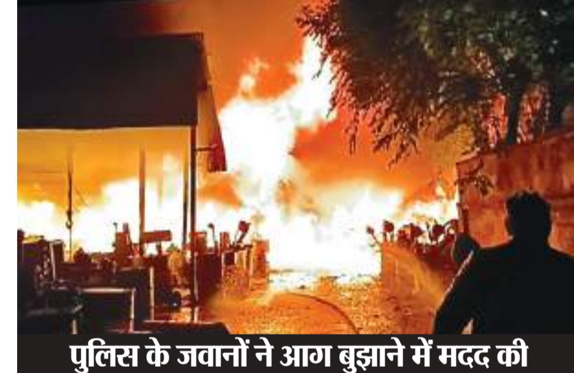
पुलिस के जवानों ने आग बुझाने में मदद की