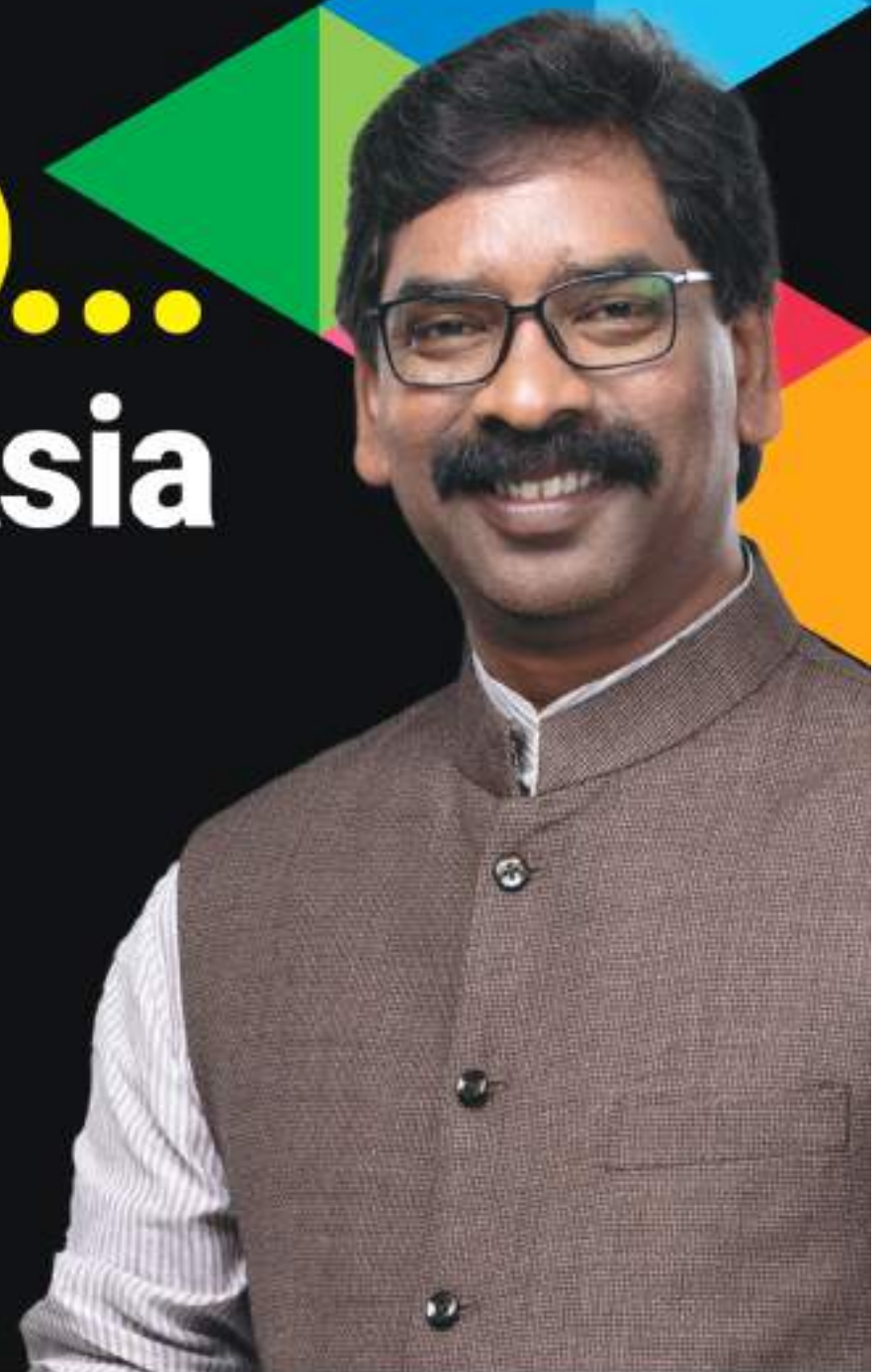
HEMANT SOREN Chief Minister, Jharkhand

JHARKHAND... After Conquering Asia Now Ready to Embrace the World