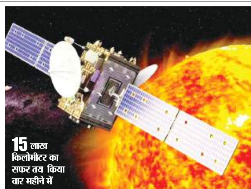
15 लाख किलोमीटर का सफर तय किया चार महीने में