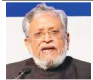
सुशील मोदी ने कहा कि हमें राम और रोटी दोनों चाहिए

डिप्टी सीएम तेजस्वी यादव के चोट लगने पर कोई मंदिर नहीं, अस्पताल जाता है वाले बयान पर बीजेपी सांसद सुशील मोदी ने हिंदुओं की आस्था को जानबूझकर आहत करने वाला बताया है। कहा कि राजद के संस्कार सनातन धर्म विरोधी है। इसलिए हर दिन पार्टी का कोई ना कोई नेता राम मंदिर के खिलाफ जहर उगलता रहता है। सुशील मोदी ने तेजस्वी यादव को खुली चुनौती भी दी है। उन्होंने कहा कि अगर उनमें और उनकी पार्टी के नेताओं में दम है तो वे बिहार के सारे मंदिर-मस्जिद को तोड़कर अस्पताल बनवाये। मोदी ने कहा अगर लोगों को चिकित्सा के लिए अस्पताल चाहिये, तो मानसिक शांति के लिए मंदिर भी चाहिए। लोगों को दवा और दुआ दोनों की जरूरत पड़ती है। कहा कि अगर आपको इतना चिंता है तो आप बतायें कि पिछले डेढ़ साल में बिहार में कितने नये अस्पताल बनवाये। आलम ऐसा है कि तेजस्वी के स्वास्थ्य मंत्री रहते बिहार में एक भी नये अस्पताल नहीं बने हैं।