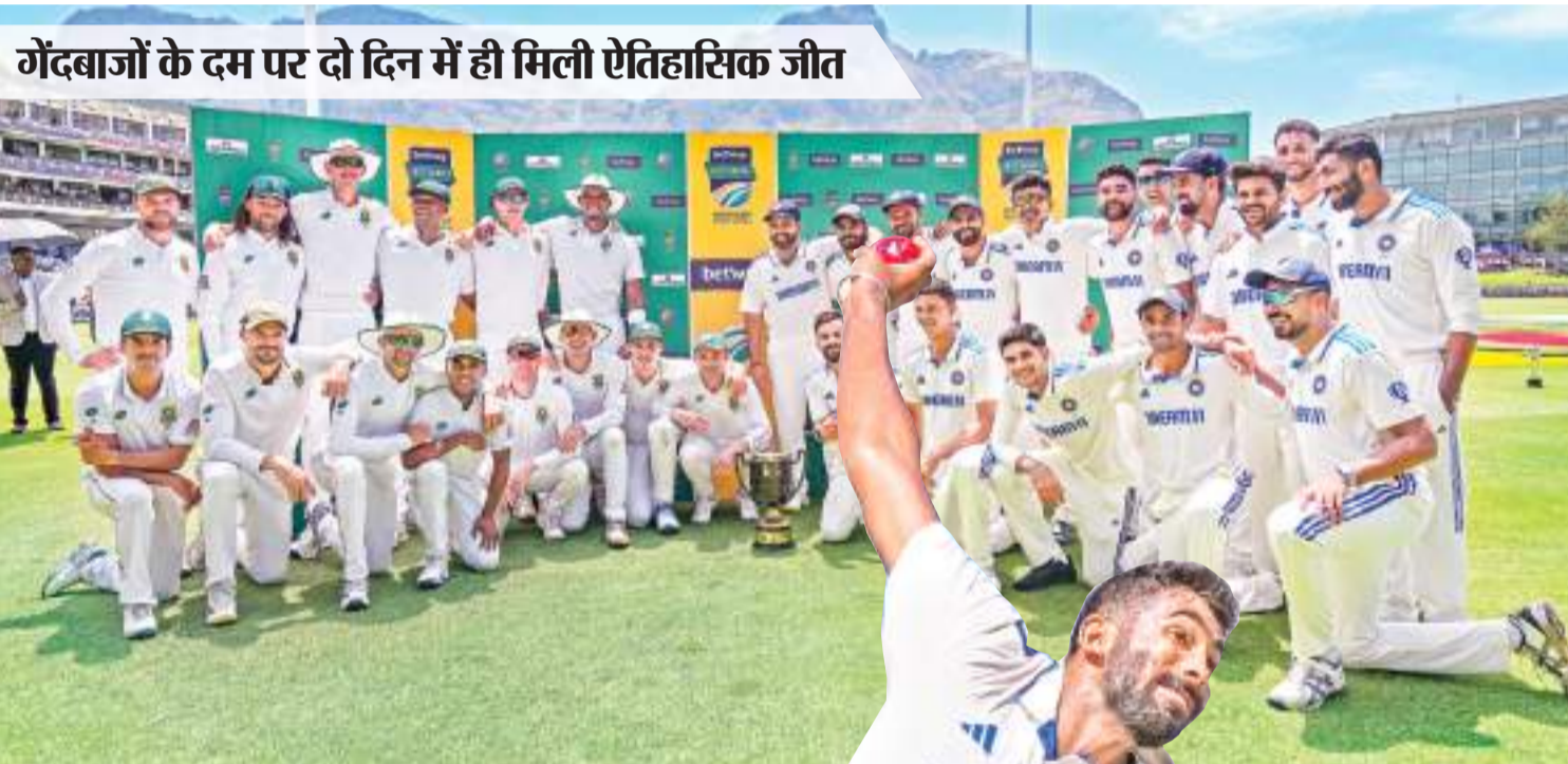
गेंदबाजों के दम पर दो दिन में ही मिली ऐतिहासिक जीत