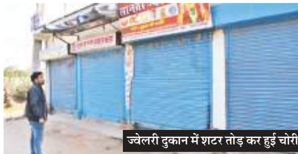
ज्वेलरी दुकान में शटर तोड़ कर हुई चोरी