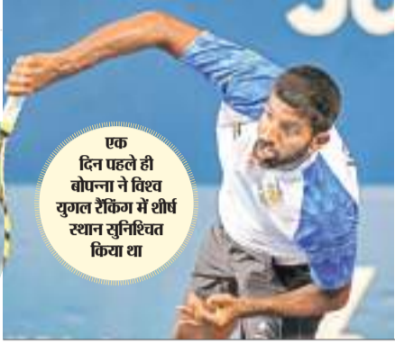
एक दिन पहले ही बोपन्ना ने विश्व युगल रैंकिंग में शीर्ष स्थान सुनिश्चित किया था

भाषा।मेलबर्न रोहन बोपन्ना पहला ग्रैंडस्लैम खिताब अपने नाम करने से अब बस एक जीत दूर है जिन्होंने ऑस्ट्रेलिया के मैथ्यू एबडेन के साथ यहां ऑस्ट्रेलियाई ओपन पुरुष युगल फाइनल में प्रवेश कर लिया। दूसरी वरीयता प्राप्त बोपन्ना और एबडेन की जोड़ी ने थॉमस माचाक और झांग झिंजेन की जोड़ी को गुरुवार को तनावपूर्ण सेमीफाइनल में 6-3, 3-6, 7-6 (10-7) से हराया। करीब दो घंटे तक चले मैच में सुपर टाइ ब्रेकर्स में उनका अनुभव काम आया। झांग