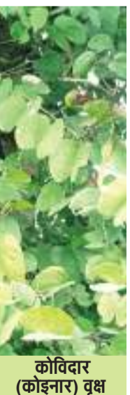
कोविदार (कोइनार) वृक्ष

के कारण ही इसे अयोध्या साम्राज्य के ध्वज पर स्थान दिया गया होगा। आजवादी से आज तक इसका छाल का व्यापार चोर रास्ते से ही होता है और यह पौधा विलुप्त होने के कगार पर है। वन मंत्रालय कंचनार वृक्ष और कोविदार (कोइनार) वृक्ष के संरक्षण और संवर्धन पर काम ही नहीं किया है। वर्तमान में कंचनारगुगुल काफी लोकप्रिय औषधि है।