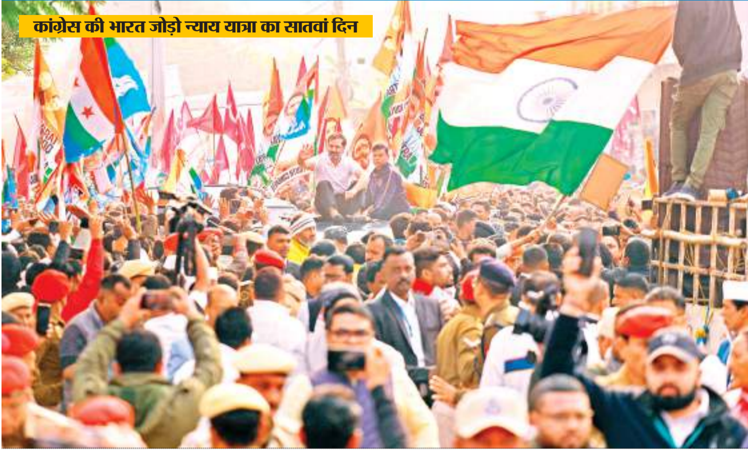
कांग्रेस की भारत जोड़ो न्याय यात्रा का सातवां दिन