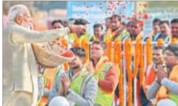
पीएम ने 'जटायु' की मूर्ति का अनावरण किया

प्रधानमंत्री ने कहा कि राम मंदिर के भूमिपूजन के बाद से प्रतिदिन पूरे देश में उमंग और उत्साह बढ़ता जा रहा था और निर्माण कार्य देख देशवासियों में हर दिन एक नया विश्वास पैदा हो रहा था. आज हमें सदियों के उस धैर्य की धरोहर मिली है. आज हमें श्रीराम का मंदिर मिला है. पूरा देश दीवाली मना रहा है.