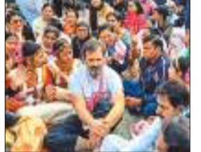
राहुल धरने पर बैठ गए. राहुल गांधी ने असम के नगांव स्थित मंदिर में जाने से रोके जाने पर नाराजगी जाहिर करते हुए अधिकारियों से पूछा कि 'क्या अब यह प्रधानमंत्री मोदी तय करेंगे कि मंदिर में कौन जाएगा. हम कोई समस्या पैदा नहीं करना चाहते.

कांग्रेस नेता राहुल गांधी की भारत जोड़ो न्याय यात्रा असम में विवादों में घिर गयी है. राहुल गांधी ने आर्योप लगाया है कि अधिकारियों द्वारा उन्हें असम के नगांव में श्री श्री शंकर देव सत्र मंदिर में जाने की अनुमति नहीं दी गयी. ऐसे में राहुल गांधी बोर्दोवा थान पर गए तो उन्हें बाहर ही रोका गया. क्योंकि वहां कि प्रबंधन समिति का कहना है कि राहुल गांधी अपराध तीन बजे के बाद ही वहां जाएं न कि अयोध्या राम मंदिर की प्राण प्रतिष्ठा समारोह के दौरान जाएं. इस बीच