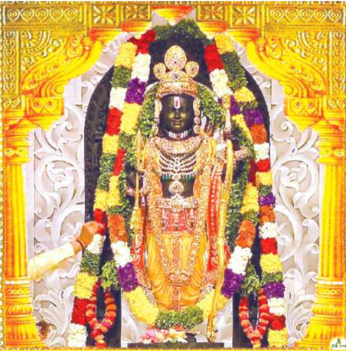
भगवान राम को रघुनन्दन, रमण, रामरज, रामकिशोरे, रामजी, रमित, रमेश, रामदेव, रामदास, रामचरण, रामचंद्रा, रामाया, रामानंद, रमोजी जैसे नाम से भी पुकारा जाता है।

ब्रह्मा जी के पुत्र दरीची, दरीची के पुत्र महर्षि कर्म कश्यप के वंश से जो सूर्यवंश हुआ उसी के इक्ष्वाकु कुल में श्री राम का जन्म हुआ। इन्हें रामचंद्र भी कहते हैं। रामायण के अनुसार, महाराज दशरथ और रानी कौशल्या के सबसे बड़े पुत्र, सीता के पति व लक्ष्मण, भरत तथा शत्रुघ्न के भ्राता थे। उन्होंने