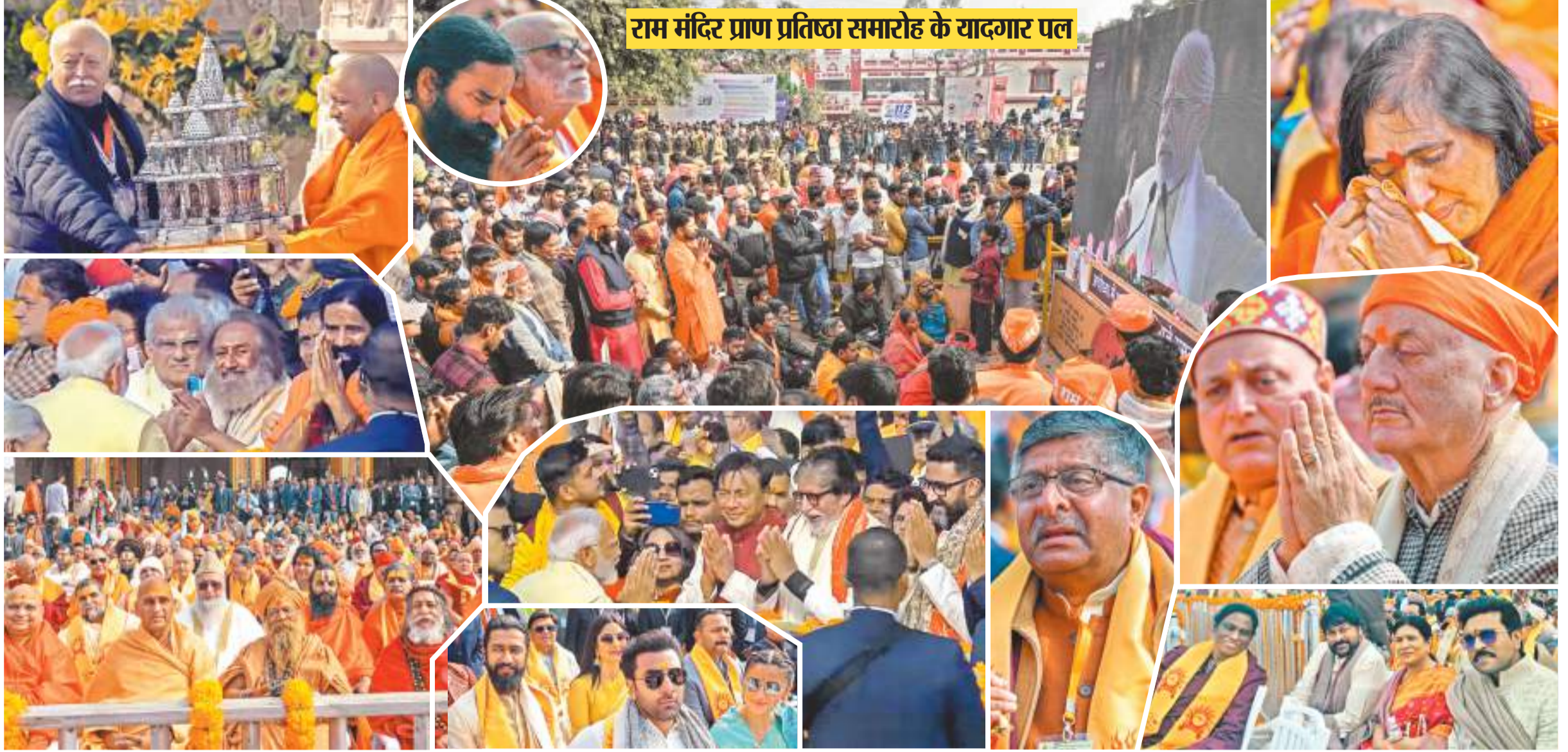
अयोध्या के श्रीराम मंदिर में रामलला के प्राण प्रतिष्ठा समारोह में सोमवार को देश भर से गणमान्य लोग, अभिनेता, साधु-संत और आम लोग पहुंचे. सभी समारोह के दौरान भक्तिमय माहौल में रमते नजर आए. सभी ने कई बार जयकारे लगाए. कई सेलिब्रिटी काफी भावुक भी नजर आए.