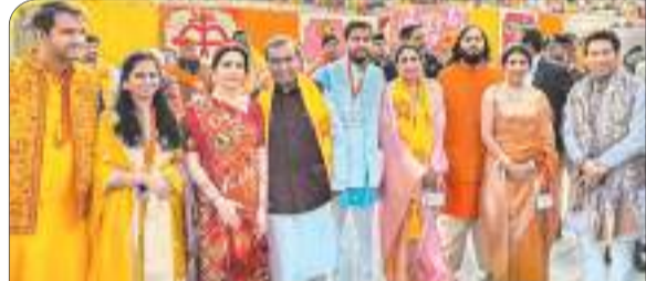
प्राण प्रतिष्ठा समारोह में पहुंचे सितारे

प्रतिष्ठा किए जाने के बाद उपस्थित जन समूह को संबोधित करते हुए कहा, श्री राम जन्मभूमि मंदिर की स्थापना भारत के सांस्कृतिक पुनर्जागरण का आध्यात्मिक अनुष्ठान है. यह राष्ट्र मंदिर है. नरेंद्र मोदी श्री राम लला के विग्रह की प्राण प्रतिष्ठा राष्ट्रीय गौरव का एक ऐतिहासिक अवसर है. निश्चित रहिए, प्रभु राम की कृपा से अब कोई अयोध्या की परिक्रमा में बाधा नहीं बन पाएगा.