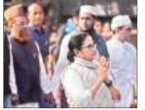
एवं पार्टी महासचिव अभिषेक बनर्जी भी थे. रैली शुरू करने से पहले, ममता ने दक्षिण कोलकाता में ऐतिहासिक कालीघाट मंदिर में पूजा-अर्चना के साथ अपने दिन की शुरुआत की. उसके बाद हाजरा मोड़ से सर्वधर्म सद्भाव रैली प्रारंभ हुई, जो पार्क सर्कस मैदान की ओर गयी.

अयोध्या के राम मंदिर में रामलला की प्राण प्रतिष्ठा समारोह के दिन सोमवार को पश्चिम बंगाल के मुख्यमंत्री ममता बनर्जी यहां मंदिर, मस्जिद, गिरजाघर और गुरुद्वारा जैसे विभिन्न धर्मों के उपासना स्थलों पर गयीं व सर्वधर्म रैली की अगुवाई करते हुए धार्मिक सद्भाव के लिए सांकेतिक यात्रा की. विभिन्न धर्मों के धार्मिक नेताओं और राज्य में सत्तारूढ़ टीएमसी के प्रमुख सदस्यों के साथ पार्टी सुप्रीमो ममता बनर्जी ने यहां हाजरा मोड़ से 'संगति मार्च' शुरू किया. उनके साथ उनके बतोजे