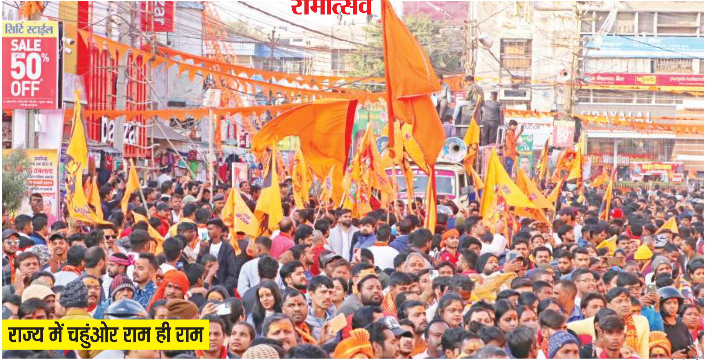
राज्य में चहुंओर राम ही राम