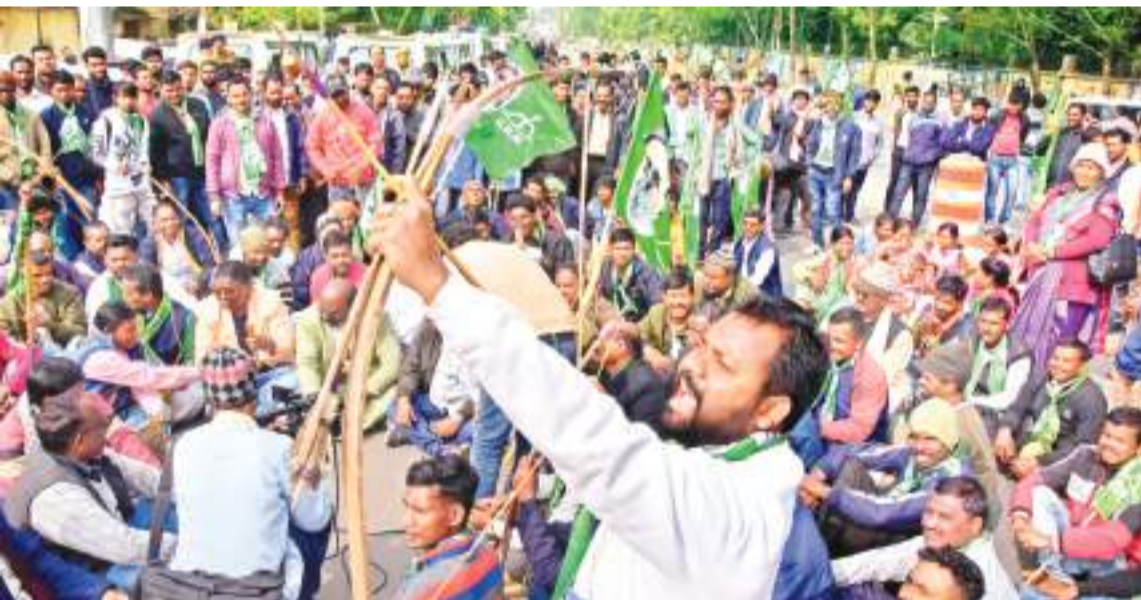
शनिवार को दिनभर सीएम आवास से थोड़ी दूरी पर झामुमो के सैकड़ों कार्यकर्ता अपने नेता के समर्थन में नारेबाजी करते रहे।

अंदर सीएम कर रहे थे ईडी का सामना, बाहर सड़क पर थे कार्यकर्ता