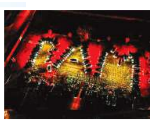
ह्यूस्टन । प्राण प्रतिष्ठा समारोह से पहले ह्यूस्टन में हिंदू भक्तों ने टेक्सा कार लाइट शो के जरिए श्री के प्रति आस्था दिखायी।