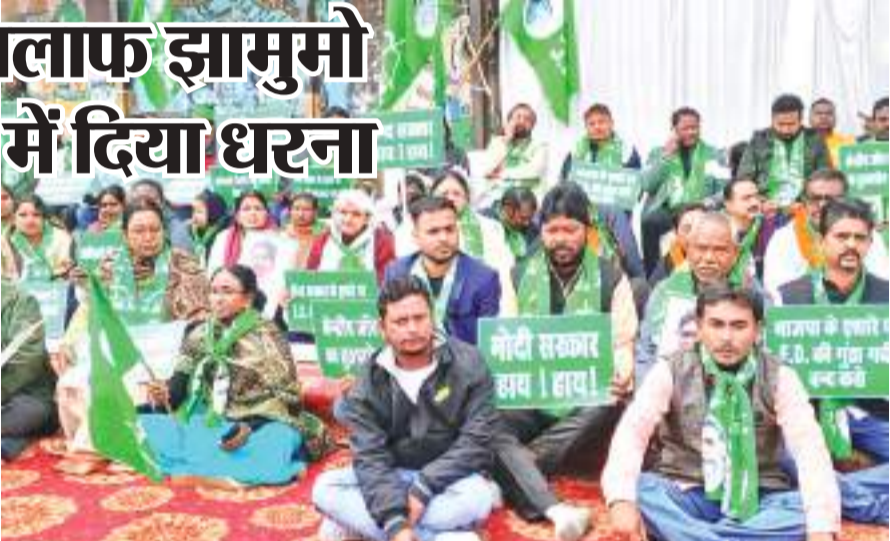
डाल दें, क्योंकि कानून सभी के लिए बराबर है. बार-बार समन भेजकर राज्य सरकार को काम नहीं करने दिया जा रहा है. एक आदिवासी मुख्यमंत्री जो राज्य के