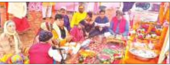
मंदिरों में धार्मिक कार्यक्रम का आयोजन किया जा रहा है। बाघमारा स्थित बड़ी ठाकुर बाड़ी मंदिर में भी व्यापक तैयारी की गई है। कार्यक्रम के तहत श्री बड़ी ठाकुरबाड़ी मंदिर में तीन दिवसीय भव्य महोत्सव का आयोजन किया गया है। आयोजन के प्रथम दिन शनिवार को प्रातः 9 बजे से वैदिक मंत्रोच्चार के साथ पूजन प्रारम्भ किया गया। इस मौके पर संगीतमय

बाघमारा स्थित बड़ी ठाकुरबाड़ी मंदिर आस्था के प्रतीक स्वरूप एक धार्मिक केंद्र के रूप में स्थापित हो चुका है। इस मंदिर में सालों भर पूजा पाठ के अतिरिक्त धार्मिक अनुष्ठान आयोजित होते रहे हैं। बाघमारा स्थित बड़ी ठाकुर बाड़ी मंदिर में भी व्यापक तैयारी की गई है। कार्यक्रम के तहत श्री बड़ी ठाकुरबाड़ी मंदिर में तीन दिवसीय भव्य महोत्सव का आयोजन किया गया है। आयोजन के प्रथम दिन शनिवार को प्रातः 9 बजे से वैदिक मंत्रोच्चार के साथ पूजन प्रारम्भ किया गया। इस मौके पर संगीतमय