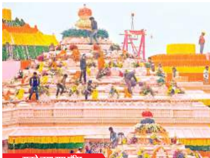
सजने लगा राम मंदिर