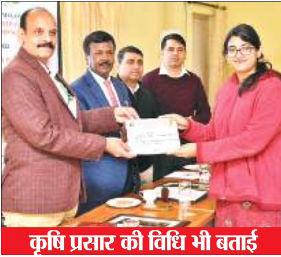
कृषि प्रसार की विधि भी बताई