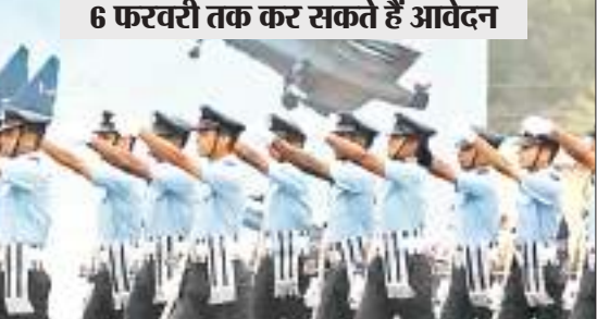
6 फरवरी तक कर सकते हैं आवेदन

ज्वॉइन इंडियन एयरफोर्स ने अग्निवीर एयर इंटैक की विस्तृत अधिसूचना (नोटिफिकेशन) जारी कर दी है। इस वायु सेना भर्ती के लिए इच्छुक पुरुष व महिला उम्मीदवार 17 जनवरी को 11 बजे से रजिस्ट्रेशन कर सकते हैं। ऑनलाइन आवेदन भरने की अंतिम तिथि 6 फरवरी है। वहीं परीक्षा शुल्क जमा करने की भी अंतिम तिथि 6 फरवरी है। परीक्षा 17 मार्च को आयोजित की जाएगी। इसकी जानकारी कमान अधिकारी विंग कमांडर ए प्रदीप रेड्डी ने दी है। 12 से 23 जनवरी तक जागरूकता और प्रेरणा सत्र का आयोजन : स्कूलों और कॉलेजों के लिए 12 से 23 जनवरी तक जागरूकता और प्रेरणा सत्र