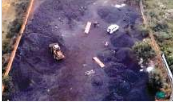
क्या था मामला