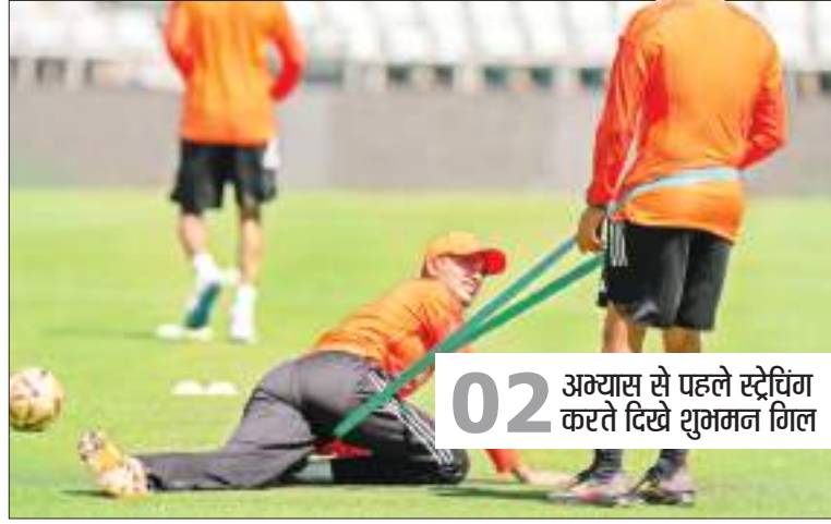
02 अभ्यास से पहले स्ट्रेचिंग करते दिखे शुभमन गिल