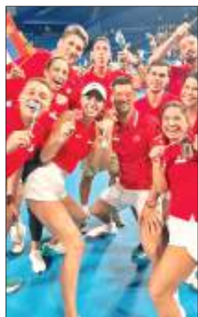
गणराज्य को 3-0 से हराया था लेकिन अब सर्बिया भी युएई से आगे बढ़ने की दौड़ में शामिल हो गया है।

नोवाक जोकोविच ने पर्थ में एक दशक के बाद पहला मैच खेलते हुए यूनाइटेड कप टेनिस टूर्नामेंट में सर्बिया को चीन पर 2-1 से जीत दिलाई। जोकोविच ने पर्थ में ऑस्ट्रेलिया के इस शहर में इससे पहले अपना अंतिम मैच 2013 में होपमैन कप में खेला था। जोकोविच ने एकल मैच में झांग झेंड्रेन को 6-3, 6-2 से हराया और फिर ओल्गा डेनिलोविच के साथ मिलकर निष्पत्तक मिश्रित युगल में झांग क्विनवेन और झांग के खिलाफ 6-4, 1-6, 10-6 से जीत दर्ज की। झांग ने इस बीच डेनिलोविच को 6-4, 6-2 से हराकर चीन को बराबरी दिलाई थी। चीन ने अपने पहले मुकाबले में चेक