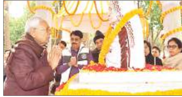
माल्यापण कर भावभीनी श्रद्धांजलि अर्पित की. मुख्यमंत्री के बड़े भाई