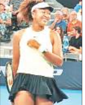
कहा कि पूरे मैच के दौरान मैं वास्तव में काफी नर्वस थी। मैं सभी दर्शकों का आभार व्यक्त करती हूँ जिन्होंने मेरा हौसला बढ़ाया। ओसाका अगले दौर में विश्व की पूर्व नंबर एक खिलाड़ी और ब्रिस्बेन इंटरनेशनल में तीन बार की चैंपियन कैरोलिना प्लिस्कॉवा से भिड़ेंगी।

विश्व की पूर्व नंबर एक खिलाड़ी नाओमी ओसाका ने मां बनने के बाद टेनिस कोर्ट पर सफल वापसी करते हुए सोमवार को यहां ब्रिस्बेन इंटरनेशनल टूर्नामेंट के पहले दौर में जीत दर्ज की। जर्मनी की तमारा कोरपात्स के खिलाफ ओसाका दूसरे सेट में 5-3 पर मैच के लिए सर्विस कर रही थी लेकिन उन्होंने अपनी सर्विस गंवा दी। यह सेट आखिर में टाईब्रेकर तक खिंच जिसमें ओसाका ने 6-3, 7-6 (9) ने जीत दर्ज करके अगले दौर में जगह बनाई। ऑस्ट्रेलियाई ओपन और अमेरिकी ओपन की पूर्व विजेता ओसाका गर्भवती होने के कारण पिछले साल ऑस्ट्रेलियाई ओपन से हट गई थी। जुलाई में उन्होंने ब्रिटिया को जन्म दिया था। ओसाका ने मैच के बाद