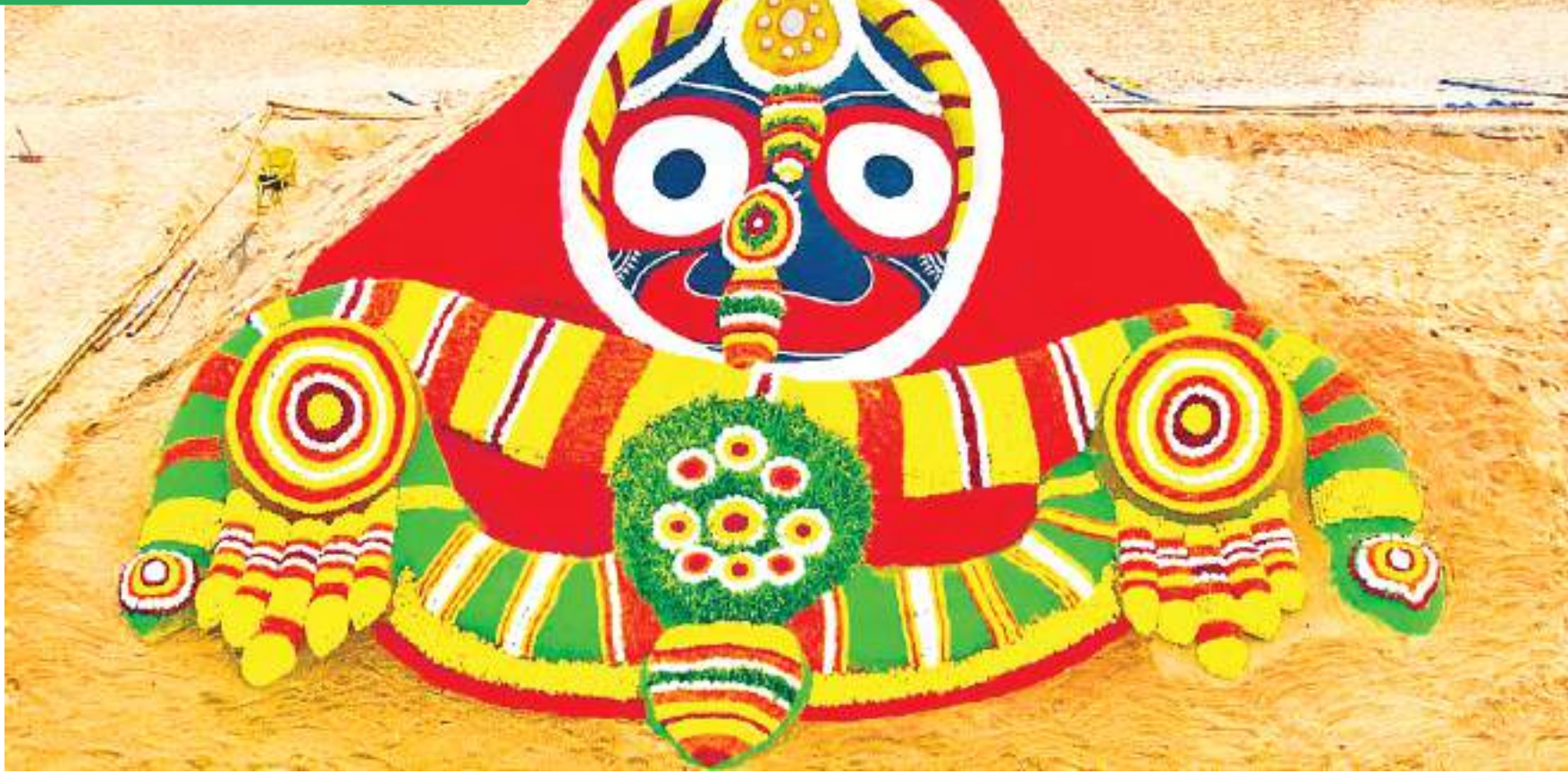
अंतरराष्ट्रीय रेत कलाकार पद्मश्री सुदर्शन पटनायक ने पुरी समुद्र तट पर रेत से श्रीजगन्नाथ महाप्रभु की 25 फीट ऊंची प्रतिमा बनाई है।