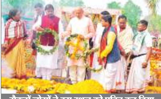
सैकड़ों लोगों ने इस स्थल को पवित्र कर दिया

1 जनवरी 1948 को खरसावां गोलीकांड में शहीदों की शहादत को झारखंड राज्य के निर्माण में भुलाया नहीं जा सकता। शहीदों ने प्राणों की आहुति के चलते यह पवित्र शहीद स्थल हमारे लिए प्रेरणा का स्रोत है। उक्त बातें शहीदों को श्रद्धांजलि अर्पित करते हुए राज्यपाल सीपी राधाकृष्णन ने कही। उन्होंने कहा कि शहीदों के बलिदान से हमें आगे बढ़ाने की शक्ति मिलती है। राज्यपाल के साथ केंद्रीय मंत्री अर्जुन मुंडा ने भी नमन किया। राज्यपाल ने कहा कि इस कुर्बानी को याद करते हुए हमें बेहतर राज्य का निर्माण करना है, जहां लोगों में मेल भाव, भाईचारा बना रहे। झारखंड प्राकृतिक खनिज संपदा से परिपूर्ण राज्य है। हमें ऐसा प्रयास करना चाहिए कि इन प्राकृतिक संपदाओं का बेहतर तरीके से प्रयोग कर राज्य को विकास की अग्रणी पंक्ति में लाकर खड़ा करें।