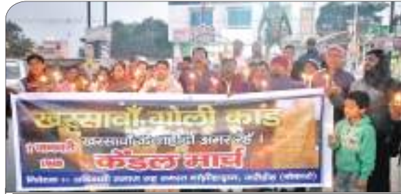
शहीदों के सम्मान में जेनामोड में निकाला कैडल मार्च