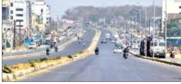
2019 से हो रहा सड़क निर्माण का कार्य

नए धनबाद के सपने को साकार करने वाली 8 लेन सड़क का काम अब भी अधूरा है. पिछले डेढ़ माह से निर्माण कार्य में लगी शिवालय और त्रिवेणी कंस्ट्रक्शन ने अपना काम बंद कर रखा है. 85 करोड़ के रिवाइज एस्टीमेट की संचिका कैबिनेट में पड़ी है. बजट पास नहीं होने के कारण यूटिलिटी सिफ्टिंग, रोड फर्नीचर तथा नाला का काम अधूरा है. इतना ही नहीं सड़क के निर्माण कार्य की अवधि भी अब समाप्त हो गई है. अब नया बजट पास होने तथा एक्सटेंशन मिलने के बाद ही सड़क का निर्माण कार्य शुरू होगा.