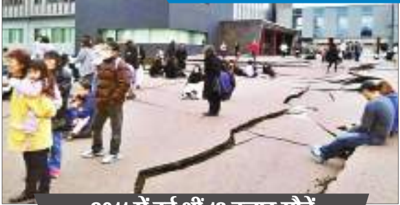
2011 में हुई थीं 18 हजार मौतें

जापान में मार्च 2011 में तीव्रता वाले विनाशकारी भूकंप के कारण जबर्दस्त सुनामी आई थी। तब उठी सुनामी की लहरों ने फुकुशिमा न्यूक्लियर प्लांट को तबाह कर दिया था। इसे पर्यावरण को नुकसान के लिहाज से बड़ी घटना माना गया था। तब समुद्र में उठी 10 मीटर ऊंची लहरों ने कई शहरों में तबाही मचाई थी। इसमें करीब 18 हजार लोगों