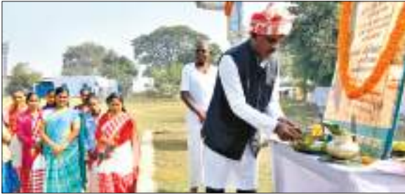
बोकारो में खरसावां गोलीकांड के शहीदों को नमन करते समाजसेवी।