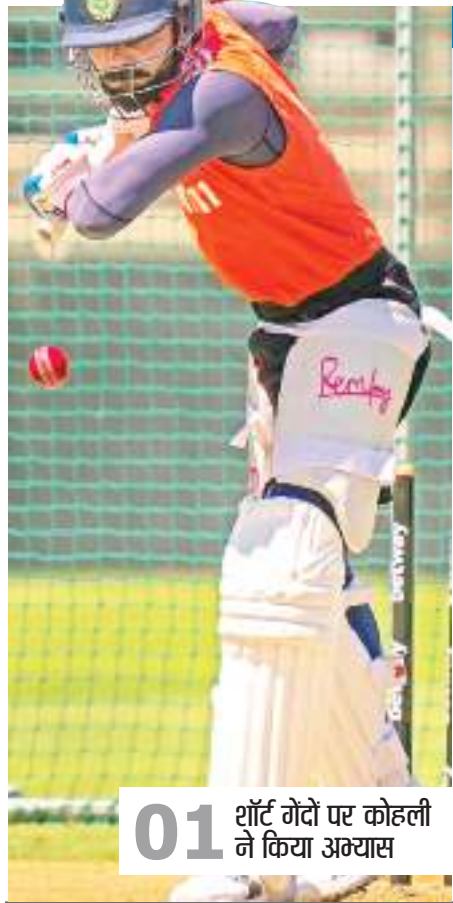
01 शॉर्ट गेंदों पर कोहली ने किया अभ्यास

केपटाउन । नए साल के पहले दिन भारतीय खिलाड़ियों ने यहां बुधवार से दक्षिण अफ्रीका के खिलाफ खेले जाने वाले टेस्ट मैच के लिए जमकर अभ्यास किया।