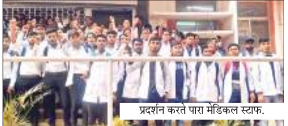
प्रदर्शन करते पारा मेडिकल स्टाफ.

झारखंड के तीन सरकारी मेडिकल कॉलेजों में दो साल के कोर्स को 15 दिनों में पूरा करा निबंधन किया जा रहा है। इससे पारा मेडिकल स्टाफ में आक्रोश देखा जा रहा है। मंगलवार को पारा मेडिकल स्टाफ का गुस्सा फूट पड़ा। पारा मेडिकल स्टाफ ने एमजीएम मेडिकल कॉलेज परिसर में जमकर विरोध प्रदर्शन किया। इस दौरान हेमंत सोरेन और बन्ना गुप्ता हाथ-हाथ के भी नारे लगाए गए, पारा मेडिकल स्टाफ का कहना था कि उन लोगों ने दो साल का डिप्लोमा कोर्स किया है और साथ ही एक साल का इंटरशिप को भी पूरा किया है जिसके बाद वे लोग अनुबंध पर काम कर रहे हैं। अब झारखंड सरकार द्वारा पारा मेडिकल स्टाफ को स्थायी करने के लिए कुल 600 से