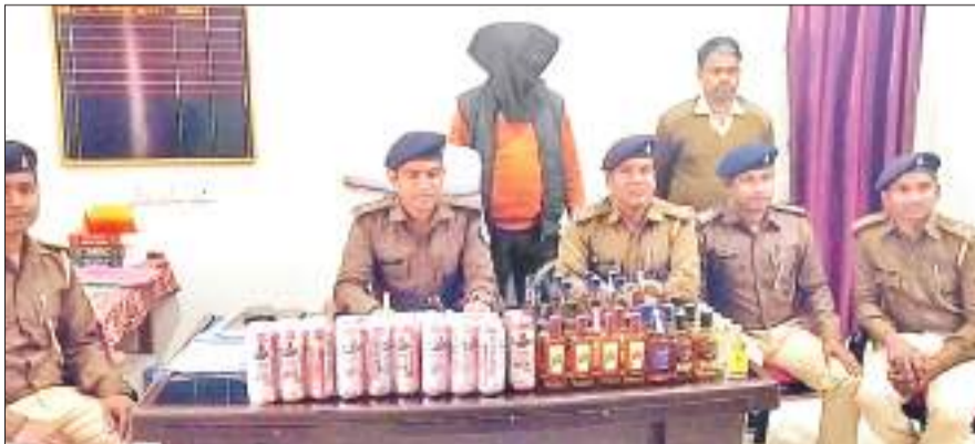
बरामद शराब और गिरफ्तार दुकानदार के कारनामों के बारे में जानकारी देते डीएसपी व अन्य पुलिस अधिकारी।

उन्होंने बताया कि सोमवार की शाम मिली गुप्त सूचना की सत्यापन के लिए तत्काल सशस्त्र बल के साथ