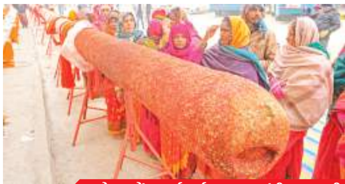
अयोध्या में जलाई गई 108 फुट लंबी अग्ररबती

अयोध्या में राम मंदिर के प्राण प्रतिष्ठा समारोह वाले दिन पूरा परिसर संगीतमय रहेगा. इस मौके पर उत्तर प्रदेश की बांसुरी तथा ढोलक से लेकर तमिलनाडु के मुद्दंग जैसे देशभर के विभिन्न शास्त्रीय वाद्ययंत्र बजाये जाएंगे. 'श्री राम जन्मभूमि तीर्थ क्षेत्र' के महासचिव चंपत राय ने बताया कि 22 जनवरी को भव्य समारोह के दौरान प्रस्तुति के लिए भारत के विभिन्न हिस्सों से संगीतकारों का चयन किया गया है. लोगों द्वारा 'अधुने मंदिर' में समारोह के आयोजन को लेकर उठाये जा रहे सवाल पर राय ने कहा कि मैं किसी भी आलोचना का जवाब नहीं दूंगा. राय ने बताया कि यह समारोह प्रधानमंत्री नरेंद्र मोदी, राष्ट्रीय स्वयंसेवक संघ (आरएसएस) प्रमुख मोहन भागवत, उत्तर प्रदेश की राज्यपाल आनंदीबेन पटेल, उत्तर प्रदेश के मुख्यमंत्री योगी आदित्यनाथ और मंदिर न्यास के अध्यक्ष महंत नृत्य गोपाल दास की गरिमामय उपस्थिति में होगा. न्यास के महासचिव ने बताया कि चयनित संगीतकार अपने-अपने क्षेत्रों के भारतीय परंपरा से जुड़े विभिन्न प्रकार के 'वाद्य यंत्र' बजाएंगे. उन्होंने बताया कि इस कार्यक्रम में उत्तर प्रदेश से बांसुरी और ढोलक, कर्नाटक से वीणा, महाराष्ट्र से सुंदरी, पंजाब से अलगाओ, ओडिशा से मर्दला, मध्य प्रदेश से संतूर, मणिपुर से पुंग, असम से नगाड़ा और काली, छत्तीसगढ़ से तंबूर, बिहार से पखावज, दिल्ली से शहनाई और राजस्थान से रावणहत्था बजाने वाले कलाकार शामिल होंगे.