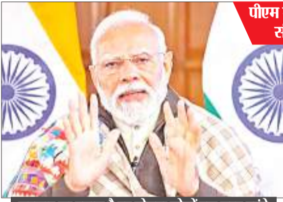
सरकार का प्रयास है हर योजना लोगों तक जल्द पहुंचे

अफगानिस्तान के पश्चिमी क्षेत्र में आए विनाशकारी भूकंप के तीन महीने बाद तकरीबन 1,00,000 बच्चों को मदद की सख्त जरूरत है। संयुक्त राष्ट्र की बच्चों के लिए काम करने वाली एजेंसी यूनीसेफ ने सोमवार को यह जानकारी दी। यूनीसेफ ने एक बयान में कहा कि हेरात प्रांत में सात अक्टूबर को 6.3 तीव्रता का भूकंप आया था और कुछ दिन बाद 11 अक्टूबर को उसी प्रांत में दूसरा भूकंप आया जिसमें 1,000 से अधिक लोगों की मौत हो गयी। जेदा जन और ईजिल जिलों में भूकंप में मारे गए ज्यादातर लोगों में महिलाएं और बच्चे थे और