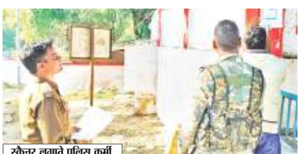
स्कैनर लगाते पुलिस कर्मी.

स्कैन कर रूप का भुगतान करना अब आम है, लेकिन इस तकनीक का प्रयोग पुलिस वाले ड्यूटी बजाने में करेंगे तो चौकना लाजमी है. जो हां, धनबाद पुलिस चौक-चौराहों पर लगे स्कैनर में अपने मोबाइल से स्कैन कर लोकेशन वरीय अफसरों भेजेंगे, ताकि अधिकारी तैनात कर्मियों का वास्तविक लोकेशन जान सकें और उनकी ड्यूटी का सही आकलन हो सके. फिलहाल धनबाद थाना क्षेत्र के 30 स्थानों पर स्कैनर बोर्ड लगाया जा रहे हैं, जल्द ही व्यवस्था पूरे जिले में लागू होगी. धनबाद थाना के रणधीर चौक, पूजा टर्किंग, गोलफ ग्राउंड, डीआरएम मोड, रेशन रोड, बरामुडी खटाल, श्रमिक चौक समेत