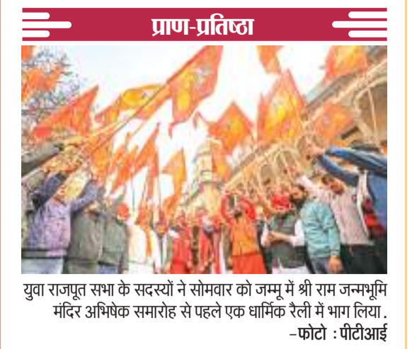
युवा राजपूत सभा के सदस्यों ने सोमवार को जम्मू में श्री राम जन्मभूमि मंदिर अभिषेक समारोह से पहले एक धार्मिक रेली में भाग लिया.