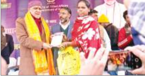
जिलास्तरीय कार्यक्रम में सम्मिलित होने के लिए उपभोक्ता मामले राज्य

पीएम, जनमन कार्यक्रम के तहत समस्त भारत में पीवीटीजी समुदायों के समग्र उत्थान के उद्देश्य से जनजातीय मामलों मंत्रालय भारत सरकार के द्वारा सोमवार को पीएम जनमन अभियान शुरू किया गया है। वहीं जिले के तालझारी प्रखंड के बड़ा दुर्गापुर पंचायत के फुटबाल मैदान में जिला स्तरीय कार्यक्रम का आयोजन किया गया। वहीं तालझारी प्रखंड के बड़ा दुर्गा पंचायत में आयोजित