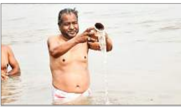
बाबूलाल मरांडी ने मकर संक्रांति के दिन सफाई की। उसके बाद बाबूलाल मरांडी मुक्तेश्वर धाम शिव मंदिर पहुंचकर मंदिर परिसर की अपने हाथों से सफाई की। साहिबगंज में मकर संक्रांति के दिन गंगा स्नान करते हुए बाबूलाल मरांडी ने झारखंड के प्रथम

झारखंड राज्य के भाजपा प्रदेश अध्यक्ष बाबूलाल मरांडी ने मकर संक्रांति के दिन सोमवार को गंगा में स्नान किया। उन्होंने बिजली घाट मुक्तेश्वरधाम शिव मंदिर की सफाई करने के बाद पूजा-अर्चना भी की। वहीं गंगा स्नान करने के बाद मंदिर में बाबूलाल मरांडी ने मकर संक्रांति के दिन सफाई की। उसके बाद बाबूलाल मरांडी मुक्तेश्वर धाम शिव मंदिर पहुंचकर मंदिर परिसर की अपने हाथों से सफाई की। साहिबगंज में मकर संक्रांति के दिन गंगा स्नान करते हुए बाबूलाल मरांडी ने झारखंड के प्रथम मुख्यमंत्री बाबूलाल मरांडी ने वहां मौजूद लोगों को स्वच्छता के प्रति जागरूक किया। इसके बाद वह ओझा टोली गंगा घाट पहुंचे और गंगा में डुबकी लगाई। मंदिर में पूजा करने के बाद बाहर निकलते हुए गंगा स्नान करने के बाद बाबूलाल मरांडी ने गंगा घाट पर स्थित बाबा गंगेश्वर नाथ धाम शिव मंदिर में भोलेनाथ की पूजा की। उन्होंने तिल, आटा, चीनी, चावल, दाल, आलू व पैसे पुरोहित को दान में दिए। साहिबगंज में बीजेपी ऑफिस में रजिस्टर पर हस्ताक्षर किए। इसके बाद भाजपा नेता ओझा साहिबगंज स्थित भाजपा जिला कार्यालय पहुंचे। उन्होंने कार्यालय का निरीक्षण किया और