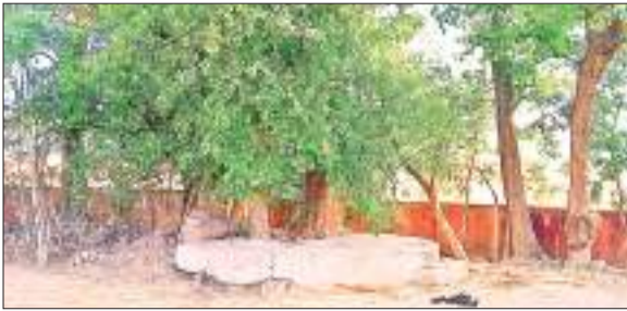
यहां होती माता की पूजा.

यहां माता का ना कोई भव्य मंदिर, ना देवी की आकर्षक मूर्ति. मान्यता है कि इसके बाद भी यहां माता के नाम से सच्चे मन से मांगी गई हर मन्त पूरी होती है. यहां माता पर आस्था रखने वाले लोगों के लिए मां का आशीर्वाद सदा बना रहता है. ये स्थान है चांडिल अनुमंडल क्षेत्र के नीमडीह प्रखंड अंतर्गत सामानपुर पंचायत के अधीन बामनी में. दलमा पर्वत श्रृंखला से जुड़े छोटे-बड़े पर्वतों की तराई पर यहां वर्षों से मेला लगता आ रहा है. यहां मां चंडी (दुर्गा) की पूजा साल पेड़ के नीचे एक शिला में की जाती है. मकर संक्रांति के एक दिन