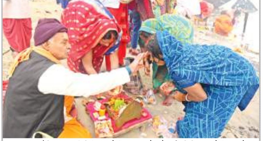
भागलपुर : अजगैबीनाथ उत्तरवाहिनी गंगा घाट में गंगा स्नान करने वाले भक्तों की भीड़ सुबह से गंगा घाट में उमड़ गई. ऐसी मान्यता है कि आज के ही दिन अजगैबीनाथ के उत्तरवाहिनी गंगा में डुबकी लगाने एवं भगवान भास्कर को जल चढ़ाकर दान पुण्य करने से सारी मनोकामनाएं पूर्ण होती है.