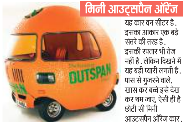
मिनी आउटस्पैन ऑरेंज