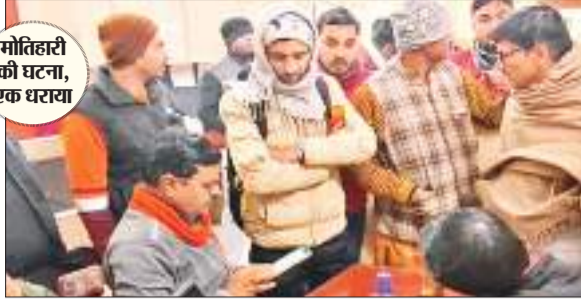
मोतिहारी की घटना, एक घराय

जिले में बेखौफ बदमाशों ने नगर थाना क्षेत्र अंतर्गत श्रीमारा फाइनेंस के कार्यालय से सोमवार को दिनदहाड़े करीब आठ लाख रुपये लूट लिए. पांच से छह की संख्या में पहुंचे बदमाशों ने फाइनेंस कार्यालय के कर्मियों को बंधक बनाकर लूटपाट की घटना को अंजाम दिया. हालांकि एक बदमाश को पकड़ लिया गया है. उसे पुलिस के हवाले कर दिया गया है. इससे पहले रविवार की रात ही आभूषण दुकान से 1.25 करोड़ से ज्यादा के आभूषण की चोरी हुई है. पुलिस इस मामले की जांच में जुटी है.