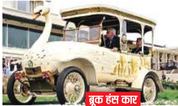
बुक हंस कार

सड़कों पर डबल डेकर बस तो हम सबने कभी न कभी जरूर देखी है. लेकिन एक कार डबल डेकर है. डिजाइन ऐसी कि लगे कि एक कार दूसरी कार पर उल्ट कर रख दी गई है. यह डिजाइन आकर्षक तो है, पर अचानक और नए देखने वालों के लिए बेहद डरावना भी.