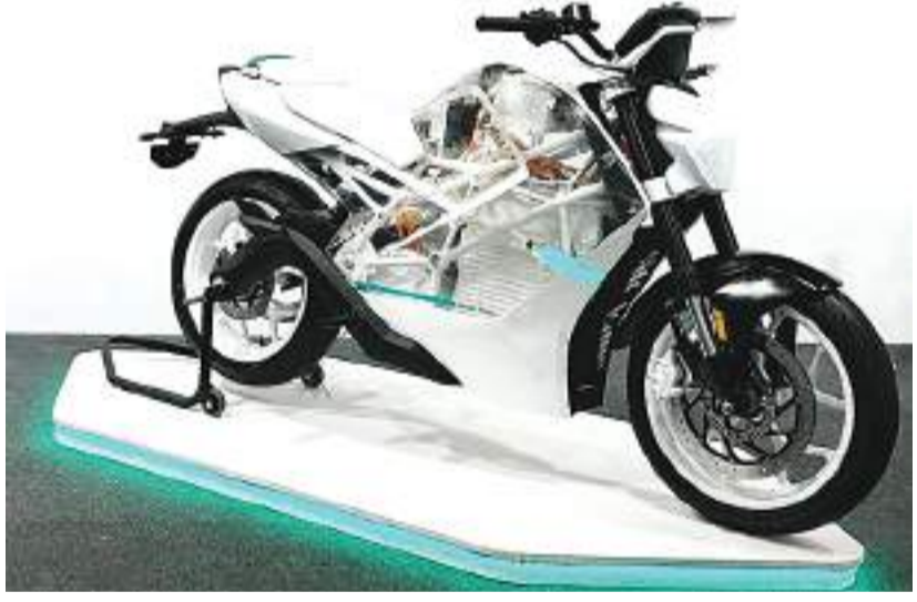
डिजाइन का अलग

भारत में ई कार-बाइक, स्कूटर रोज नए अंदाज में सामने आ रहे हैं. ओला, एथर, बजाज और हीरो जैसी नामी कंपनियां नए फीचर्स के साथ ई ऑटो इंडस्ट्री को रफ्तार दे रहे हैं तो कई नए स्टार्ट-अप ने भी इस फील्ड में जोरदार एंट्री ली है. तमिलनाडु ग्लोबल इन्वेंस्टर्स मीट में पिछले दिनों चेन्नई बेस्ड एक नए इलेक्ट्रिक टू-व्हीलर प्लेयर रैट्टी ने अपनी एक नई इलेक्ट्रिक मोटरसाइकिल को पेश किया है, जिसको लेकर कंपनी का दावा है कि ये दुनिया की पहली हाई-वोल्टेज इलेक्ट्रिक बाइक है.