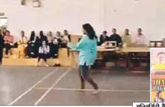
कार्यक्रम में नृत्य प्रस्तुत करती छात्रा.