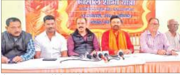
शोभा यात्रा की जानकारी देते सेवा संघ के सदस्य.