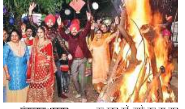
संवाददाता । धनबाद