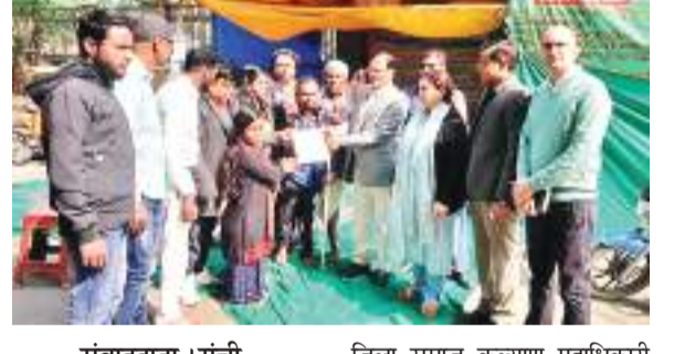
संवाददाता । रांची