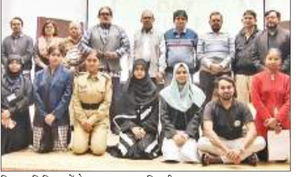
शिक्षक-शिक्षिकाओं के साथ पुरस्कृत प्रतिभागी.