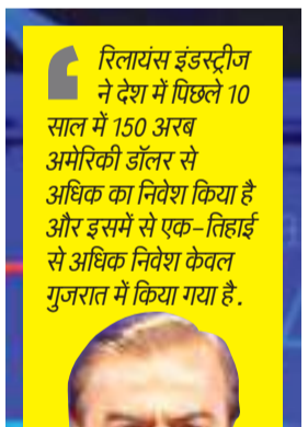
रिलायंस इंडस्ट्रीज ने देश में पिछले 10 साल में 150 अरब अमेरिकी डॉलर से अधिक निवेश किया है और इसमें से एक-तिहाई से अधिक निवेश केवल गुजरात में किया गया है।

उन्होंने मंच पर मौजूद प्रधानमंत्री नरेंद्र मोदी की तारीफ करते हुए उन्हें भारत का सबसे सफल प्रधानमंत्री तथा वर्तमान पीढ़ी का सबसे महान वैश्विक नेता बताया। उन्होंने कहा कि दुनिया की कोई भी ताकत भारत को 2047 तक 35,000 अरब डॉलर की अर्थव्यवस्था बनाने से नहीं रोक सकती। अंबानी ने सम्मेलन को 'दुनिया का सबसे प्रतिष्ठित निवेशक