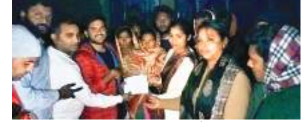
अस्पताल प्रबंधन शनिवार को परिजनों को चेक सौंपते हुए.