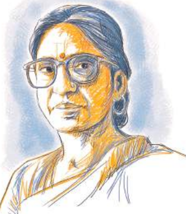
जयंती विशेष : 11 दिसंबर