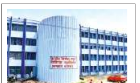
थैलेसीमिया मरीजों को दी जाने वाली दवा खत्म है. जल्द से जल्द दवा उपलब्ध कराने का प्रयास किया जा रहा है. टैंडर की प्रक्रिया पूरी होते ही दवा उपलब्ध करा दी जाएगी. सिंगल टैंडर होने की वजह से दवा अब तक उपलब्ध नहीं हो पाई है.

मरीज को ब्लड चढ़ाने की नौबत आ जाती है. इस स्थिति से बचाने के लिए सिप्ला डेजीरॉक्स 250 व 500 एमजी की दवा मरीज को उम्र के अनुसार चिकित्सक देते हैं. बाहर से दवा खरीदने में परिजनों को 900 से एक हजार रुपए तक खर्च करने पड़ रहे हैं. मरीज को एक टैबलेट रोज खानी होती है.