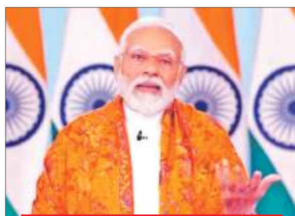
भीख मांगने की प्रवृत्ति घटी

प्रधानमंत्री नरेंद्र मोदी ने शनिवार को विपक्षी दलों पर निशाना साधते हुए कहा कि अगर उन्होंने स्वार्थ के बजाय सेवाभाव को सर्वोपरि रखा होता, तो देश की बहुत बड़ी आबादी अभाव, मुसीबतों व तकलीफों में नहीं रहती. उन्होंने कहा कि हाल ही में संपन्न विधानसभा चुनाव के नतीजों ने साफ कर दिया है कि 'मोदी की गारंटी' में दम है. प्रधानमंत्री ने यह बातें वीडियो कांग्रेस के माध्यम से 'विकसित भारत संकल्प यात्रा' के लाभार्थियों के साथ संवाद करने के बाद अपने संबोधन में कही. उन्होंने कहा, देश में हाल में हुए विधानसभा चुनावों के परिणामों की आज भी बहुत चर्चा हो रही है. इन चुनाव के नतीजों ने साफ कर दिया है कि मोदी की गारंटी में ही दम है. मैं सभी मतदाताओं का आभारी हूँ, जिन्होंने मोदी की गारंटी पर भरोसा किया. विकसित भारत संकल्प यात्रा का लक्ष्य: उन्होंने कहा, जब लाभ मिलता है तो एक विपक्ष बढ़ता है. जिंदगी जीने की एक नई ताकत आ जाती है. इस कार्यक्रम में देश भर से 'विकसित भारत संकल्प यात्रा' के हजारों लाभार्थी वरचुअल रूप से शामिल हुए. कार्यक्रम के दौरान पूरे देश से 2,000 से अधिक वैन, हजारों कृषि विज्ञान केंद्र और सामान्य सेवा केंद्र भी जुड़े. कार्यक्रम में बड़ी संख्या में केंद्रीय मंत्री, सांसद, विधायक और स्थानीय स्तर के प्रतिनिधि भी शामिल हुए. 'विकसित भारत संकल्प यात्रा' पूरे देश में सरकार की प्रमुख