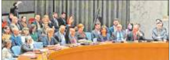
एजेंसी। संयुक्त राष्ट्र

अमेरिका ने गाजा में तत्काल मानवीय संघर्ष विराम की मांग कर रहे संयुक्त राष्ट्र सुरक्षा परिषद के लगभग सभी सदस्यों और कई अन्य देशों द्वारा समर्थित एक प्रस्ताव के खिलाफ विश्व निकाय में शुरुवार को वीटो का इस्तेमाल किया. प्रस्ताव के समर्थकों ने तीसरे महीने भी युद्ध जारी रहने पर और लोगों की मौत तथा तबाही को लेकर आगह किया और इसे दुःख दिन बताया. सुप में प्रस्ताव के पक्ष में एक के मुकाबले 13 वोट पड़े: संयुक्त राष्ट्र की 15 सदस्यीय सुरक्षा परिषद