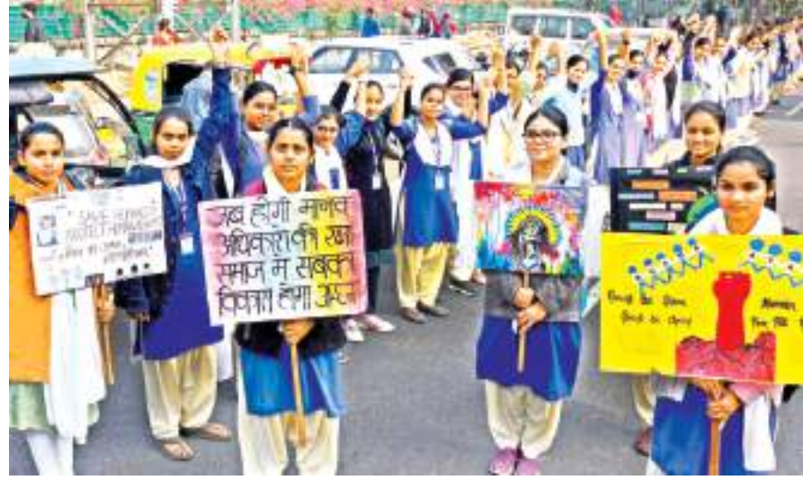
पटना: शनिवार को पटना वीमेस कॉलेज की छात्राएं मानवाधिकार दिवस पर एक अभियान में हिस्सा लेती हुईं.

और उत्तर में हाजीपुर इस पुल से जुड़े हुए हैं. चूंकि गांधी सेतु गंगा नदी के ऊपर स्थित है. इसलिए इस पुल को गंगा सेतु के नाम से भी जाना जाता है. इस पुल का उद्घाटन भारत की पूर्व प्रधानमंत्री इंदिरा गांधी ने मई 1982 में हाजीपुर में एक समारोह में किया था.