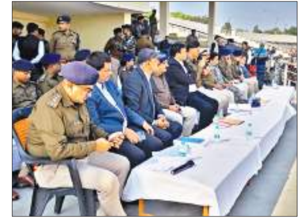
धनबाद में उपराष्ट्रपति के कार्यक्रम को लेकर जरूरी दिशानिर्देश देते उपायुक्त व एसएसपी और बैठक में उपस्थित वरीय पुलिस-प्रशासनिक अधिकारी व अन्य.

आईआईटी आईएसएम के दीक्षांत समारोह में रविवार को होने वाले उपराष्ट्रपति जगदीप धनखड़ के कार्यक्रम को लेकर शनिवार को मिंगा स्पोर्ट्स कम्प्लेक्स में उपायुक्त वरुण रंजन और एसएसपी संजीव कुमार ने दंडाधिकारियों, पुलिस पदाधिकारियों एवं पुलिस बल के साथ बैठक की. उपायुक्त ने कहा महाहिम के आगमन को लेकर सारी तैयारियां पूरी कर ली गई हैं. जिस रूट से महाहिम आगे वहां पर बैरिकेडिंग की व्यवस्था रहेगी. प्रतिनिक्त सभी अधिकारी अपने अपने काम को लेकर अलर्ट रहेंगे. किसी भी तरह की कोताही बर्दाश्त नहीं की जाएगी. उन्होंने बताया कि हैलीपैड की भी सारी व्यवस्था दुरुस्त कर ली गई है. जमशेदपुर में कार्यक्रम के बाद धनखड़ धनबाद पहुंचेंगे. वहां से रांची लौट कर दिल्ली चल जाएंगे.