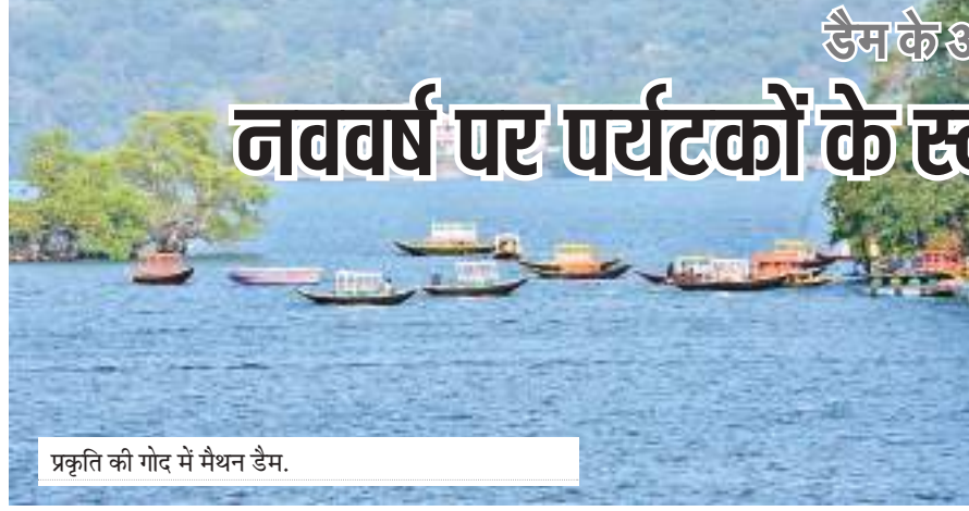
प्रकृति की गोद में मैथन डैम.