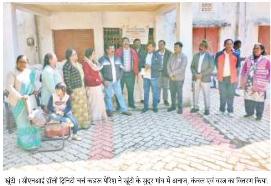
खूंटी। सीएनआई हॉली ट्रिनिटी चर्च कडरू पेरिश ने खूंटी के सुदूर गांव में अनाज, कंबल एवं वस्त्र का वितरण किया।