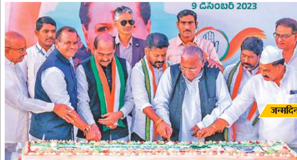
जन्मदिन की बधाई

हैदराबाद। हैदराबाद के गांधी भवन में शनिवार को पार्टी की नेता सोनिया गांधी के 77वें जन्मदिन पर आयोजित समारोह के दौरान कांग्रेस नेता माणिकराव ठाकरे और अन्य के साथ तेलंगाना के मुख्यमंत्री ए रवंत रेड्डी ने केक काटकर बधाई दी.