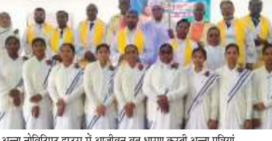
संत अन्ना नोवितिएट हाउस में आजीवन व्रत धारण करती अन्ना पुत्रियां.