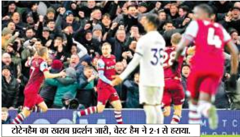
टोटेनहैम का खराब प्रदर्शन जारी, वेस्ट हैम ने 2-1 से हराया.

एवर्टन पर इंग्लिश प्रीमियर लीग के वित्तीय नियमों का उल्लंघन करने के लिए 10 अंक का जुर्माना लगाने के बाद दूसरी डिवीजन में खिसकने का खतरा मंडरा रहा था, लेकिन उसकी टीम ने अपना जज्बा बनाए रखा और गुरुवार को यहां न्यूकासल पर 3-0 से जीत दर्ज की. इस जीत से एवर्टन अभी खतरे के निशान से बाहर निकल गया है, लेकिन उसे आगामी मैचों में अपना अच्छा प्रदर्शन जारी रखना होगा. एवर्टन के 15 मैच में 10 अंक हैं और वह 17वें स्थान पर पहुंच गया है. एवर्टन को जुर्माना लगाने के बाद यह