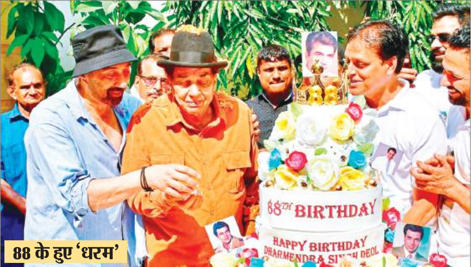
88 के हुए 'धरम'

नयी दिल्ली। सरकार ने प्याज की घरेलू उपलब्धता बढ़ाने और इसकी कीमतों पर काबू पाने के लिए अगले साल मार्च तक इसके (प्याज) निर्यात पर प्रतिबंध लगा दिया है। विदेश व्यापार महानिदेशालय (डीजीएफटी) ने एक अधिसूचना में कहा कि प्याज की निर्यात नीति को 31 मार्च, 2024 तक मुक्त से प्रतिबंधित श्रेणी में कर दिया गया है। राजधानी दिल्ली में स्थानीय सब्जी विक्रेता 70-80 रुपये प्रति किलोग्राम पर प्याज बेच रहे हैं।