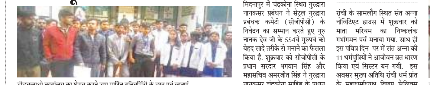
डीडबल्यूओ कार्यालय का घेराव करते उषा मार्टिन यूनिवर्सिटी के छात्र एवं छात्राएं.