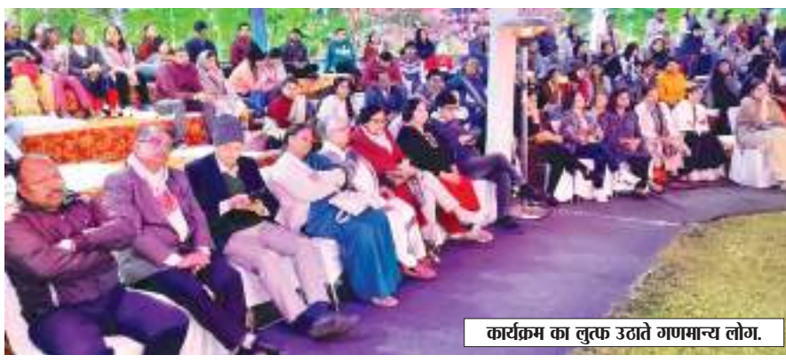
कार्यक्रम का लुक उठाते गणमान्य लोग.