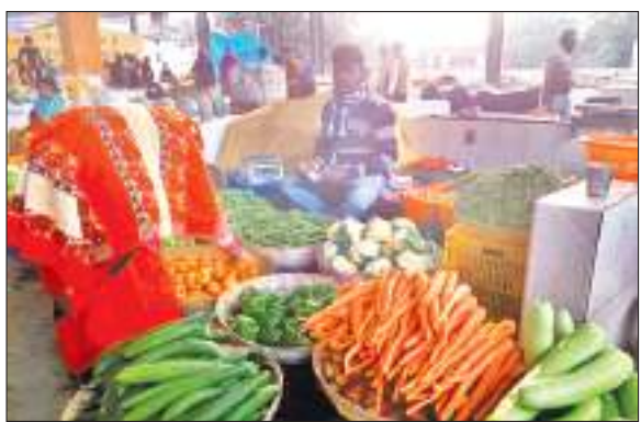
बारिश ने बिगाड़ा घर का बजट : रांची के बाजार में एक सब्जी विक्रेता.

6 दिसंबर तक किलो में सब्जियों के दाम : गोभी 30, मूली 30, नया आलू 25, टमाटर 40, बंधागोभी 30, शिमला मिर्च 40, बैंगन 40, पुंदाग आलू 20, प्याज 45, अदरख 160, सफेद आलू 25, परलत 25 रुपये 8 दिसंबर तक किलो में सब्जियों के दाम : आलू 40, टमाटर 50, मटर 80, बंधागोभी 30, फूलगोभी 40, बैंगन 40, सरसों साग 20, बीन 50, ननुवा 50, भिंडी 80, मेथी 15