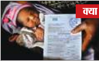
सभी अस्पतालों को एक केंद्रीकृत लॉगिन से जोड़ने का सुझाव दिया गया है

पंजीकरण करना अनिवार्य हो जाएगा। संशोधित दिशानिर्देशों के अनुसार प्रसव से जुड़ी शहर की सभी अद्वितीय अस्पताल को आईडी सौंपी जाएगी। जिसके मदत से अस्पताल बच्चा जन्म लेते ही उसका रजिस्ट्रेशन कर देगी। प्रारंभिक चरण में 91 अस्पताल-नर्सिंग होम संचालकों को आईडी दि गई है, जो इस पहल की शुरुआत का प्रतीक है।