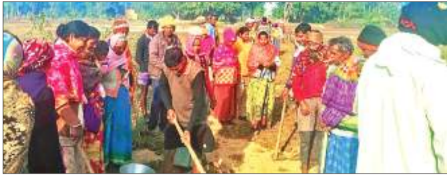
से सड़क निर्माण का कार्य शुरू किया. 125 परिवार के सैकड़ों की संख्या में ग्रामीण सुबह जुटे और श्रमदान किया. हलसु करंज टोली और डुरगु टोली के ग्रामीणों ने सरकारी तंत्र को आईना दिखाया.

लापुंग प्रखंड के हलसु गांव से हलसु करंज टोली तक डेढ़ किमी लंबी कच्ची सड़क पर सैकड़ों गड़्डों को श्रमदान कर सड़क मरम्मतकारण कार्य किया. सैकड़ों गड़्डे होने के कारण कच्चे सड़क पर चलना दुभर हो गया था. ग्रामीणों के अनुसार उन्होंने सड़क निर्माण की मांग की थी परंतु किसी ने नहीं सुना. अन्ततः ग्रामीणों ने खुद सड़क निर्माण व मरम्मतकारण की बीड़ा उठायी. बुधवार की सुबह गांव के सभी ग्रामीण मिलकर श्रमदान के माध्यम