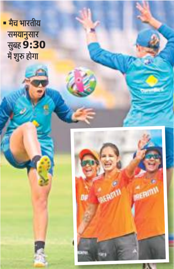
मैच भारतीय समयानुसार सुबह 9:30 में शुरू होगा