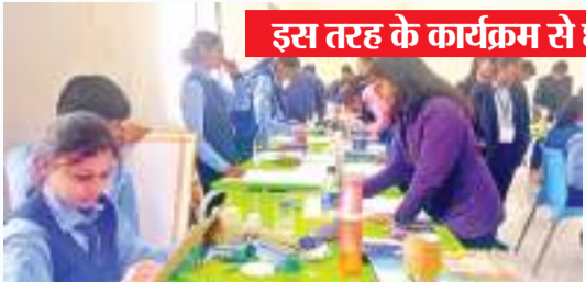
इंद्रधनुष रखा गया है कार्यक्रम का नाम