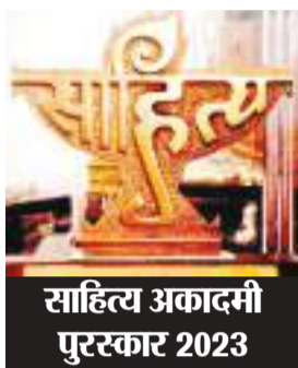
साहित्य अकादमी पुरस्कार 2023