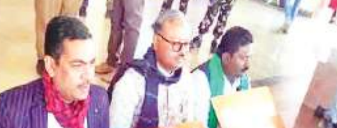
सदन से निलंबित तीनों विधायकों ने विधानसभा के मुख्यद्वार पर डेरा जमाया. धरना पर बैठे रहे.