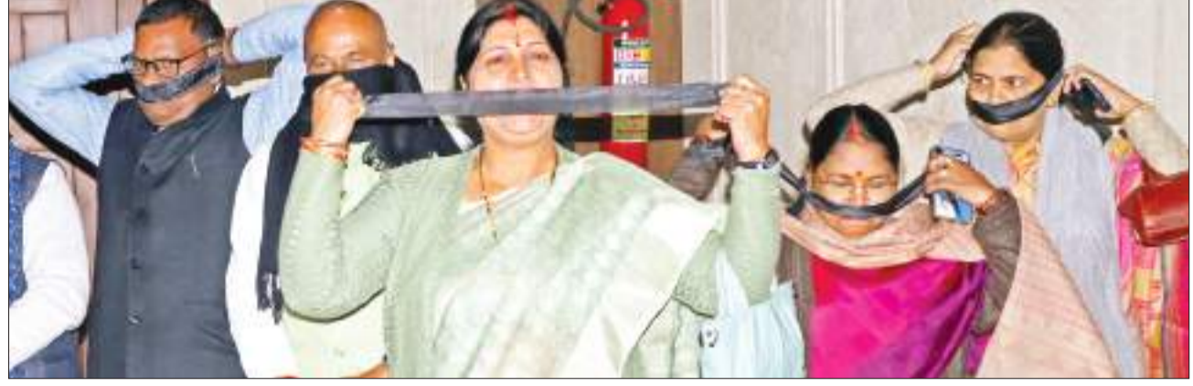
विशेष संवाददाता। रांची