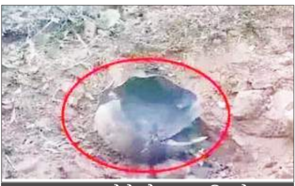
बम नष्ट करने के दौरान हुआ विस्फोट

2 से आठ दिसंबर तक पीएलजीए सप्ताह मना रहे हैं नक्सली: बता दें कि नक्सली पिछले वर्ष विभिन्न कारणों से अपनी जान गंवाने वाले 54 नक्सलियों को याद में आज 2 दिसंबर से आठ दिसंबर तक 'पीपुल्स लिबरेशन गुरिल्ला आर्मी (पीएलजीए) सप्ताह' मना रहे हैं। यह पीएलजीए सप्ताह का 23वां अवलोकन होगा। पीएलजीए सप्ताह