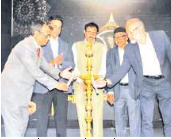
दीप जलाकर एलेक्टा वर्षा लॉन्च करते अस्पताल के शोध अधिकारी.