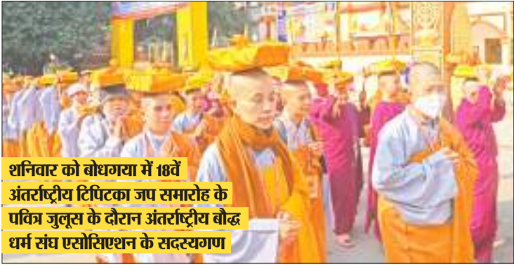
शनिवार को बोधगया में 18वें अंतर्राष्ट्रीय टिपिटका जप समारोह के पवित्र जुलूस के दौरान अंतर्राष्ट्रीय बौद्ध धर्म संघ एसोसिएशन के सदस्यगण