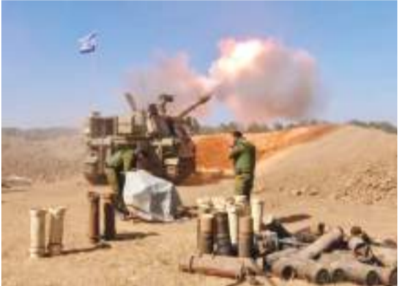
इजरायल और हमस के बीच युद्धविराम खत्म हो चुका है।

फिलिस्तीन के चरमपंथी संगठन हमस और इजराइल के बीच युद्धविराम शुक्रवार को युद्धविराम समाप्त हो गया। युद्धविराम की समाप्ति के बाद इजराइल ने फिर से गाजा पट्टी में हवाई हमले किये, जिसमें 178 फिलिस्तीनियों के मारे जाने की खबर है। वहीं इस हवाई हमले में 200 से ज्यादा घरों और इमारतों को निशाना बनाया गया। इजरायल ने दक्षिणी गाजा के कुछ हिस्सों में पंचे गिराये हैं, जिनमें लोगों से खान यूनिट शहर स्थित घरों को छोड़ने को कहा गया है। वहीं गाजा से चरमपंथियों ने इजराइल में भी रॉकेट दागे, स्वास्थ्य मंत्रालय ने इस बात की जानकारी दी। क्या है हमस के हमले का पूरा ब्लूप्रिंट? : अमेरिकी अखबार न्यूयॉर्क टाइम्स ने दावा किया है कि हमस के हमले का पूरा ब्लूप्रिंट इजरायल को एक साल पहले ही मिल गया था, ये सबकुछ दस्तावेजों, ईमेल और इंटरव्यू से पता चलता है। लेकिन इजरायली सेना और खुफिया अधिकारियों ने इसे ये मानकर खारिज कर दिया कि हमस के लिए इस हमले को अंजाम दे पाना बेहद मुश्किल होगा। लेकिन हकीकत ये है कि 40 पन्नों के इस पूरे दस्तावेज में जो कुछ जैसे लिखा है, उसे हमस के लड़ाकों ने 7 अक्टूबर को बिल्कुल वैसे ही अंजाम दिया था। इजरायल ने इस दस्तावेजों को 'जेरिको वॉल' का कोड