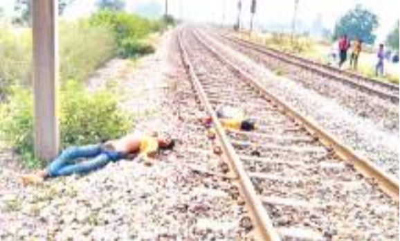
रेलवे ट्रैक पर पड़ा दोनों का शव.