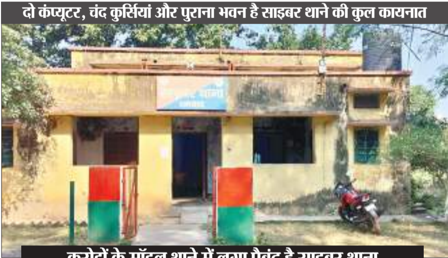
करोड़ों के मॉडल थाने में लगा पैबंद है साइबर थाना

न है गाड़ी और न मिलता तेल: वैसे तो धनबाद साइबर थाने के दर्द की सूची बहुत लंबी है. लेकिन जो सबसे ज्यादा तकलीफ देती है वो ये बात है कि इनके पास एक भी विभागीय वाहन नहीं है. गश्ती तो करनी नहीं है, लेकिन आरोपियों को पकड़ना तो होगा, ऐसे में वाहन कहां से आएगा, ये सोच हमेशा कामम रहती है. यदि कहीं से गाड़ी की व्यवस्था हो भी गई तो तेल का जुगाड़ अलग से सिरदर्द है. कहते हैं कि धर-पकड़ का काम अब एक दिन का तो है नहीं, हर दिन अपराधियों के पीछे दौड़ना है, टावर लोकेशन जहां का