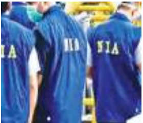
खूंटी, सिमडेगा, पलामू और पश्चिमी सिंहभूम जिले), बिहार (पटना जिला) और मध्य प्रदेश (सिद्धि जिले) में एक-एक स्थान और नई दिल्ली में दो स्थान शामिल हैं।

पीएलएफआई उग्रवादी संगठन के खिलाफ राष्ट्रीय जांच एजेंसी (एनआईए) ने झारखंड समेत चार राज्यों में छापेमारी की। इस दौरान एनआईए ने दो आरोपियों को गिरफ्तार किया, साथ ही हथियार और गोला-बारूद बरामद किए। एनआईए ने शुक्रवार को पीएलएफआई उग्रवादी संगठन से जुड़े झारखंड, बिहार, मध्य प्रदेश और नई दिल्ली में कुल 23 स्थानों की तलाशी ली गई। इनमें झारखंड में 19 स्थान (गुमला, रांची,