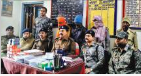
बरामद सामान: एन्ड्रॉयड मोबाइल 06 पीस, कीपैड मोबाइल 18 पीस, स्पीकर 2 पीस, लाइट 1 पीस, टैब 1 पीस, मिक्सरी 1 पीस बरामद हुए हैं.

गोमिया अंचल पुलिस निरीक्षक के नेतृत्व में मोबाइल दुकान से चोरी करने वाले तीन चोरों को एंड्रॉयड मोबाइल और कीपैड के साथ गिरफ्तार किया है. इस संबंध में गोमिया थाना में प्रेस कॉन्फ्रेंस कर अंचल निरीक्षक ने जानकारी दी. उन्होंने बताया कि पिछले 01 नवंबर को गोमिया थाना क्षेत्र के तुलबुल सुंडी टोला स्थित सेवा सावक दुकान के उपर का शीट तोड़कर दुकान में रखे मोबाइल को अज्ञात चोरों के द्वारा चोरी कर लिया गया था. इस संबंध में गोमिया थाना में प्राथमिकी दर्ज किया