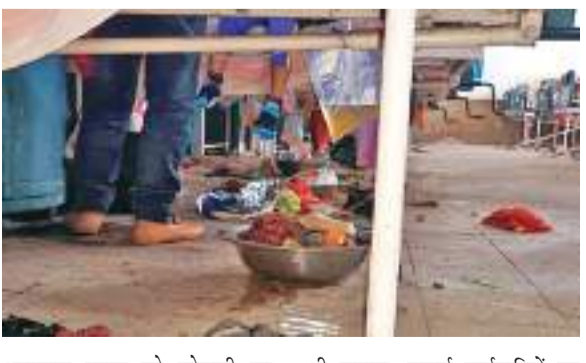
अस्पताल स्टाफ को परेशानी का सामना करना पड़ा. हड़ताली कर्मचारियों ने इमरजेंसी के मुख्य द्वार के पास प्रबंधन और एजेंसी के खिलाफ जमकर नारेबाजी की. साथ ही एजेंसी पर वादाखिलाफी का आरोप

शहीद निर्मल महतो मेडिकल कॉलेज एवं अस्पताल (एसएनएमएमसीएच) में सफाई कर्मियों की हड़ताल शुक्रवार को दूसरे दिन भी जारी रही. वृत्तन बढोतरी की मांग को लेकर निजी एजेंसी कर्मांडो सिस्योरिटी सर्विसेज के अधीन कार्यरत कुल करीब 150 सफाई कर्मचारी हड़ताल में शामिल हैं. इसके चलते अस्पताल के जनरल वार्ड से लेकर आईसीयू तक की साफ-सफाई ठप हो गई है. परिसर में गंदगी फैली है और जगह-जगह कचरे का अंबार लगा है. मेडिसिन वार्ड, सर्जरी, स्त्री एवं प्रसूति रोग विभाग, शिशु रोग विभाग व ओपीडी में साफ-सफाई नहीं होने से मरीजों व