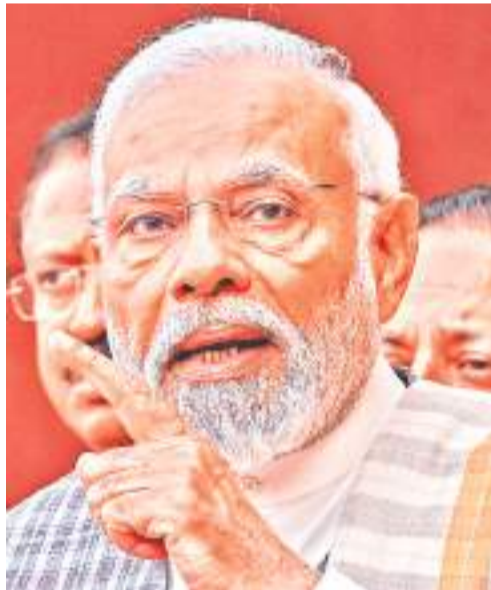
संसद के शीतकालीन सत्र पर मीडिया को संबोधित करते पीएम मोदी

केंद्रीय शिक्षा मंत्री धर्मद प्रधान ने तेलंगाना में केंद्रीय जनजातीय विश्वविद्यालय स्थापित करने संबंधी एक विधेयक लोकसभा में पेश किया। विधेयक में कहा गया है कि सम्मत्तिका सरकारी केंद्रीय जनजातीय विश्वविद्यालय की स्थापना आने वाले वर्षों में क्षेत्रीय आकांक्षाओं को पूरा करेगी। यह उच्च शिक्षा तक लोगों की पहुंच और गुणवत्ता में वृद्धि करेगी।