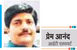
प्रेम आनंद ऑथरी एक्सपर्ट

बता दें कि एपल आईफोन 15 सीरीज के प्रो मॉडल को टाइटेनियम फ्रेम के साथ लॉन्च किया गया था, वहीं गूगल पिक्सल 8 सीरीज जेन एआई फीचर्स से लेश है. ये दोनों फीचर्स सैमसंग के बहुप्रतीक्षित स्मार्टफोन सैमसंग गैलेक्सी एस 24 में मिलेगा, ऐसा लीक रिपोर्ट में कहा गया है. यह एक आर्टिफिशियल इंटेलिजेंस फीचर होगा, जो सैमसंग यूजर्स को रियल टाइम लाइव कॉल फीचर को ट्रांसलेट करने का ऑप्शन देगा. सैमसंग गैलेक्सी एस24 स्मार्टफोन में एपल और गूगल के इन दोनों स्मार्टफोन फीचर का इस्तेमाल किया जाएगा. सैमसंग की अपनी स्मार्ट पेंसिल का सपोर्ट दिया जाएगा. सैमसंग गैलेक्सी एस 24 के कैमरे व प्रोसेसर भी पहले से बेहतर होंगे. तकनीकी गलियारों की चर्चा के मुताबिक इस अपकॉमिंग स्मार्टफोन में क्वालम स्नैपड्रैगन 8 जेन 3 चिपसेट दिया जा सकता है. सैमसंग गैलेक्सी एस24 अल्ट्रा स्मार्टफोन एक 6.8 इंच क्यूएचडी+ डिस्प्ले के साथ आएगा. फोन में 120 हर्ट्ज रिफ्रेश रेट सपोर्ट दिया जाएगा. फोन को 12जीबी रैम सपोर्ट के साथ पेश किया जा सकता है.