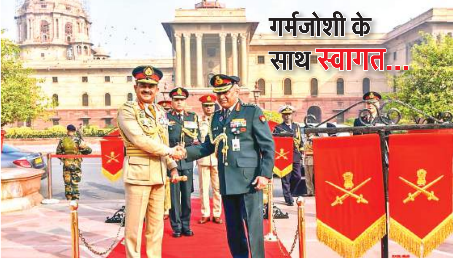
श्रीलंकाई सेना कमांडर लेफ्टिनेंट जनरल विक्रम लियानगे का नई दिल्ली के साउथ ब्लॉक में गार्ड ऑफ ऑनर निरीक्षण के आगमन पर सेना प्रमुख जनरल मनोज पांडे ने स्वागत किया।