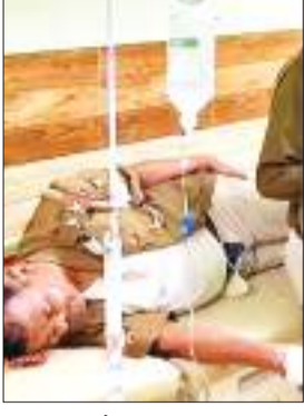
लहलुहान हो गया.