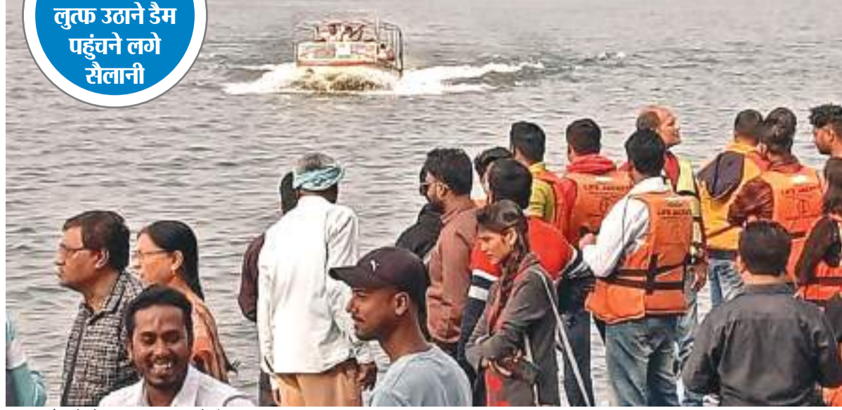
चांडिल डैम में चोटिंग का लुक उठाने सैलानी.