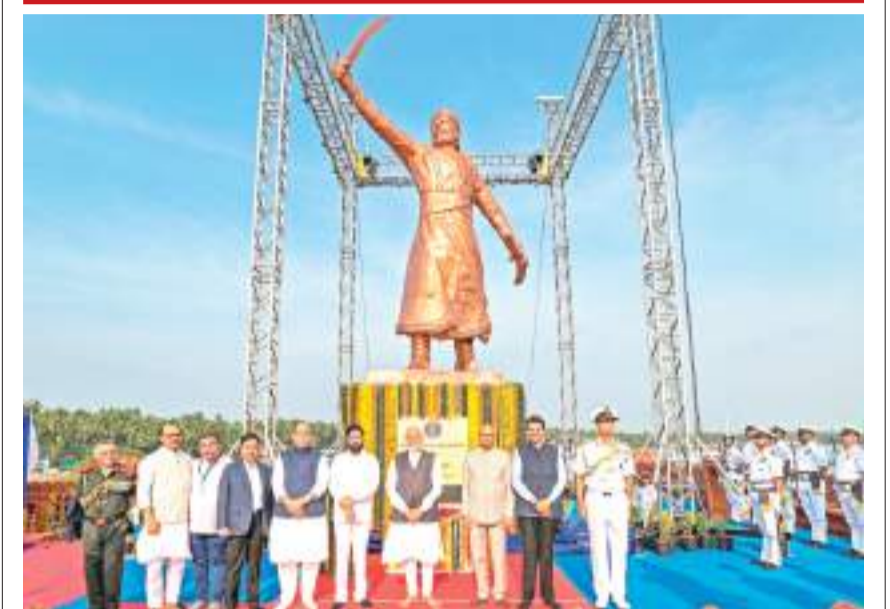
पीएम नरेंद्र मोदी ने सोमवार को महाराष्ट्र के सिंधुदुर्ग में राजकोट किले में छत्रपति शिवाजी महाराज की प्रतिमा का अनावरण किया. फिर वे नौसेना दिवस 2023 पर आयोजित इवेंट में शामिल हुए. उन्होंने परेड की सलामी भी ली.