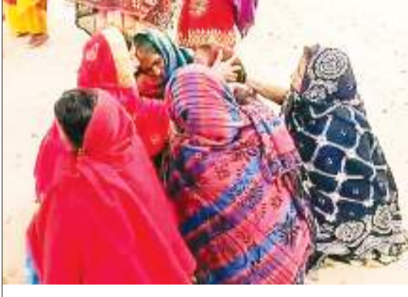
घटना के बाद रोते-बिलखते परिजन.

कैमूर में भीषण सड़क हादसे में तीन लोगों की मौत हो गई. घटना चैनपुर थाना क्षेत्र के कुरई गांव के पास की है. रविवार देर रात बाइक ने खड़े ट्रैक्टर में टक्कर मार दी. हादसा इतना भीषण था कि दो की मौके पर ही मौत हो गई. वहीं तीसरे ने अस्पताल में दम तोड़ दिया. घटना के बाद इलाके में हड़कंप मच गया. आसपास के लोगों की भीड़ लग गई. इधर, सूचना मिलते ही पुलिस मौके पर पहुंची और छानबीन में जुट गई. पुलिस के अनुसार, सड़क हादसे में तीन युवकों के मौत की सूचना मिली है. तीनों शवों को पोस्टमार्टम के लिए अस्पताल भेज दिया गया है. हादसे का कारण अत्यधिक रफ्तार बताया जा रहा है.