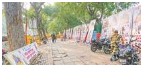
रविवार को नई दिल्ली में कांग्रेस का मुख्यालय सूना-सूना सजा नजर आया।

लोकसभा चुनाव की रणनीति पर होगी चर्चा: सूत्रों ने बताया है कि