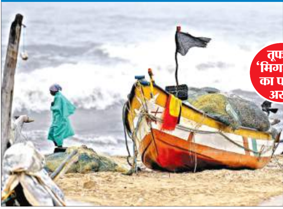
तूफान 'मिगजॉम' का पड़ेगा असर