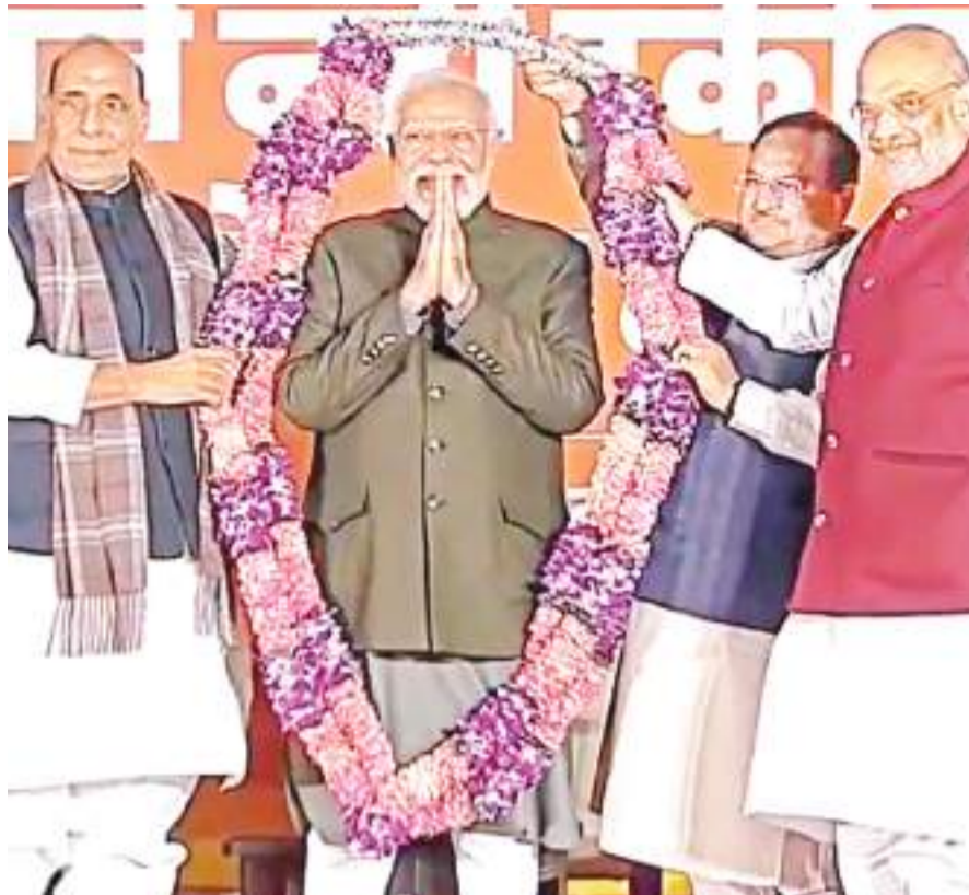
मोदी को गाली देने का मतलब ओबीसी समाज के लोगों को गाली देना : नड्डा

उन्होंने कहा, इन चुनाव में इन चारों जातियों ने भाजपा की योजनाओं और भाजपा के रोडमैप को लेकर बहुत उत्साह दिखाया है। आज हर गरीब, हर वंचित, हर किसान और आदिवासी भाई-बहन यह सोचकर खुश है कि उसने जिसे वोट दिया, वह विजय उसकी अपनी है। आज पहली बार मतदान करने वाला मतदाता भी बड़े गर्व के साथ कह रहा है कि मेरा पहला वोट मेरे विजय का कारण बना है। भाजपा मुख्यालय पहुंचने के बाद कार्यकर्ताओं ने मोदी-मोदी और भाजपा जिंदाबाद के नारे लगाए। भाजपा अध्यक्ष जे पी नड्डा सहित अन्य वरिष्ठ नेताओं ने मंच पर प्रधानमंत्री को माला पहनाया। इस दौरान केंद्रीय गृह मंत्री अमित शाह और रक्षा मंत्री राजनाथ सिंह भी मौजूद थे।