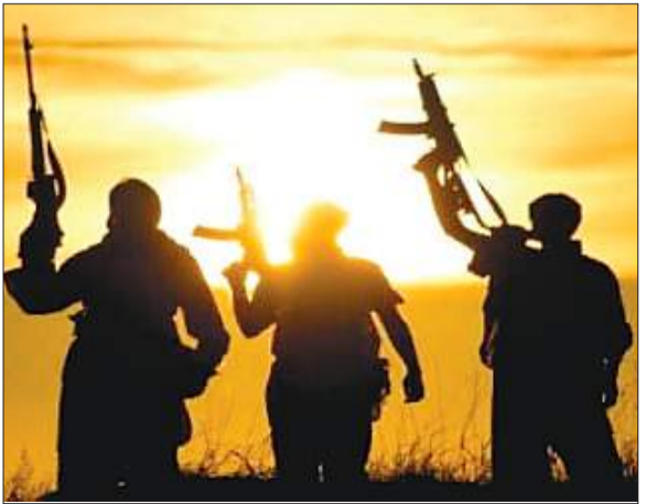
सुरक्षा बलों के 36 कर्मियों सहित 89 व्यक्ति घायल हुए। अक्टूबर के आंकड़ों की तुलना में, नवंबर में आतंकवादी हमलों में 34 प्रतिशत की वृद्धि, मृतक संख्या में 63 प्रतिशत की वृद्धि और घायल

पाकिस्तान में नवंबर महीने में आतंकवादी हमलों में 34 प्रतिशत की बढ़ोतरी हुई और इस महीने देश में 63 आतंकवादी हमले हुए। एक थिंक टैंक की रिपोर्ट में रविवार को यह जानकारी दी गई। 'डॉन' समाचार पत्र ने 'पाकिस्तान इंस्टीट्यूट फॉर कॉन्फ्लिक्ट एंड सिक्वोरिटी स्टडीज' (पीआईसीएसएस) थिंक टैंक के आंकड़ों का हवाला देते हुए बताया कि नवंबर में 63 आतंकवादी हमलों में 83 लोगों की मौत हुई, जिनमें सुरक्षा बलों के 37 जवान और 33 आम नागरिक शामिल थे। इस्लामाबाद से संचालित थिंक टैंक के अनुसार, नवंबर में आतंकवादी हमलों में 53 आम नागरिकों और