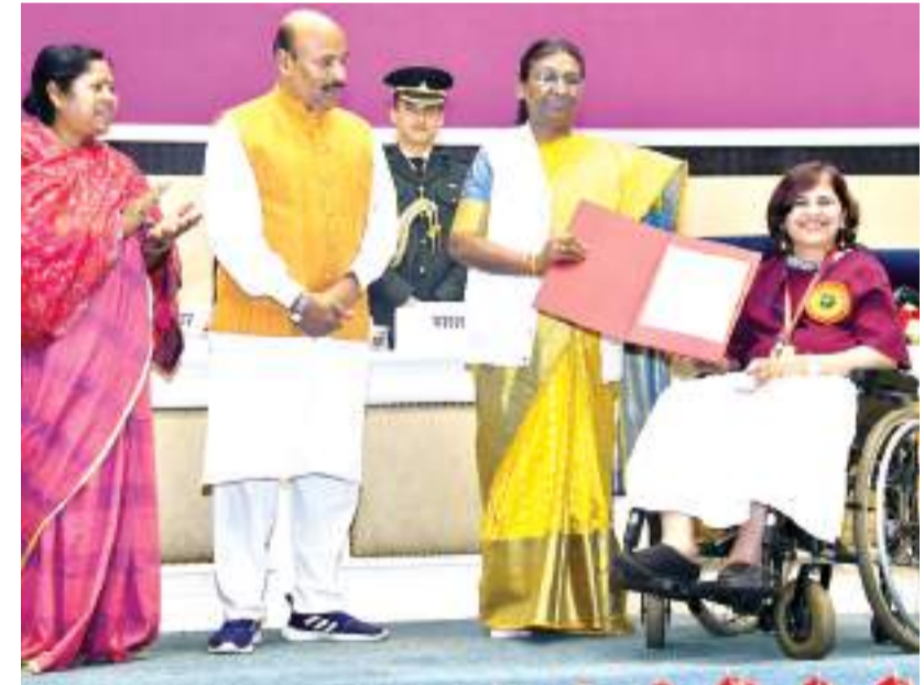
नयी दिल्ली। राष्ट्रपति द्रौपदी मुर्मू ने दिव्यांगों को सशक्त बनाने पर बल दिया है। रविवार को नयी दिल्ली में अंतरराष्ट्रीय दिव्यांगजन दिवस पर राष्ट्रीय पुरस्कार प्रदान करते हुए, उन्होंने हा कि दुनिया की आबादी में 15 प्रतिशत लोग दिव्यांग हैं। राष्ट्रपति मुर्मू ने कहा कि दिव्यांगजनों का संघर्ष और उनकी उपलब्धियां लोगों के लिए प्रेरणा का स्रोत हैं। राष्ट्रपति ने दिव्यांगों के सशक्तिकरण की दिशा में उल्लेखनीय प्रयासों के लिए लोगों, संस्थाओं, संगठनों, राज्य और जिले को कुल 30 पुरस्कार प्रदान किए।