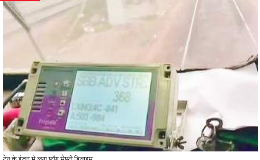
ट्रेन के इंजन में लगा फॉग सेफ्टी डिवाइस

जीपीएस आधारित डिवाइस से रेलवे ट्रैक का मैप, सिग्नल, स्टेशन और क्रॉसिंग की पूरी जानकारी जुड़ी होती है। यह सिस्टम लोको पायलट को ट्रेन चलने के दौरान क्रॉसिंग और सिग्नल की जानकारी देता है। ड्राइवर को फॉग सेफ्टी डिवाइस से पता चल जाता है कि ट्रैक पर आगे कोई दिक्कत नहीं है तो वह उसी हिसाब से ट्रेन की गति बढ़ाता है। फॉग सेफ्टी डिवाइस ट्रेन में ड्राइवर के पास लगा होता है जो ट्रैक के बारे में हर एक पल की जानकारी देता है। ट्रैक पर कोई अवरोध है तो डिवाइस के डिस्प्ले पर इसकी जानकारी मिलने लगती है। डिस्प्ले पर जीपीएस के माध्यम से इनपुट के आधार पर ड्राइवर ट्रेन की गति घटाने, बढ़ाने या ट्रेन को रोकने का फैसला करता है।