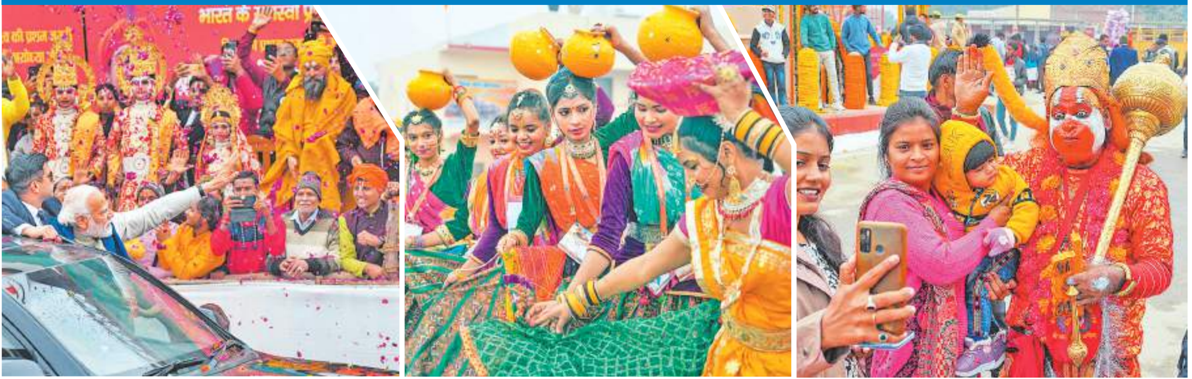
प्रधानमंत्री नरेंद्र मोदी ने अयोध्या में एक रोड शो के दौरान हाथ हिलाकर भीड़ का अभिवादन किया, इस दौरान कलाकारों और स्थानीय निवासियों ने पीएम का स्वागत पुष्प बरसा कर किया।