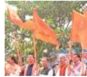
परिसर से 300 मीट्रिक टन चावल से भरे 11 ट्रक को झंडी दिखाकर श्रीराम जन्मभूमि अयोध्या के लिए

रायपुर। छत्तीसगढ़ के मुख्यमंत्री विष्णु देव साय ने श्रीराम जन्मभूमि अयोध्या के लिए शनिवार को 300 मीट्रिक टन सुगंधित चावल रवाना किया. अधिकारियों ने बताया कि मुख्यमंत्री साय आज राजधानी रायपुर के वीआईपी मार्ग स्थित श्रीराम मंदिर में छत्तीसगढ़ प्रदेश राईस मिलर्स एसोसिएशन द्वारा आयोजित सुगंधित चावल अर्पण समारोह में शामिल हुए. उन्होंने बताया कि साय ने श्रीराम मंदिर