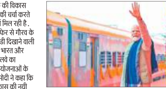
हमें सही मार्ग दिखाती है, इसलिए आज का भारत पुरातन व नूतन, दोनों को आत्मसात करते आगे बढ़ रहा है.

मोदी ने 15 हजार करोड़ रुपये से अधिक की विकास परियोजनाओं के लोकार्पण-शिलान्यास की चर्चा करते हुए कहा कि अयोध्या नगरी से नयी ऊर्जा मिल रही है. आधुनिक अयोध्या को देश के नवशो पर फ़िर से गौरव के साथ स्थापित करेंगे. शनिवार को हरी झंडी दिखाने वाली ट्रेनों पर मोदी ने कहा कि वंदे भारत, नमो भारत और अमृत भारत ट्रेनों की त्रिशक्ति भारतीय रेलवे का कायाकल्प करने जा रही है. विकास परियोजनाओं के लिए अयोध्या वासियों को बधाई देते हुए मोदी ने कहा कि दुनिया में कोई भी देश हो, अगर उसे विकास की नयी ऊंचाई पर पहुंचना है तो उसे अपनी विरासत को सहजना होगा. मोदी ने कहा कि हमारी विरासत हमें प्रेरणा देती है.