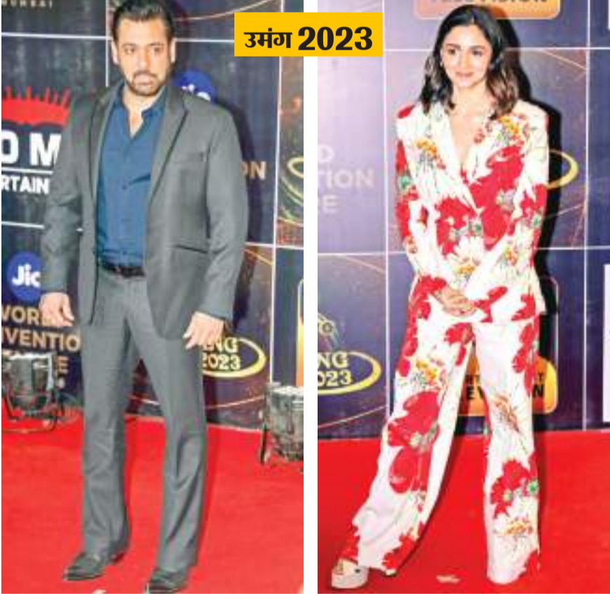
बॉलिवुड अभिनेता सलमान खान और अभिनेत्री आलिया भट्ट मुंबई पुलिस उमंग 2023 के दौरान फोटो सेशन करवाते हुए.