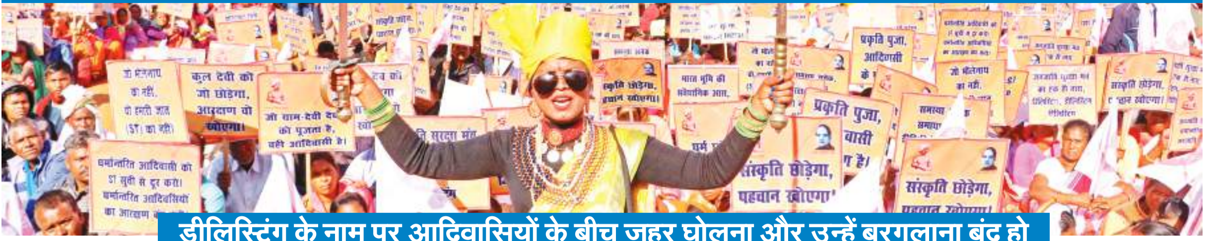
डीलिस्टिंग के नाम पर आदिवासियों के बीच जहर घोलना और उन्हें बरगलाना बंद हो