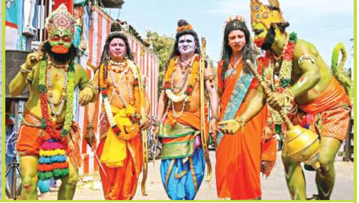
सूरत में क्रिसमस से पहले सांता क्लॉज की पोशाक पहने एक व्यक्ति तापी नदी में सींगल को खाना खिलाता हुआ और बेंगलुरु के पाताल अंजनेय मंदिर में भगवान श्री राम, सीता, लक्ष्मण और हनुमान की पोशाक में कन्नड़ हनुमान जयंती मनाते हुए कलाकार.