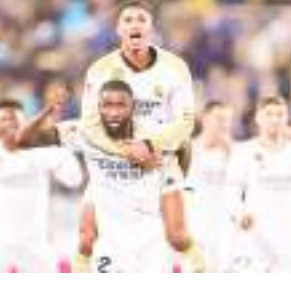
मैड्रिड के कोच कार्लो एंसेलोटी ने मैच के बाद कहा कि यह एक बहुत मुश्किल मैच था. सभी को लग रहा था कि हम यह मैच हार सकते हैं. नाचो भी दूसरे हाफ में मैदान से बाहर हो गए.

मैड्रिड (स्पेन)। लुकास वाजक्वेज (90 2वें मिनट) के एकमात्र गोल के दम पर 10 खिलाड़ियों के साथ खेल रही रियल मैड्रिड की टीम ने यहां स्पेनिश फुटबॉल लीग ला लीगा के मुकाबले में अलावेस को 1-0 से हराया. रियल मैड्रिड की टीम इस सत्र में सभी टूर्नामेंटों में खेलते हुए सिर्फ एक बार ही हारी है, लेकिन सफलता किसी को नहीं मिली. पहला हाफ गोलरहित रहा. दूसरे हाफ के 54वें मिनट में नाचो को रेड कार्ड मिलने के कारण मैदान से बाहर जाना पड़ा जिससे उनकी टीम रियल मैड्रिड को सेंच मैच 10 खिलाड़ियों के साथ खेलना पड़ा. हालांकि, मैच के इन्जुरी समय में टॉनी क्रूस के पास पर लुकास ने बॉक्स के अंदर से हेडर से गोल करके टीम का 1-0 से खाता खोल दिया. इसके बाद टीम ने मैच को इसी अंतर से अपने नाम कर लिया. रियल मैड्रिड के कोच कार्लो एंसेलोटी ने मैच के बाद कहा कि यह एक बहुत मुश्किल मैच था. सभी को लग रहा था कि हम यह मैच हार सकते हैं. नाचो भी दूसरे हाफ में मैदान से बाहर हो गए.