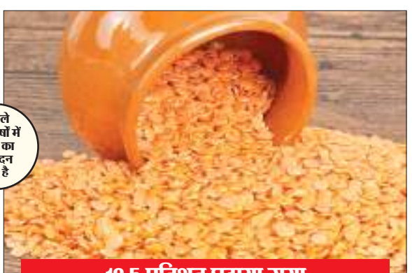
12.5 प्रतिशत घटाया गया

सरकार ने फिर दो महत्वपूर्ण निर्णय लिए हैं, जिससे गरीब समेत हर किसी को राहत होगी। पहला निर्णय है खाद्य तेलों के आयात पर लगे कस्टम ड्यूटी में एक साल के लिए पांच प्रतिशत की छूट का है। दूसरा निर्णय मसूर दाल के आयात पर कस्टम ड्यूटी को एक साल के लिए शून्य रखने का है। सरकार का यह कदम उन लोगों की मदद करने का है जो अपनी थाली में रोजगार को बनाए रखने के लिए संघर्ष कर रहे हैं। जाहिर है इसका सीधा असर गरीब वर्ग के लोगों पर पड़ेगा। इस कदम के माध्यम से सरकार ने यह सुनिश्चित करने का प्रयास किया है कि गरीब लोग अपनी जीवनयापन की बुनियादी चीजों को सही मूल्य पर प्राप्त कर सकें। खासकर, खाद्य तेलों और मसूर दाल को लेकर लिए गए इन निर्णयों से, जो आम आदमी की थाली में महत्वपूर्ण भूमिका निभाते हैं, वह लोग अब इन आवश्यक आहार सामग्रियों को प्राप्त करने में सुधार महसूस करेंगे। इसके साथ ही, सरकार का उद्देश्य यह भी है कि वे व्यक्तियों को अपनी आर्थिक स्थिति को सुधारने में