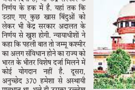
केंद्र सरकार द्वारा तत्कालीन जम्मू कश्मीर प्रांत का विशेष संवैधानिक दर्जा समाप्त किए जाने के चार वर्षों बाद सर्वोच्च न्यायालय ने भी इस कदम की संवैधानिकता पर मुहर लगा दी है। देश के मुख्य न्यायाधीश डी.वाई. चंद्रचूड़ की अध्यक्षता वाली पांच सदस्यीय संविधान पीठ ने इस विषय पर विभिन्न याचिकाओं द्वारा उठाए गए तमाम प्रश्नों का जवाब दिया है, जो केंद्र सरकार के निर्णय के हक में हैं। यहां तक कि उठाए गए कुछ खास बिंदुओं को लेकर भी केंद्र सरकार अदालत के निर्णय से खुश होगी। न्यायाधीशों ने कहा कि पहली बात तो जम्मू कश्मीर का अलग संविधान होने का राज्य को भारत के भीतर विशेष दर्जा मिलने में कोई योगदान नहीं है। दूसरा, अनुच्छेद 370 हमेशा से अस्थायी प्रावधान था, भले ही उसका उल्लेख संविधान में है। आखिर में, अगस्त 2019 की राष्ट्रपति की उद्घोषणाएं कानून और प्रक्रियागत दृष्टि से उचित थीं। न्यायमूर्ति कोल के एक अलग लेकिन सहमत वाले निर्णय में सर्वोच्च न्यायालय ने सुझाया कि जम्मू कश्मीर में एक सत्य एवं सुलभ आयोग होना चाहिए, यह दर्शाता है

की गई थी। सर्वोच्च न्यायालय ने कहा कि यह 'शांति का अनावश्यक प्रयोग' था। यह बात भी ध्यान देने लायक है कि राष्ट्रपति की उद्घोषणाओं के बाद प्रदेश को दो केंद्रशासित प्रदेशों में बांट दिया गया और न्यायालय ने भी इसका अनुमोदन किया है। (बिजनेस स्टैंडर्ड)