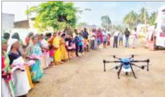
उत्सुकता और उत्साह से ड्रोन को देखता महिला किसानों का समूह।

भारत सरकार हजारों महिला स्वयं सहायता समूहों को ड्रोन प्रदान करेगी। हम अपने कृषि कार्यों के लिए ड्रोन सेवाएं उपलब्ध कराने की पहल करेंगे, शुरूआत में 15 हजार महिला स्वयं सहायता समूहों को ड्रोन का प्रशिक्षण दिया जाना है। प्रधानमंत्री की पहल पर महिला किसान ने ड्रोन