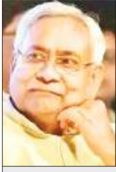
जदयू के राष्ट्रीय अध्यक्ष और प्रभारी राज्य में सक्रिय

रामगढ़ जाकर मां छिन्नमस्तिका के दरबार में मर्या टेकने के बाद दिल्ली लौट गए। इधर, युवा राष्ट्रीय जनता दल बेलता में दो दिवसीय प्रशिक्षण शिविर का आयोजन करने जा रहा है, ताकि कार्यकर्ताओं को गोलबंद किया जा सके।