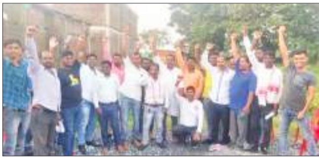
बैठक के बाद शक्ति प्रदर्शन करते हुए आदिवासी सेना के सदस्य एवं पदाधिकारी

जल्द बनाये। नीति नहीं बनने की वजह से झारखंड राज्य के युवा रोजगार के लिए भटक रहे हैं। उनका भविष्य सुरक्षित नजर नहीं है। आदिवासियों को हक एवं अधिकार दिलाये और आदिवासी छात्रों को शिक्षा लोन के साथ ही युवाओं को व्यवसाय के लिए आसानी से ऋण सुविधाएं उपलब्ध कराये, ताकि युवा मजबूती से आगे बढ़ें।