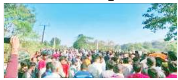
मंगलवार को निकाली गयी अंतिम यात्रा में हजारों लोग हुए शामिल।