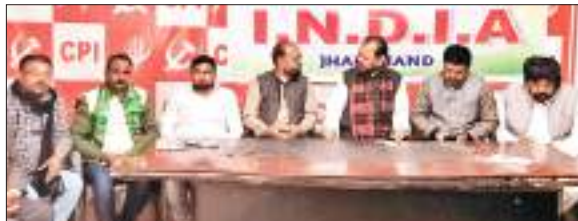
प्रकारों को जानकारी देते इंडिया घटक दलों के नेतागण।