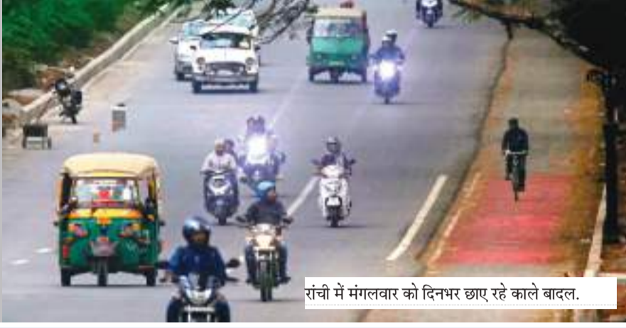
रांची में मंगलवार को दिनभर छाए रहे काले बादल।