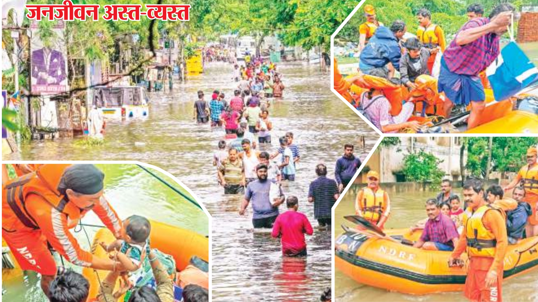
उत्तरी तटीय तमिलनाडु में चक्रवाती तूफान 'मिचौंग' के कारण चेन्नई और आसपास के जिलों में सोमवार को बाढ़ ने भारी तबाही मचाई, जिससे मरने वालों की संख्या बढ़कर सात हो गई. इसके साथ ही मंगलवार को शहर और उसके आसपास के जलभराव वाले इलाकों में फंसे लोगों को बचाने के लिए नौकाओं और ट्रैक्टर का इस्तेमाल किया गया. मंगलवार को सुबह से बारिश का असर कम रहा, जिससे अधिकारियों को बचाव और राहत कार्य तेज करने के लिए समय मिल गया है. कांचीपुरम में चक्रवात मिचौंग के कारण भारी बारिश के बाद जलजमाव वाले क्षेत्र से स्थानीय निवासियों को एनडीआरएफ कर्मियों द्वारा निकाला जा रहा है.