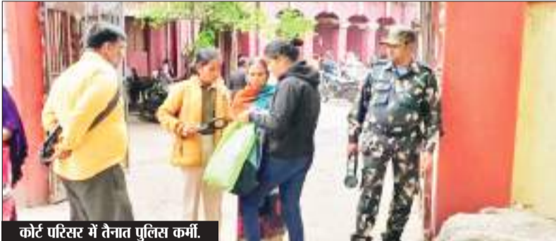
कोर्ट परिसर में तेजात पुलिस कर्मी.