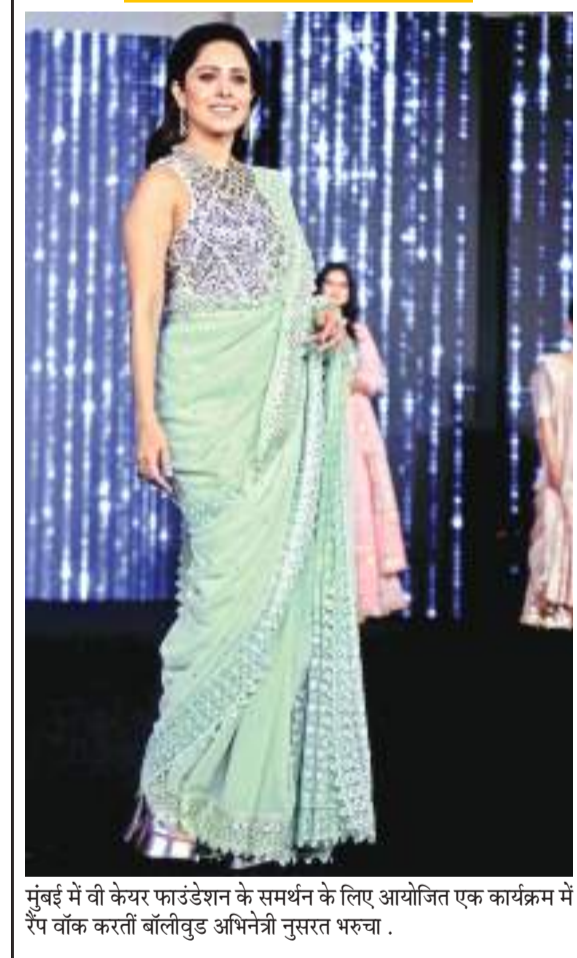
मुंबई में वी केयर फाउंडेशन के समर्थन के लिए आयोजित एक कार्यक्रम में रीप वॉक करती बॉलीवुड अभिनेत्री नुसरत बरुचा.