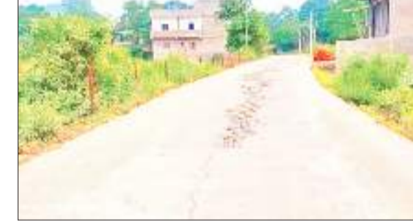
दरार को ठीक करने के लिए खोदा गया गड्ढा।