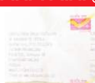
स्यूड पोस्ट से थाने को भेजी गयी शिकायत.