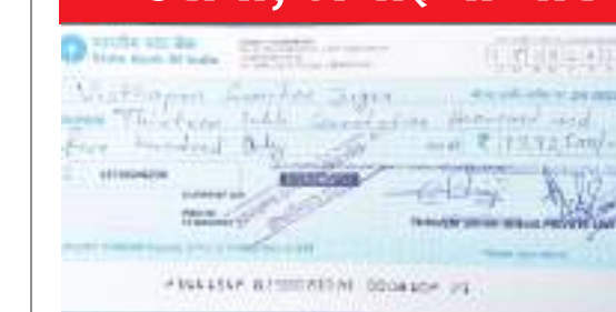
चेक की कॉपी. स्यूड पोस्ट से थाने को भेजी गयी शिकायत.