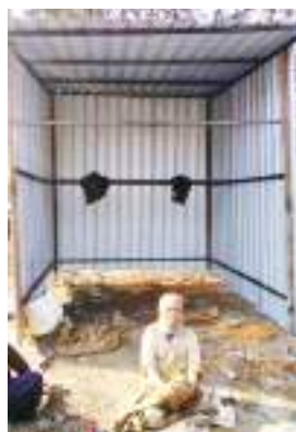
नई बनी दुकान में वृद्ध दुकानदार.