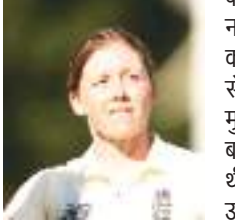
हीथर नाइट ने शनिवार को स्वीकार किया कि भारत ने उन्हें दिखाया कि इस तरह की मुश्किल परिस्थितियों में कैसे खेलना है.

इंग्लैंड महिला टीम की कप्तान हीथर नाइट ने शनिवार को स्वीकार किया कि भारत ने उन्हें दिखाया कि इस तरह की मुश्किल परिस्थितियों में कैसे खेलना है. नाइट ने यहां मैच खत्म होने के बाद कहा कि पिच संभवतः हमारी उम्मीद से थोड़ा अधिक तेजी से खराब हुई. मुझे लगता है कि पहली पारी में यह बल्लेबाजी के लिए काफी अच्छी पिच थी. उन्होंने कहा कि शनिवार को उन्होंने शानदार गेंदबाजी की. उन्होंने दिखाया कि इन परिस्थितियों में कैसे खेलना है. नाइट ने कहा कि शनिवार सुबह सीम मूवमेंट ने इसे काफी कठिन बना दिया. इस कारण हमारे शीर्ष क्रम के कुछ विकेट गिर गये थे.