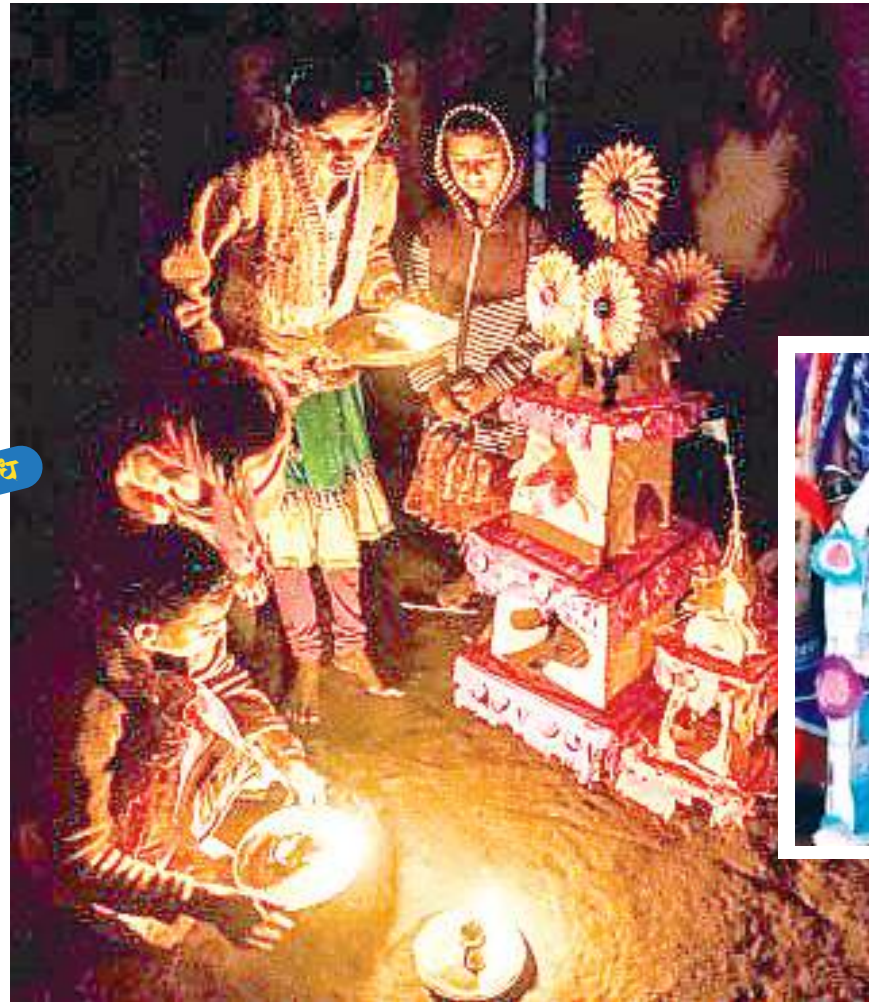
आरवा चावल से चौक (रंगोली) बनाती हैं। फिर उसके ऊपर एक छोटी चौकी रखी जाती है। चौकी के ऊपर धान के जड़ को जो खेत से लाया गया है उसे मिट्टी समेत रखा जाता है। उसके बाद दूध और पानी का ढार दिया जाता है।

चौकी के नीचे धूपधानी और गोबर रखा जाता है ताकि प्रत्येक दिन आरती के समय धुना और अगहन की जलायी जा सके। तत्पश्चात् सभी कुंवारी कन्या और महिलाएं मिल कर सस्वर दुसू गीत गाने लगती हैं। संध्या वंदन के समय गाए जाने वाला गीत --