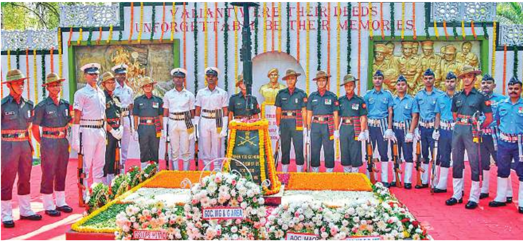
विजय दिवस के अवसर पर शनिवार को मुंबई के कोलाबा मिलिट्री स्टेशन पर त्रि-सेवा कर्मियों ने शहीदों को श्रद्धांजलि दी।