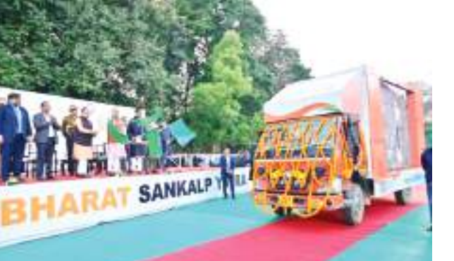
राज्यपाल ने कहा कि विकसित भारत संकल्प यात्रा ' एक विकसित एवं सशक्त राष्ट्र के निर्माण के प्रति प्रतिबद्धता व संकल्प है. पीएम मोदी द्वारा पांच राज्यों- मध्यप्रदेश, छत्तीसगढ़, राजस्थान, तेलंगाना और मिजोरम में 'विकसित भारत संकल्प यात्रा' का शुभारंभ किया जा रहा है. प्रधानमंत्री केंद्र सरकार की योजनाओं को जन-जन तक पहुंचाने के लिए कृत संकल्पित है. विकसित भारत संकल्प यात्रा ' का शुभारंभ प्रधानमंत्री द्वारा 'जनजातीय गौरव दिवस' के अवसर पर भगवान बिरसा मुंडा की पावन धरती से ही किया गया था.

राज्यपाल सीपी राधाकृष्णन ने शनिवार को 'विकसित भारत संकल्प यात्रा' के वैत को हरी झंडी दिखाकर रवाना किया तथा स्वयं सहायता समूह की महिलाओं एवं लाभार्थियों के मध्य परिस्पर्ति का वितरण किया. पुराने विधान सभा भवन के समीप आयोजित 'विकसित भारत संकल्प यात्रा' के तहत आयोजित कार्यक्रम में राज्यपाल ने कहा कि योजनाओं के प्रति लोगों के बीच जागरूकता आवश्यक है. इस कार्य में जन-प्रतिनिधियों की भागीदारी अत्यंत आवश्यक है. लोगों से कहा कि इस दिशा में अपने दायित्वों का निर्वहन करते हुए लोगों को विभिन्न योजनाओं के प्रति जागरूक करने के लिए प्रेरित करें. देश की आजादी के 100वें वर्ष अर्थात् 2047 तक एक विकसित राष्ट्र बनाना है. यह सबों के सामूहिक प्रयास से ही हासिल किया जा सकता है.