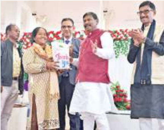
महिला को कृषि सामग्री देते अर्जुन मुंडा. साथ ही सांसद संजय सेठ व अन्य.

कृषि के सतत विकास और कृषक समुदायों की आजीविका बढ़ाने के मुद्दे पर भी उन्होंने बात की. मुंडा ने कहा कि किसान न केवल अपने परिवार का भरण-पोषण करते हैं, बल्कि देश