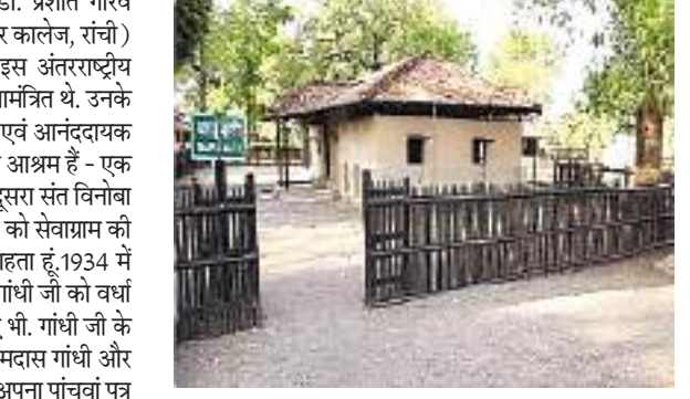
1936 में सेवाग्राम आश्रम की स्थापना की. यह वर्षा स्टेशन से 8 किलोमीटर दूर है. सेवाग्राम का पूर्व नाम 'शैवांग' था, लेकिन गांधी