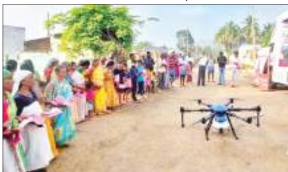
उत्सुकता और उत्साह से ड्रोन को देखता महिला किसानों का समूह।

भारत सरकार हजारों महिला स्वयं सहायता समूहों को ड्रोन प्रदान करेगी। हम अपने कृषि कार्यों के लिए ड्रोन सेवाएं उपलब्ध कराने की पहल करेंगे, शुरूआत में 15 हजार महिला स्वयं सहायता समूहों को ड्रोन का प्रशिक्षण दिया जाना है। प्रधानमंत्री की पहल पर महिला किसान ने ड्रोन