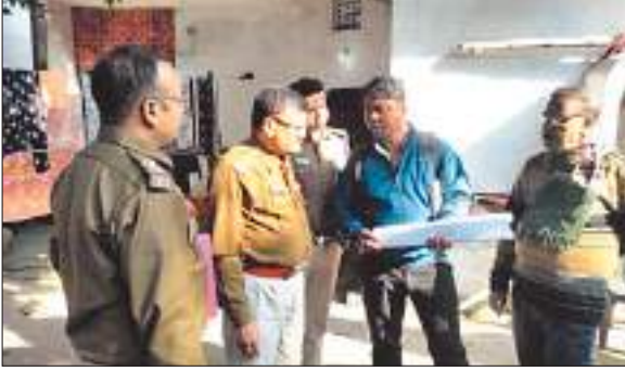
छापेमारी करती पुलिस.