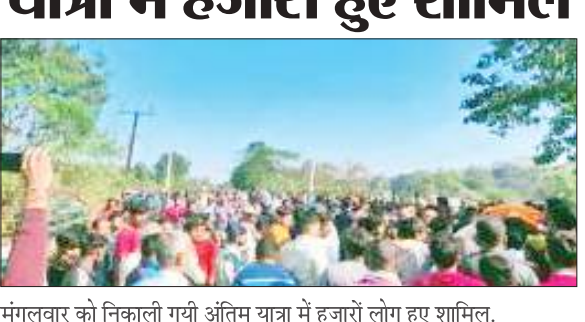
मंगलवार को निकाली गयी अंतिम यात्रा में हजारों लोग हुए शामिल।