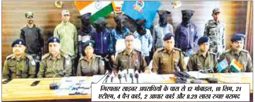
गिरफ्तार साइबर अपराधियों के पास से 12 मोबाइल, 18 सिम, 21 एटीएम, 4 पैन कार्ड, 2 आधार कार्ड और 8.29 लाख रुपए बरामद