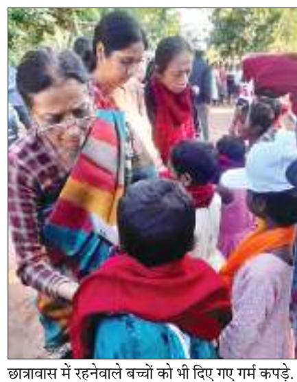
छात्रावास में रहनेवाले बच्चों को भी दिए गए गर्म कपड़े