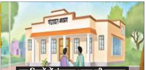
इन जिलों में पंचायत भवन की जरूरत

झारखंड के 16 जिलों की पंचायतों के लिए अच्छी खबर है। ये ऐसे जिले हैं जिनमें कई पंचायतों में अब तक पंचायत भवन नहीं बन सके थे। इस सूची में रांची सहित कोडरमा, लोहरदगा, बोकारो, पूर्वी सिंहभूम, पश्चिमी सिंहभूम, खूंटी, साहिबगंज, गुमला, पलामू, सरायकेला-खरसावा, गिरिडीह, पाकुड़, हजारीबाग और सिमडेगा जैसे जिले शामिल हैं। इनमें कुल 90 नए पंचायत भवन तैयार किए जाने हैं। पंचायत भवन की सुविधा मुहैया कराये जाने को पंचायती राज विभाग, झारखंड ने पहल की है। इन जिलों के डीडीसी को लेटर लिख कर बताया है कि पंचायत भवन के निर्माण, मंटेनेंस, नवीनीकरण, परिस्फितियों के निर्माण के लिए 27 करोड़ रुपए का उपावंटन किया गया है। यहाँ तक कि पहले फेज में इन जिलों को 30 फीसदी राशि का आवंटन भी कर दिया है।