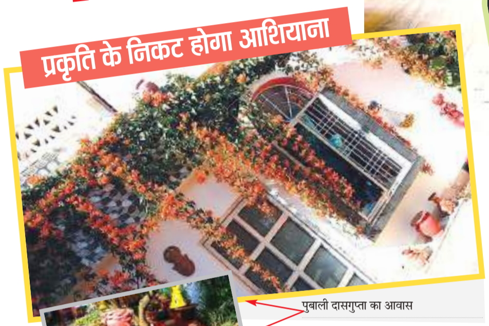
प्रकृति के निकट होगा आशियाना