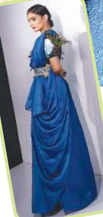
आईआईएफटी, रांची के डिजाइनर के कपड़े पहन कर दिल्ली में आयोजित जीआईसीडब्ल्यू के रैंप पर मॉडल.