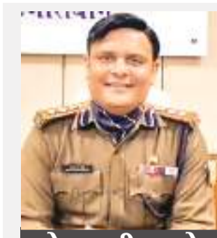
छेड़खानी करने वालों की खैर नहीं

इसे धरातल पर उतराने के लिए यह प्रयास किया जा रहा है। उन्होंने आम लोगों खास कर युवा पीढ़ी से अपील की है कि नव वर्ष का स्वागत पूरे उत्साह और उमंग के साथ करें। पुलिस सुरक्षा भी प्रदान करेगी। लेकिन नशे की