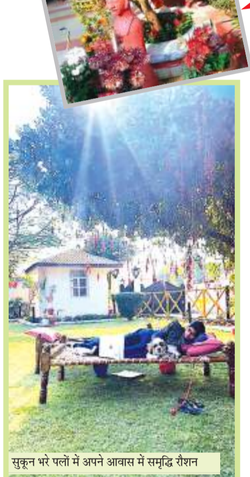
सुकून भरे पलों में अपने आवास में समृद्धि रीशन