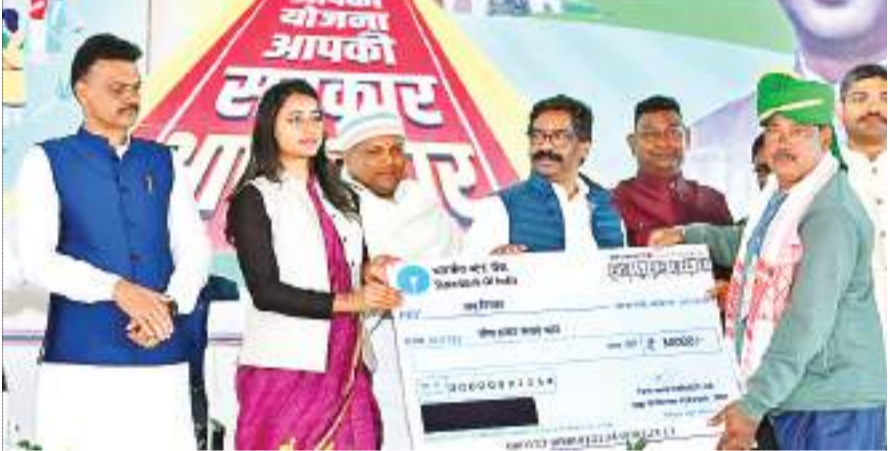
चतरा में आयोजित कार्यक्रम में मंगलवार को लाभुक को चेक प्रदान करते मुख्यमंत्री हेमंत सोरेन.