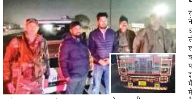
संबाददाता। कतरास/ बाघमारा