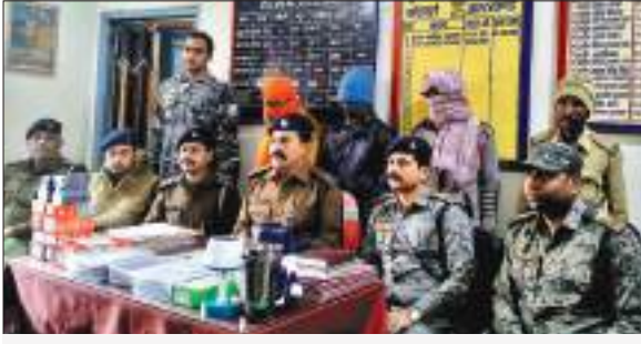
बरामद सामान: एन्ड्रॉयड मोबाइल 06 पीस, कीपैड मोबाइल 18 पीस, स्पीकर 2 पीस, लाइट 1 पीस, टैब 1 पीस, मिक्सी 1 पीस बरामद हुए हैं.

गोमिया अंचल पुलिस निरीक्षक के नेतृत्व में मोबाइल दुकान से चोरी करने वाले तीन चोरों को एंड्रॉयड मोबाइल और कीपैड के साथ गिरफ्तार किया है. इस संबंध में गोमिया थाना में प्रेस कॉन्फ्रेंस कर अंचल निरीक्षक ने जानकारी दी. उन्होंने बताया कि पिछले 01 नवंबर को गोमिया थाना क्षेत्र के तुलबुल सुंडी टोला स्थित सेवा सावक दुकान के उपर का शीट तोड़कर दुकान में रखे मोबाइल को अज्ञात चोरों के द्वारा चोरी कर लिया गया था. इस संबंध में गोमिया थाना में प्राथमिकी दर्ज किया