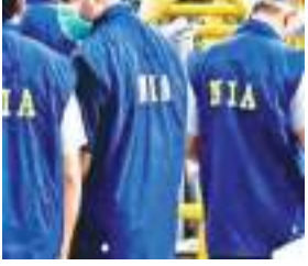
खूंटी, सिमडेगा, पलामू और पश्चिमी सिंहभूम जिले), बिहार (पटना जिला) और मध्य प्रदेश (सिद्धि जिले) में एक-एक स्थान और नई दिल्ली में दो स्थान शामिल हैं।

पीएलएफआई उग्रवादी संगठन के खिलाफ राष्ट्रीय जांच एजेंसी (एनआईए) ने झारखंड समेत चार राज्यों में छापेमारी की। इस दौरान एनआईए ने दो आरोपियों को गिरफ्तार किया, साथ ही हथियार और गोला-बारूद बरामद किए। एनआईए ने शुक्रवार को पीएलएफआई उग्रवादी संगठन से जुड़े झारखंड, बिहार, मध्य प्रदेश और नई दिल्ली में कुल 23 स्थानों की तलाशी ली गई। इनमें झारखंड में 19 स्थान (गुमला, रांची,