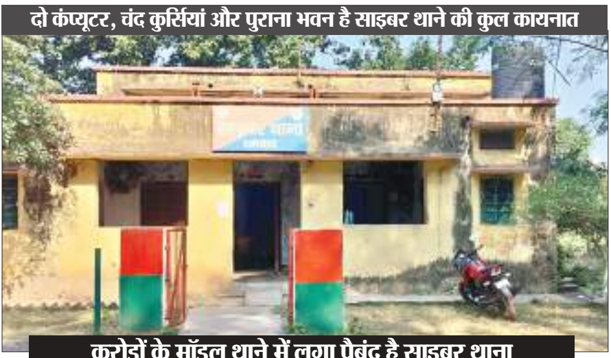
करोड़ों के मॉडल थाने में लगा पैबंद है साइबर थाना

न है गाड़ी और न मिलता तेल : वैसे तो धनबाद साइबर थाने के दर्द की सूची बहुत लंबी है. लेकिन जो सबसे ज्यादा तकलीफ देती है वो ये बात है कि इनके पास एक भी विभागीय वाहन नहीं है. गश्ती तो करनी नहीं है, लेकिन आरोपियों को पकड़ना तो होगा, ऐसे में वाहन कहां से आएगा, ये सोच हमेशा कामम रहती है. यदि कहीं से गाड़ी की व्यवस्था हो भी गई तो तेल का जुगाड़ अलग से सिरदर्द है. कहते हैं कि धर-पकड़ का काम अब एक दिन का तो है नहीं, हर दिन अपराधियों के पीछे दौड़ना है, टावर लोकेशन जहां का