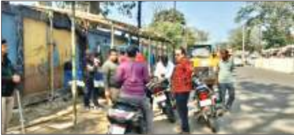
पुलिस लाइन के पास अतिक्रमण हटाने पहुंची निगम की टीम।

आईआईटी-आईएसएम धनबाद में रविवार की शाम आयोजित दीक्षांत समारोह में उपराष्ट्रपति जगदीप धनखंड बतौर मुख्य अतिथि शरीक हुए। उनके दिल्लीली लौटने के करीब 12 घंटे बाद सोमवार की सुबह से सड़कों के दोनों ओर अतिक्रमण शुरू हो गया है। सड़क के दोनों ओर आधी सड़क पर ठेले, खोमचे वालों के साथ कच्चा टेंट लगाकर फुटपाथ दुकानदारों ने सामान की बिक्री शुरू कर दी। रोड