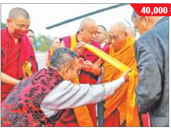
दलाई लामा (87) गंगटोक के एक होटल पहुंचे और आध्यात्मिक नेता की एक झलक पाने के लिए सैकड़ों विधायनसभा के कुछ सदस्य भी उनका स्वागत करने के लिए उपस्थित थे।

तिब्बती आध्यात्मिक नेता 14वें दलाई लामा तेनजिन ग्यात्सो 13 साल के अंतराल के बाद सिक्किम की तीन-दिवसीय यात्रा पर सोमवार सुबह यहां पहुंचे। वह राज्य में अपने प्रवास के दौरान 'बोधिसत्व के 37 अभ्यास' पर उपदेश देंगे। दलाई लामा सुबह करीब साढ़े दस बजे पूर्वी सिक्किम में लिंबिंग सैन्य हेलीपैड पर उतरे, जहां मुख्यमंत्री प्रेम सिंह तमांग ने उनका स्वागत किया। राज्य के विभिन्न मठों के बौद्ध भिक्षुओं ने पारंपरिक बौद्ध नृत्य और प्रार्थना 'शेरबंग' के साथ उनका भव्य स्वागत किया। निर्वासित तिब्बती संसद 'तिब्बतन सेटलमेंट