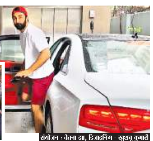
संयोजन : वेतना झा, डिजाइनिंग - खुशबू कुमारी