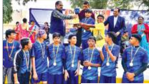
संवाददाता । आदित्यपुर