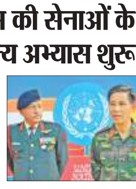
अपना सेवारत युद्धपोत 'आईएनएस कृष्णा' उपहार में दिया था। आर्याण (दक्षिण-पूर्व एशियाई देशों का संगठन) के महत्वपूर्ण सदस्य वियतनाम का दक्षिण चीन सागर क्षेत्र में चीन के साथ क्षेत्रीय विवाद है। दोनों सेनाओं के बीच 'विनबैक्स-23' नामक सैन्य अभ्यास हनोई में 11 से 21 दिसंबर तक होगा। भारतीय दल में 45 कर्मी शामिल हैं।

दक्षिण चीन सागर में चीन की बढ़ती आक्रामकता से उत्पन्न चिंताओं की पृष्ठभूमि में भारत और वियतनाम के बीच बढ़ती रणनीतिक भागीदारी के रुकने का कार्यक्रम है, उसके बाद वह पश्चिम बंगाल के सिलीगुड़ी के सालुगाड़ा के लिए रवाना होंगे। अक्टूबर में दलाई लामा की सिक्किम यात्रा अचामा की बाद के कारण रद्द कर दी गई थी। इस बाद में कई लोगों की जान चली गई थी और हजारों लोग विस्थापित हुए थे। चीन सीमा से लगभग 50 किलोमीटर दूर पलजोर स्टेडियम में 'बोधिसत्व के 37 अभ्यास' पर उपदेश देंगे।