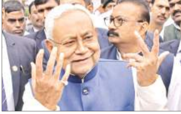
नहीं रहे थे, बाकी हम तो शामिल होंगे ही। नीतीश से जब यह सवाल किया

गया कि देश की मांग है आप नेतृत्व करें तो इसके जब आपने उन्होंने कहा कि नहीं यह सब बेकार है, हमारी नहीं