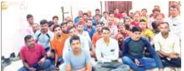
अपनी व्यथा बताते सऊदी अरब में फंसे झारखंड के प्रवासी मजदूर.

हजारबाग, गिरिडीह और बोकारो के 45 प्रवासी मजदूर सऊदी अरब में फंस गए हैं. सोशल मीडिया पर वीडियो पोस्ट कर भारत सरकार से वतन वापसी की गुहार लगा रहे हैं. 11 मई 2023 को इन तीन जिलों से मजदूर कंपनी एजेंट के माध्यम से सऊदी अरब काम करने के लिए गए थे. इसके लिए एजेंट ने मोटी रकम भी ली थी. सात महीने काम करने के बाद सभी मजदूर खुद को फंसा हुआ महसूस कर रहे हैं. आलम यह है कि इन मजदूरों को बंधक बनाकर काम कराया जा रहा है. जिस वेतनमान का वायदा कर उन्हें लाया गया था, उतना भुगतान नहीं किया जा रहा है. सात महीने काम करारक मात्र पांच महीने का वेतन दिया गया है. दो महीने का पगार बकाया है. ऐसे में मजदूरों के दिन फांकाकशी में गुजर रहे हैं.