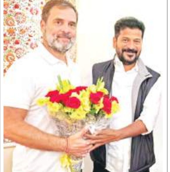
बुधवार को नई दिल्ली में एक बैठक के दौरान कांग्रेस नेता राहुल गांधी पार्टी के तेलंगाना प्रमुख ए रेवत रेड़ी के साथ.