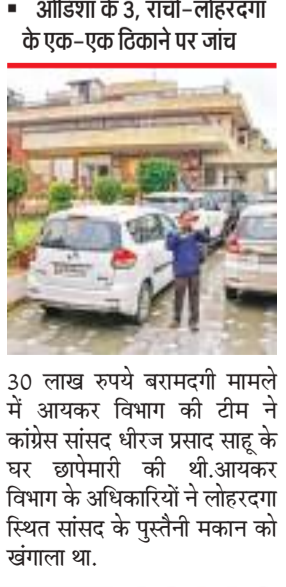
ओडिशा के 3, रांची-लोहरदगा के एक-एक ठिकाने पर जांच

कांग्रेस के राज्यसभा सांसद धीरज साहू के रांची, लोहरदगा और ओडिशा के पांच ठिकानों पर आयकर विभाग की टीम सर्वे कर रही है. बुधवार सुबह ओडिशा आयकर विभाग की टीम ने सांसद साहू के पांच ठिकानों पर पहुंचकर कागजात खंगालना शुरू किया. ओडिशा में तीन, लोहरदगा में एक और रांची में एक ठिकाने पर पुलिस बल की मौजूदगी में इनकम टैक्स की टीम सर्वे कर रही है, जिसमें आवश्यक कागजात की जांच की जा रही है. हालांकि लोहरदगा में साहू परिवार का कोई भी सदस्य मौजूद नहीं है. मुख्य द्वार को बंद कर दिया गया है और अंदर कागजात की जांच की जा रही है. बता दें कि इससे पहले भी 12 दिसंबर 2019 को रांची एयरपोर्ट से