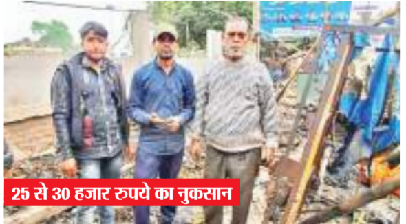
25 से 30 हजार रुपये का नुकसान