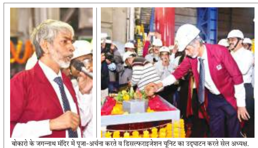
बोकारो के जगन्नाथ मंदिर में पूजा-अर्चना करते व डिसलफराइजेशन यूनिट का उद्घाटन करते सेल अध्यक्ष।