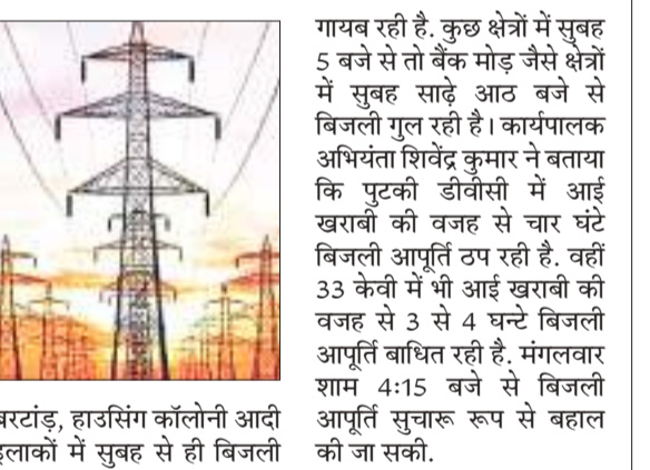
बरटांड, हाउसिंग कॉलोनी आदि इलाकों में सुबह से ही बिजली

धनबाद में पानी और बिजली का रिश्ता भूष और भैंसर जैसा हो गया है। पानी देखते ही बिजली चली जाती है। बुधवार को सुबह पांच बजे से बारिश के शुरू होते ही बिजली काफ़ी गई। शहर के अधिकांश हिस्सों में 8 से 10 घंटे बिजली गुल रही। बैंक मोड़, हीरापुर, नया बाजार, गांधी रोड, पुराना बाजार, मनईटांड, पतराकुलिह, विनोद नगर, बरमसिया, जय प्रकाश नगर,