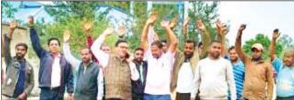
बंद पानी टंकी के पास प्रदर्शन करते ग्रामीण ( फाइल फोटो )।