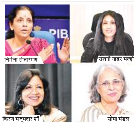
निर्मला सीतारमण रोशनी नाडर मल्होत्रा किरण मजूमदार शॉ सोमा मंडल

अमेरिकी बिजनेस मैगजीन फोर्ब्स हर साल दुनिया की 100 ताकतवर महिलाओं की लिस्ट जारी करती है. फोर्ब्स के अनुसार, रैंकिंग का निर्धारण चार प्रमुख मैट्रिक्स के आधार पर होता है. यह पैसा, मीडिया, प्रभाव और प्रभाव के क्षेत्र पर निर्भर करता है. खबरों के अनुसार फोर्ब्स ने राजनीतिक लोगों के लिए जीडीपी और पॉपुलेशन को मानक माना है. वहीं कॉर्पोरेट लीडर्स के लिए राजस्व, मूल्यांकन और एंजलॉयज की संख्या मानक है.