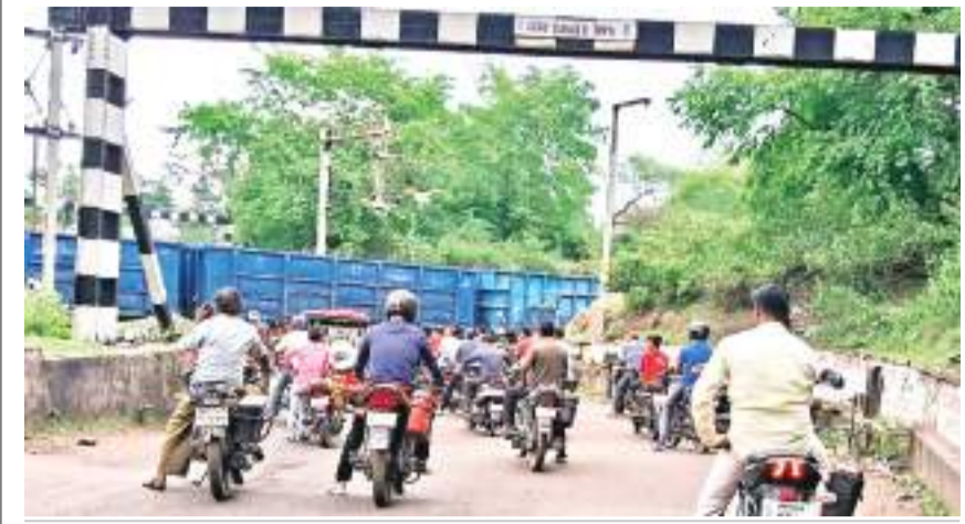
सांसद-विधायक गंभीर पर रेलवे बेपरवाह

दक्षिण पूर्व रेलवे के आद्रा रेल मंडल अंतर्गत बाघमारा-डुमरा मार्ग पर केबिन के समीप बना रेल फाटक यहां से गुजरने वाले लोगों के लिए परेशानी का सबब बन गया है। दिन भर में दर्जनों बार फाटक बंद होने से आम जनता को न सिर्फ परेशानियां बढ़ी हैं, बल्कि लोगों का घंटों समय बर्बाद होता है। डुमरा तरफ जाने या फिर बाघमारा की ओर आने के लिए लोगों को रेलवे फाटक पर देर तक मुकदशक बन खड़ा रहना पड़ता है। जानकारी के अनुसार बीसीसीएल के ब्लॉक दो एवं बरोरा क्षेत्र के बेनीडीह रेलवे साइडिंग से कोयला लोड होने वाला रेलवे कार रोक खानुडीह स्टेशन के समीप लगाए गए वजन घर से वजन के क्रम में दिन भर में कई बार चक्कर लगाता है। एक बार रेलवे वैगन खाली होता है, तो दूसरी बार कोयला लोड होता है। बताया जाता है कि रेलवे वैगन के आने-जाने का सिलसिला दिन भर में दर्जनों बार होता है। रोजाना 8-10 रेल लगी है। इसके अलावा खानुडीह स्टेशन होकर कई पैसेंजर एवं एक्सप्रेस ट्रेनों का परिचालन