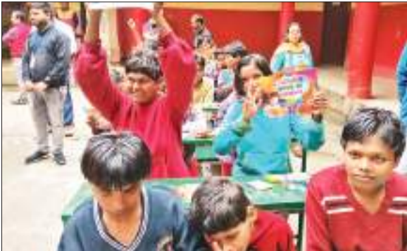
दिव्यांग बच्चों के साथ ईएसएल के अधिकारी।

सीएसआर विभाग और उसके सहयोगी कार्यान्वयन करनेवाले एनजीओ ने अंतरराष्ट्रीय स्वयंसेवक दिवस के अवसर पर मानव सेवा