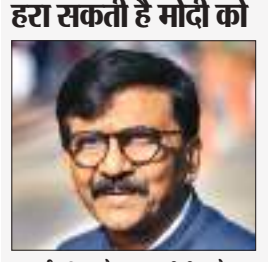
मुंबई। शिवसेना (यूबीटी) के नेता संजय राउत ने रविवार को कांग्रेस को आगह करते हुए कहा कि अगर गांधी परिवार के नजदीकी लोग प्रधानमंत्री नरेंद्र मोदी के अनुकूल राजनीति करते रहेंगे, तो देश की सबसे पुरानी पार्टी को 2024 के लोकसभा चुनाव में और मुश्किल का सामना करना पड़ेगा। उन्होंने कहा कि गांधी परिवार के कुछ करीबी मोदी-शाह के पिछलग्गू बन जाते हैं, जिससे चुनावों में कांग्रेस को नुकसान उठाना पड़ता है। इससे छूटकारा पाना होगा। पार्टी के मुखपत्र सामना में संजय राउत ने इलेक्ट्रॉनिक वोटिंग मशीन (ईवीएम) संबंधी आशंका को उठाने का आह्वान किया। उन्होंने दावा किया कि मध्य प्रदेश में जब मतपत्र (डाक मतपत्र) की गिनती हो रही थी, तब कांग्रेस 1999 सीट पर आगे चल रही थी, लेकिन ईवीएम से गिनती शुरू होने के साथ ही परिस्थिति बदल गई।