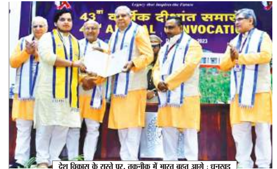
देश विकास के रास्ते पर, तकनीक में भारत बहुत आगे : धनखड़

आप अपने परिवार से ऊपर उठ कर देश व समाज के लिए योगदान करें। उन्होंने पास आउट विद्यार्थियों से हमेशा संस्थान, फैकल्टी व उनसे जुड़े रहने की अपील की, जिसकी बदौलत उन्होंने सफलता पाई है। उन्होंने कहा कि एकेडमिक पढ़ाई का अंत नहीं है। जीवन में हमेशा सीखते रहें।