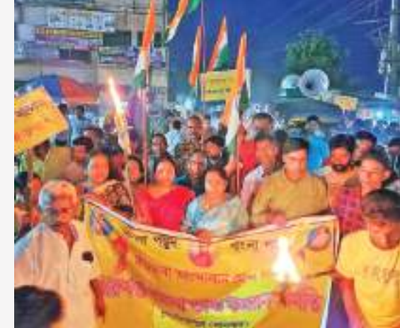
आज बांग्ला भाषा की पढ़ाई हो