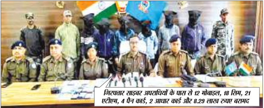
गिरफ्तार साइबर अपराधियों के पास से 12 मोबाइल, 18 सिम, 21 एटीएम, 4 पैन कार्ड, 2 आधार कार्ड और 8.29 लाख रुपए बरामद