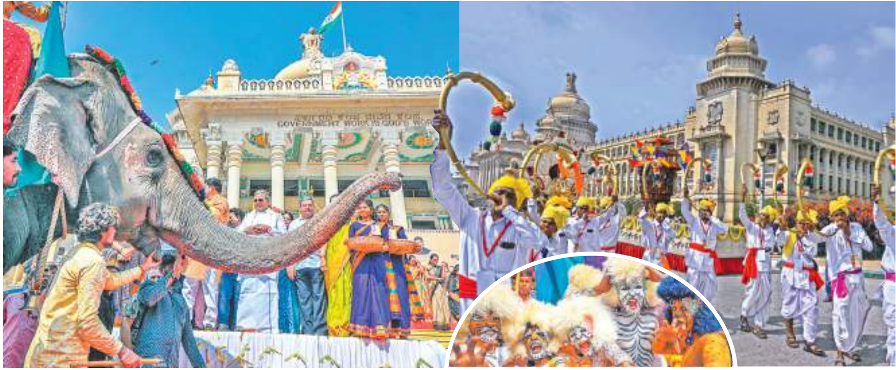
बंगलुरु में रविवार को नम्मा जात्रे कार्यक्रम के उद्घाटन के दौरान कर्नाटक के मुख्यमंत्री सिद्धारमैया. इसमें लोक कलाकारों ने आकर्षक प्रस्तुति दी.