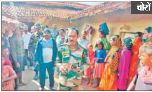
चोरों को पकड़ने में पुलिस हो रही है विफल : जिला सचिव