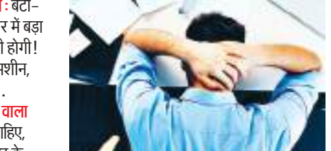
स्तर पर तैयारी होती है। हाल, लाइट, साउंड, डेकोरेशन, कैटरिंग पर इतना खर्च! लोन लीजिए या किकिनी बेचिए, इससे परिवार वालों को क्या!

हमारे देश में 12 हजार से 40 हजार मासिक कमाने वाला परिवार लो मिडिल क्लास में आता है। 90% भारतीय परिवार इसी गृह में आते हैं। इन परिवारों में कमाने वाला सदस्य एक होता है और साधारण तौर पर वह पुरुष होता है अर्थात् पति। उसपर तीन या चार लोग आश्रित होते हैं - पत्नी, दो बच्चे, पति के माता/पिता या दोनों। सभी की फ्रमाइश पूरी करते-करते बेचारे की पूरी जीभ बाहर आ जाती है। आइए, डालते हैं एक नजर पूरे परिवार के शोक के ऊपर जो 'हेड ऑफ द फैमिली' का बीपी, शुगर बढ़ाने के साथ-साथ कभी-कभी हार्ट अटैक का कारण भी बन जाता है।