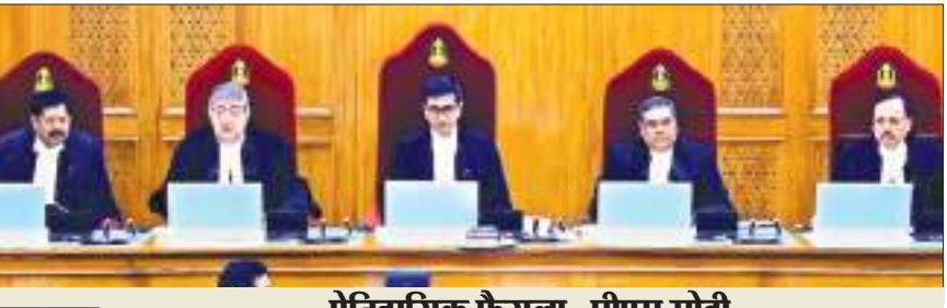
ऐतिहासिक फैसला : पीएम मोदी

सुप्रीम कोर्ट ने पूर्ववर्ती जम्मू-कश्मीर राज्य को विशेष दर्जा देने वाली धारा 370 के प्रावधानों को निरस्त करने के केंद्र के फैसले को सर्वसम्मति से बरकरार रखा और राज्य का दर्जा जल्द से जल्द बहाल किए जाने एवं 30 सितंबर 2024 तक विधानसभा चुनाव कराने का निर्देश दिया है।