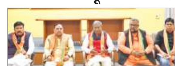
रांची स्थित प्रदेश कार्यालय में भाजपा विस्तारकों के साथ बाबूलाल मरांडी।