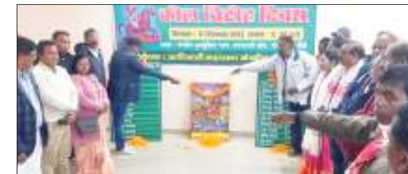
श्रद्धांजलि अर्पित करते आदिवासी संगठन के प्रतिनिधिगण।