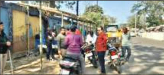
पुलिस लाइन के पास अतिक्रमण हटाने पहुंची निगम की टीम.

आईआईटी-आईएसएम धनबाद में रविवार की शाम आयोजित दीक्षांत समारोह में उपराष्ट्रपति जगदीप धनखड़ बतौर मुख्य अतिथि शरीक हुए. उनके दिल्ली लौटने के करीब 12 घंटे बाद सोमवार की सुबह से सड़कों के दोनों ओर अतिक्रमण शुरू हो गया है. सड़क के दोनों ओर आधी सड़क पर ठेले, खोमचे वालों के साथ कच्चा टेंट लगाकर फुटपाथ दुकानदारों ने सामान की बिक्री शुरू कर दी. रोड