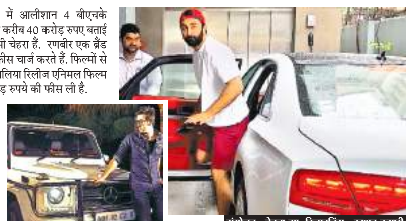
संयोजन : वेतना झा, डिजाइनिंग - खुशबू कुमारी

अभी कुछ महीने पहले ही रणबीर कपूर ने स्वैकी रेंज रोवर कार खरीदी जिसकी कीमत 4 करोड़ रुपये बताई जा रही है. उनकी यह कार ब्लैक कलर की है. रणबीर के पास पहले से ही लैंड रोवर रेंज रोवर वॉग है जिसकी कीमत लगभग 1.6 करोड़ रुपये है. इसके अलावा लैंड रोवर रेंज रोवर स्पोर्ट जो लगभग 87 लाख रुपये की है. रणबीर कपूर के पास मर्सिडीज-बेंज जी 63 एएमजी (2.14 करोड़ रुपये), ऑडी ए8 एल (1.56 करोड़ रुपये) और ऑडी आर 8 (2.72 करोड़ रुपये) जैसी कई लगजरी गाड़ियां हैं.