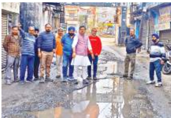
सड़क में जमा पानी को दिखाते स्थानीय लोग।