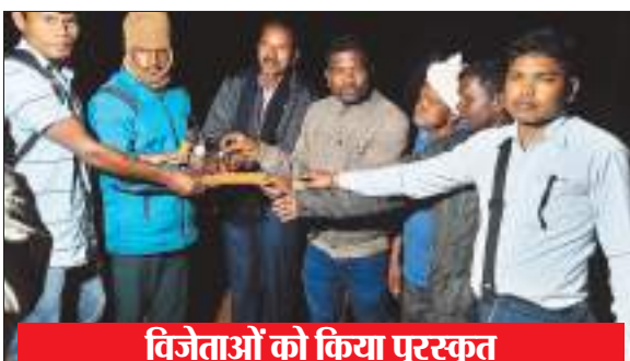
विजेताओं को किया पुरस्कृत

नोवामुंडी प्रखंड के डुमरजोवा में सरना क्लब की ओर से दो दिवसीय फुटबॉल प्रतियोगिता का समापन किया गया। फाइनल मैच आबु दो आबु गे और शशि एफ के बीच खेला गया। जिसमें आबु दो आबु गे की टीम को 0-1 से पराजित किया। प्रतियोगिता के विजेता टीम शशि एफ को 6300 सौ रुपए नकद और बत्तख, उपविजेता को 5300 सौ रुपए नकद और बत्तख, तृतीय हुरुद व एक को 4300 सौ रुपए नकद और बत्तख, चतुर्थ जी एस पी किंगल को 3300 सौ रुपए नकद और बत्तख, पांचवा बासु ब्रदर्स 2200 सौ रुपए नकद, छठवा सेलदौरी एफ 1200 सौ रुपए नकद, सातवा हार्दिक एफ 1000 रुपए नकद, आठवा स्थान स्मार्ट बॉय एच बी एस को 1000 रुपयों की नगद राशि देकर सम्मानित किया गया। जगन्नाथपुर विधानसभा